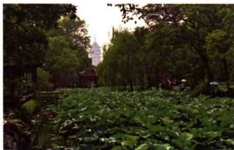
图 1-8 苏州拙政园与远处的北寺塔 [2]