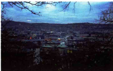
图 1-14 凹地形的城市