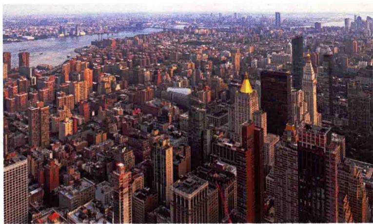
图 1-1 城市的物质形体环境

城市景观是指在城市范围内的各种物质形体环境（包括自然环境和人工环境）通过人的感知后获得的视觉形象，由城市建筑、城市街道、水系、公共空间等多种元素综合构成（图 1-1）。城市景观具有两元结构特征，既包括城市物质形体环境，又包括在其中的人的生活方式与特定的文化活动（图 1-2）。