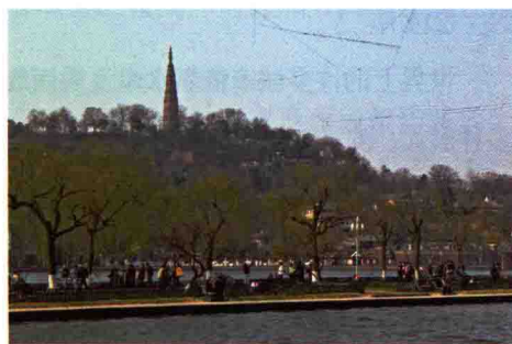
图 1-20 杭州西湖风景区