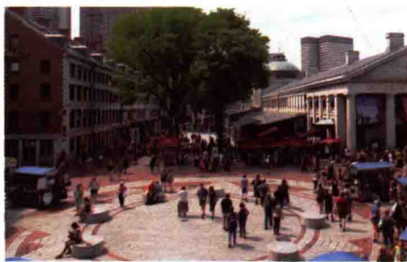
图 1-21 商业性街道广场

各地建筑材料和建造技术的差异以及人们不同的建筑观，给每个城市带来丰富多样的建筑形态，从而构成各不相同的城市景观。