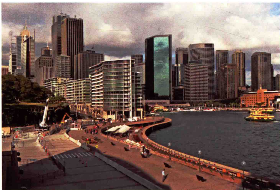
图 1-18 不同功能的滨水空间