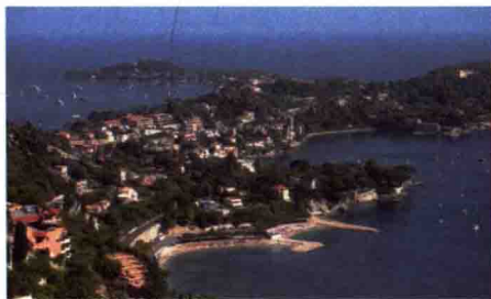
图1-6 自然山水景观城市