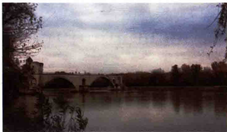
图1-7 建于12世纪的阿维尼翁 11 断桥