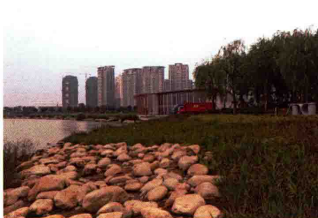
图 1-16 生态型滨水景观