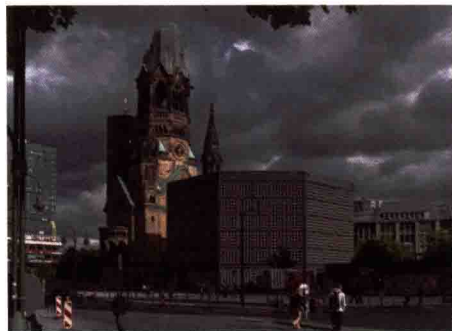
图 1-4 不同时代城市景观的叠加