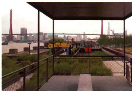
图 1-24 休闲性街道广场