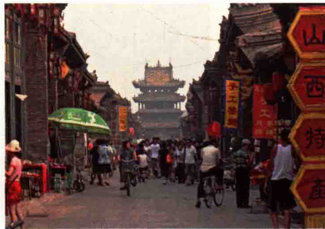
图 1-5 城市景观的地域性