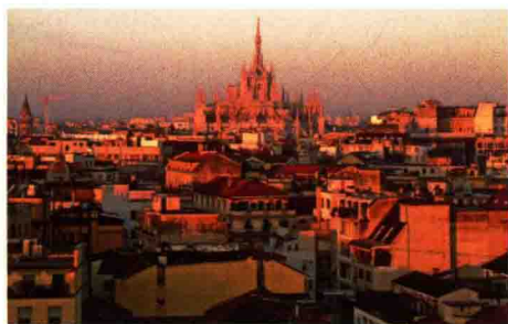
图 1-9 意大利米兰大教堂 [3]