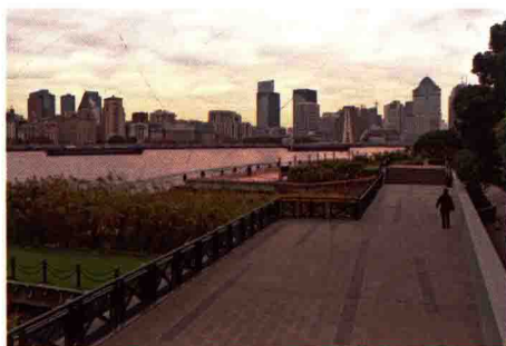
图 1-17 防洪改造滨水景观