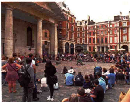
图 1-2 城市的文化活动

城市是历史的积淀，每个阶段的层积过程都留下具有时代特色的痕迹，城市景观是城市不同时代、不同功能的要素叠加起来的结果（图 1-4）。城市景观随着城市的发展而变化，因此具有历时性。