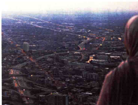
图 1-3 “景”与“观”的结合