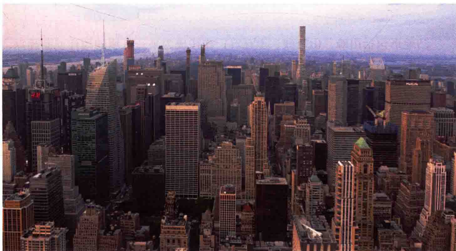
图 1-12 现代人工景观城市

现代人工景观城市是指由人类活动直接建造的，不同于自然基质，以展现人类大规模、高技术建设和建造成就为主要景观的城市，如一个国家的首都、综合性国际大都市、娱乐消费城市、工业景观城市等。这类城市寄托了人类对现代都市的期许与理解，并大量运用高新技术手段呈现出崭新的城市面貌（图 1-12）。