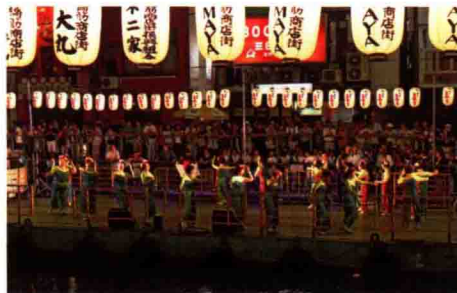
图 1-10 日本大阪道顿堀的夏日祭 [4]