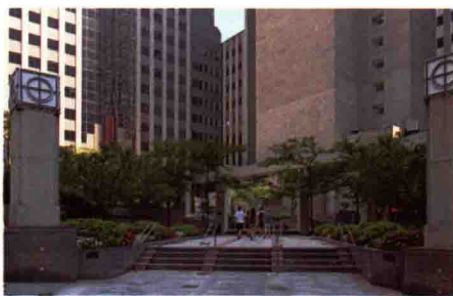
图 1-22 办公性街道广场