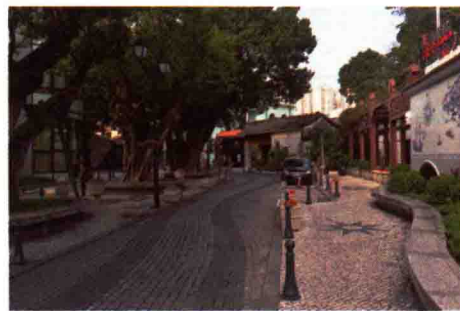
图 1-23 生活性街道广场