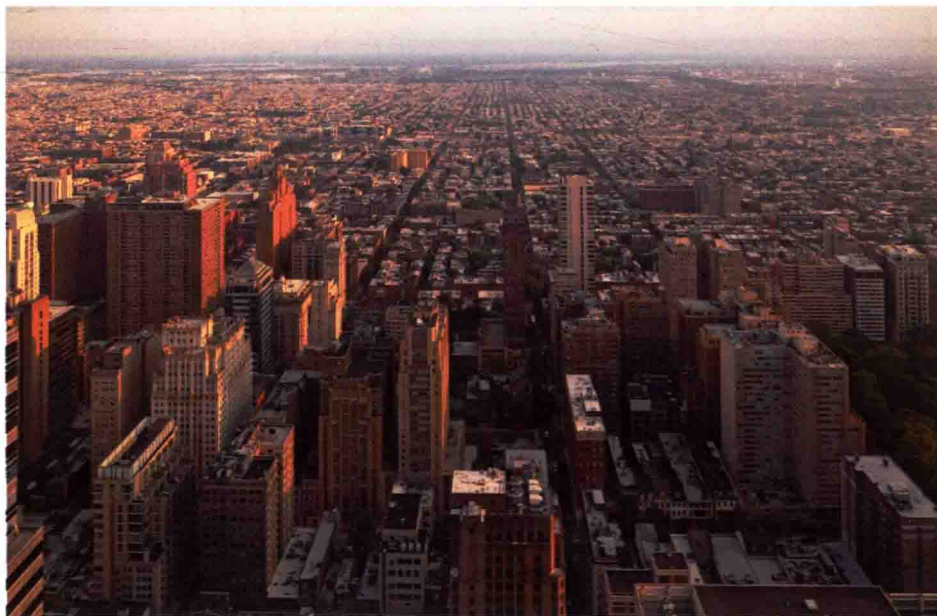
图 1-15 平坦地形的城市