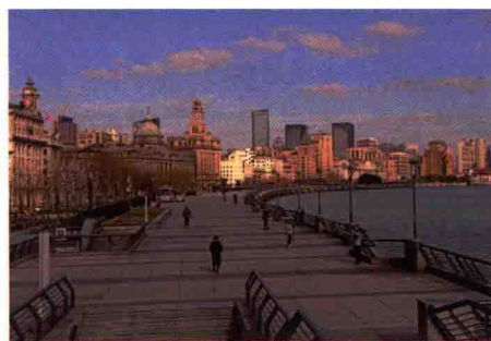
图 1-19 彰显城市历史人文特征的滨水空间