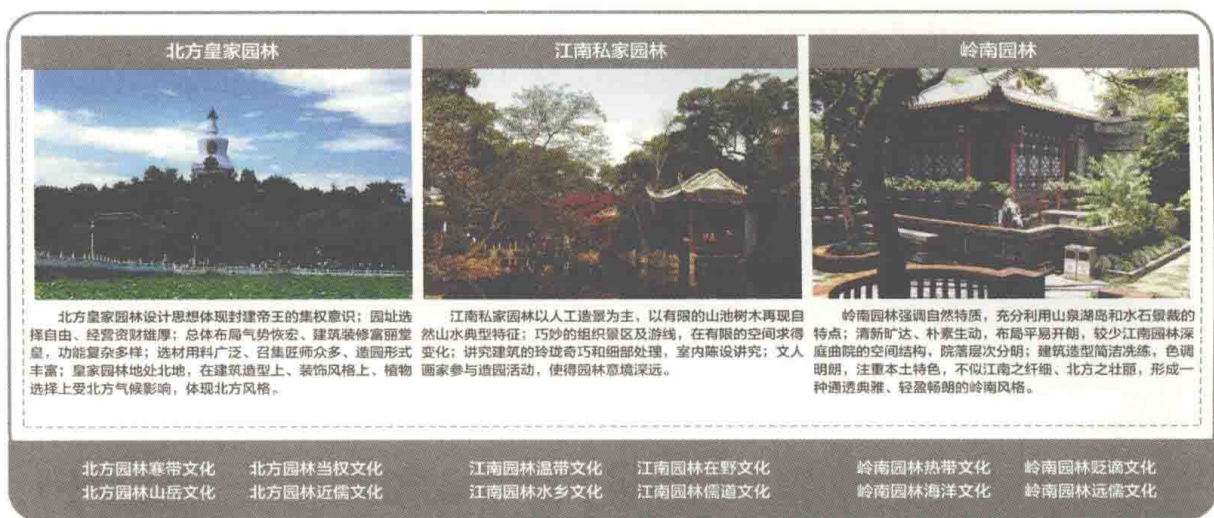
图1-7 古典园林三大风格 徐钰涓