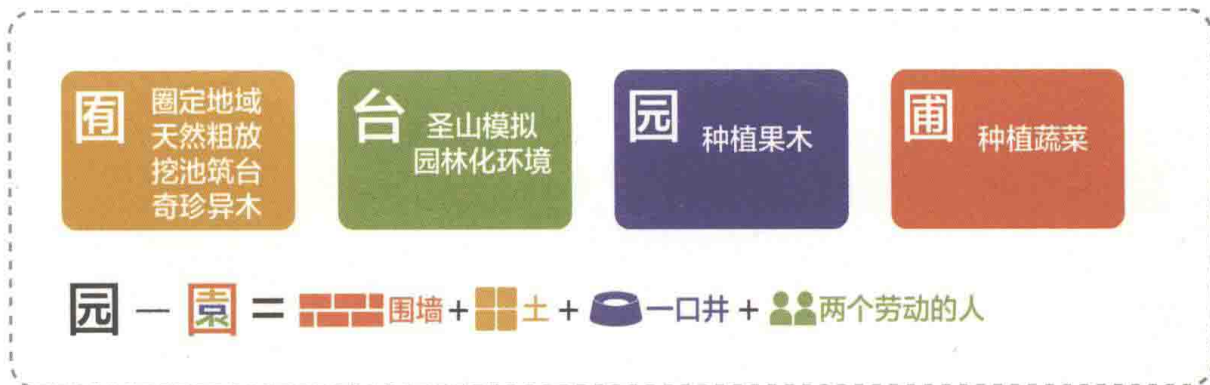
图1-1 园林起源概括 徐钰涓

中国园林最初的形式为“囿”，园林里的主要建筑为台。“囿”作为园林的雏形，就是在一定的地域范围内，让天然的植被和鸟兽滋生繁育。同时，挖池筑台，供帝王贵族们狩猎和游乐。而“台”早期的功能则是对圣山的模拟，后来功能扩大，周围环境也进一步园林化。此外，还有种植果木的“园”、种植蔬菜的“圃”等（图1-1）。这一时期园林主要承载着狩猎、通神、求仙、生产等繁杂的功能。君子比德、天人合一、神仙思想使得中国园林