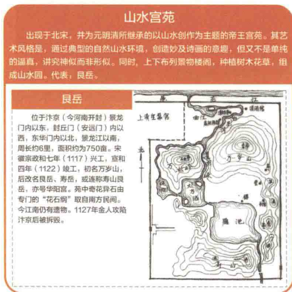
图1-5 山水宫苑 徐钰涓