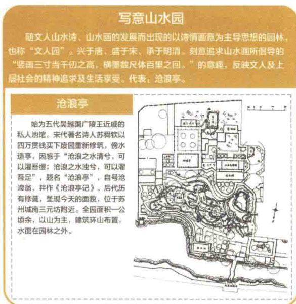
图1-6 写意山水园 徐钰涓