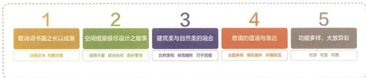
图1-8 中国传统园林的特点 徐钰涓

中国传统园林的特点是以自然式著称。虽然南方园林与北方园林存在差异，皇家宫苑与私家园林尚有不同，少数民族地区因地域特征而各有其特性，但是总而言之，典型的中国传统园林仍然具有统一的特点（图1-8）。