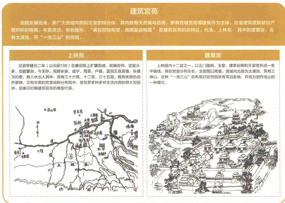
图1-2 建筑宫苑 徐钰涓

秦始皇结束了春秋战国以来中国长期分裂的政治局面，统一的集权政治催生了皇家园林这一宏大的园林类型，“经纬阴阳”“体象天地”“蕴涵万物”是这一时期皇家园林的典型特点。同时，由于以圣山为象征的“昆仑神话”逐渐向以海上仙山为蓝本的“蓬莱神话”的转移，使得“一池三山”的理水模式得以确立并延续。这一时期的私家园林从内容、形式上都以模仿皇家园林为主。秦汉建筑宫苑和私家园林有一个共同的特点，即大量建筑与山水相结合布局，我国园林的这一传统特点至此奠定（图1-2）。历史上有名的宫苑有“上林苑”“建章宫”“长乐宫”“未央宫”等。