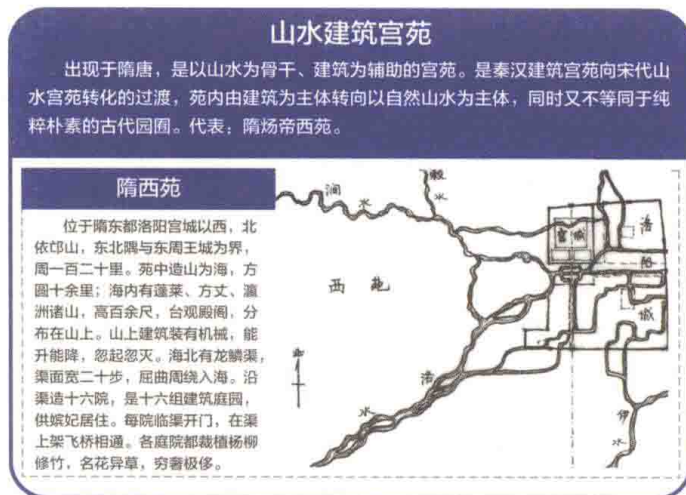
图1-4 山水建筑宫苑 徐钰涓