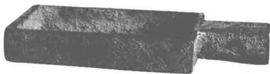
商鞅铜方量（商鞅变法时颁布的标准量器）

元前350年一次。商鞅变法是中国历史上非常彻底的一场运动，虽然商鞅身死，但秦法未败，这在中国历史上也很独特。 ⑥