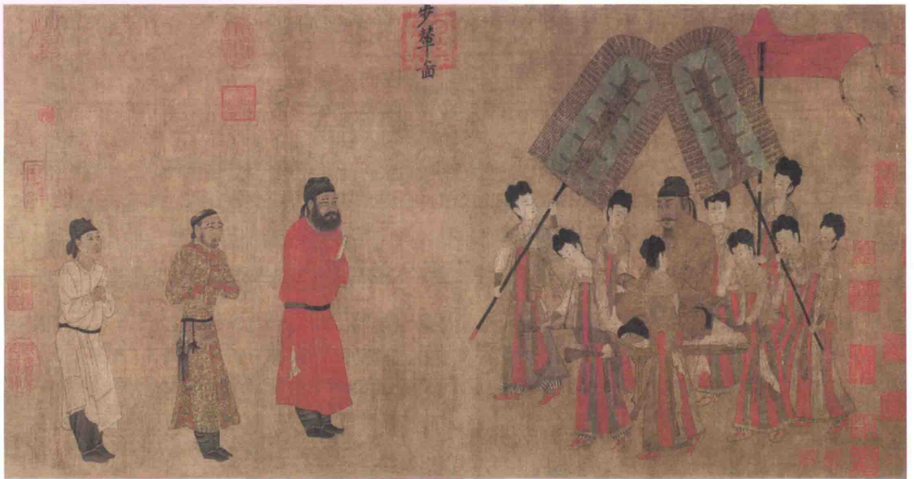
装裱：卷 材质：绢 尺寸：纵38.5厘米，横128.6厘米

幞头 指古代男子日常包裹头部的纱罗软巾。具体用法是，先用头巾包住头发，再将两根带子从额前系到脑后。