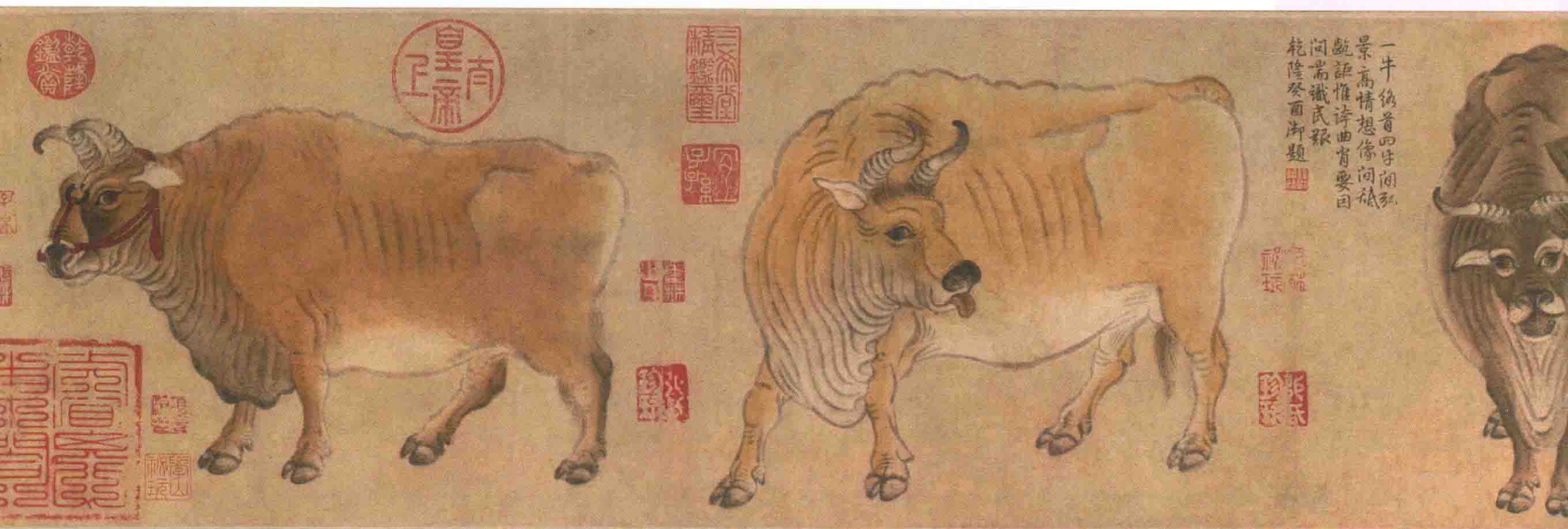
装裱：卷 材质：纸 尺寸：纵20.8厘米，横139.8厘米

《五牛图》构图极为巧妙。每头牛姿态各异，既能单独成画，又可组成以褐色牛为中心的对称画面。