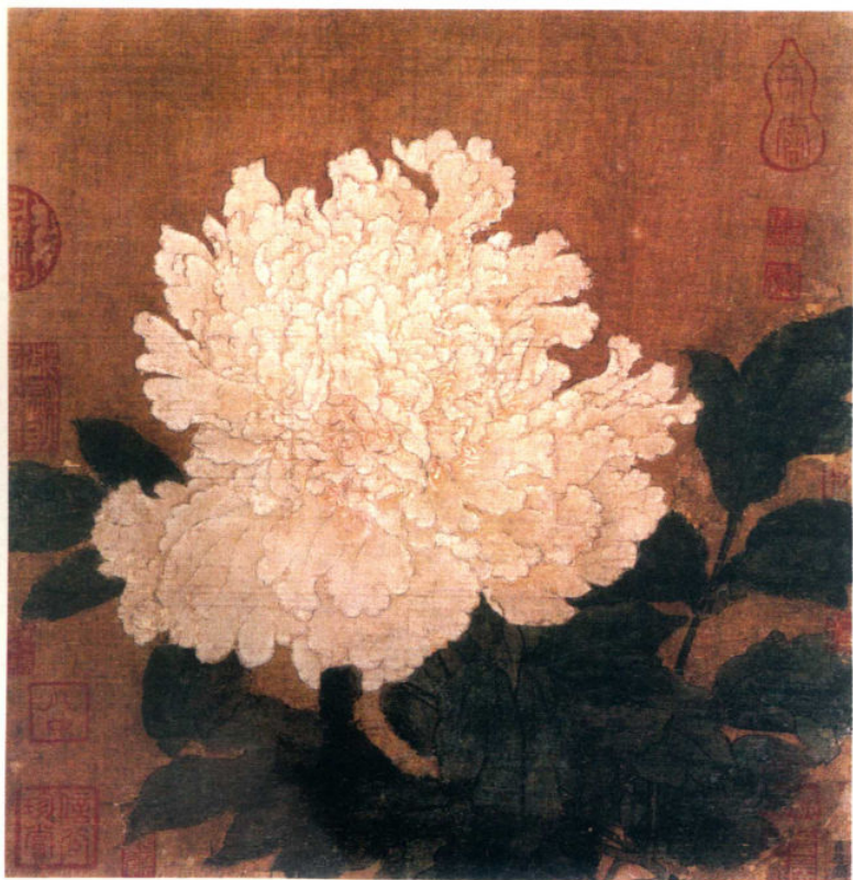
五代 徐熙（传）牡丹图 绢本设色

宋代人物画继承了晋唐以来的法度，也有自己独特的成就，用线劲健有神，刻画栩栩如生，富有生活情趣，在小品画作上的表现也是十分精彩的。