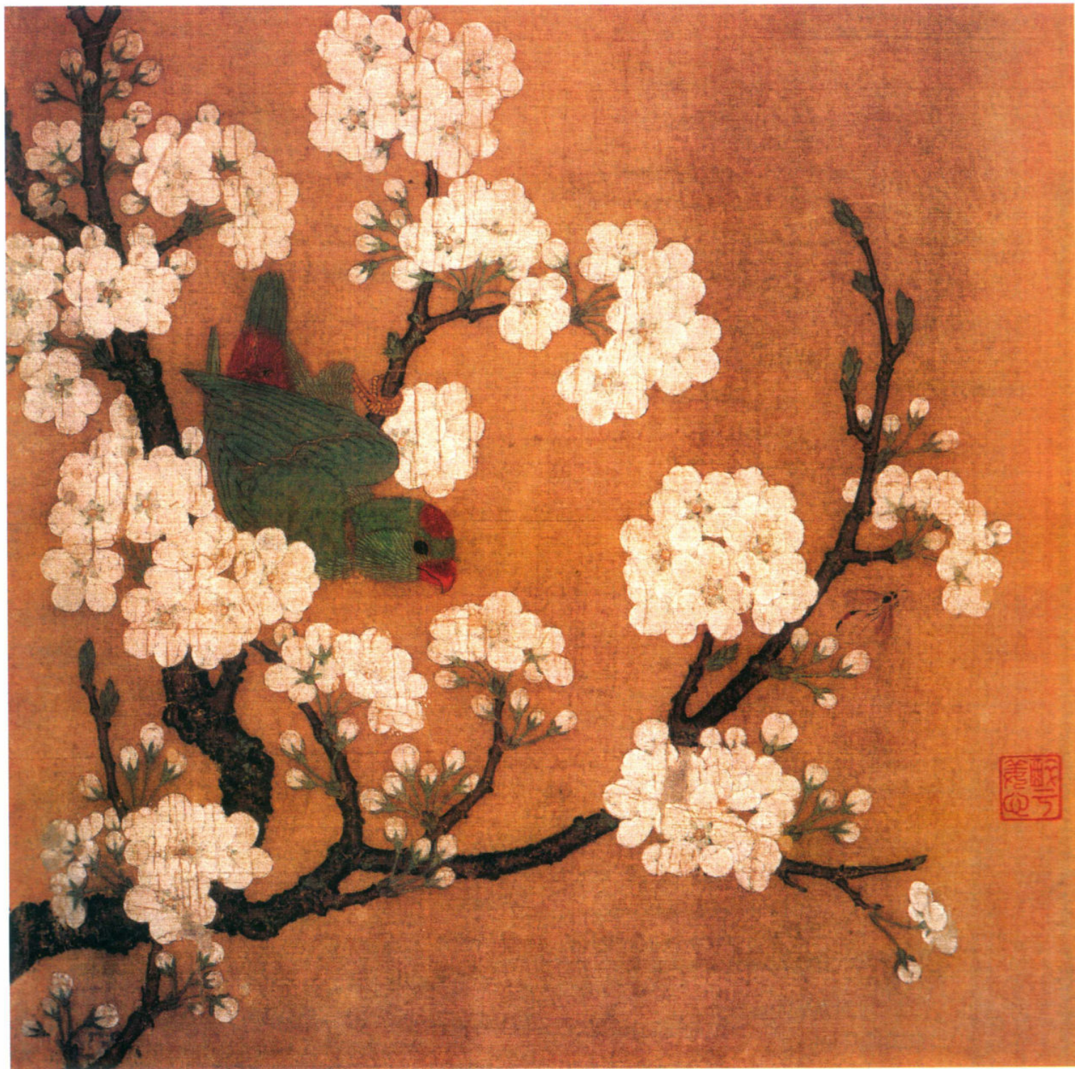
宋 佚名 梨花鹦鹉图 绢本设色