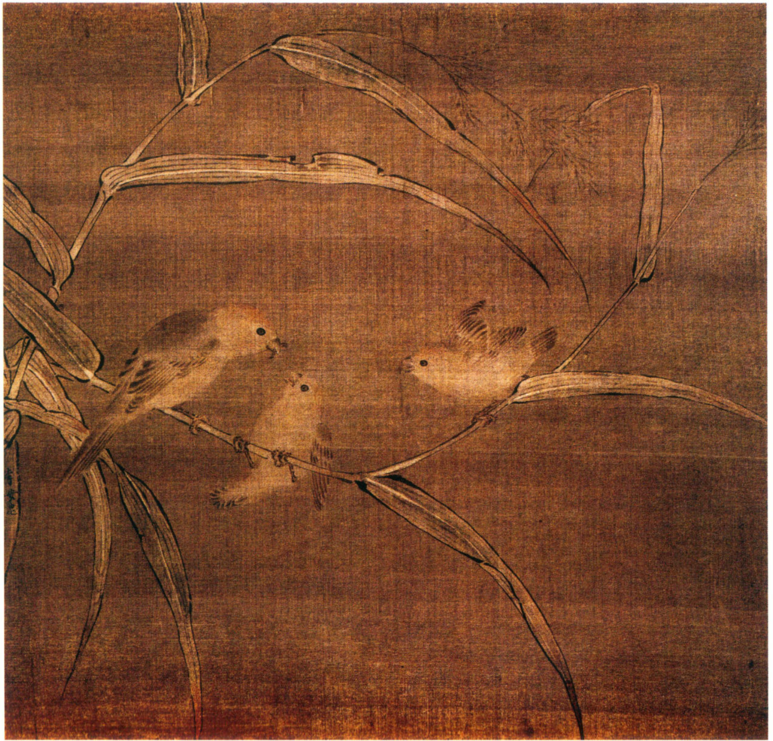
南宋 李安忠 哺雏图 绢本设色