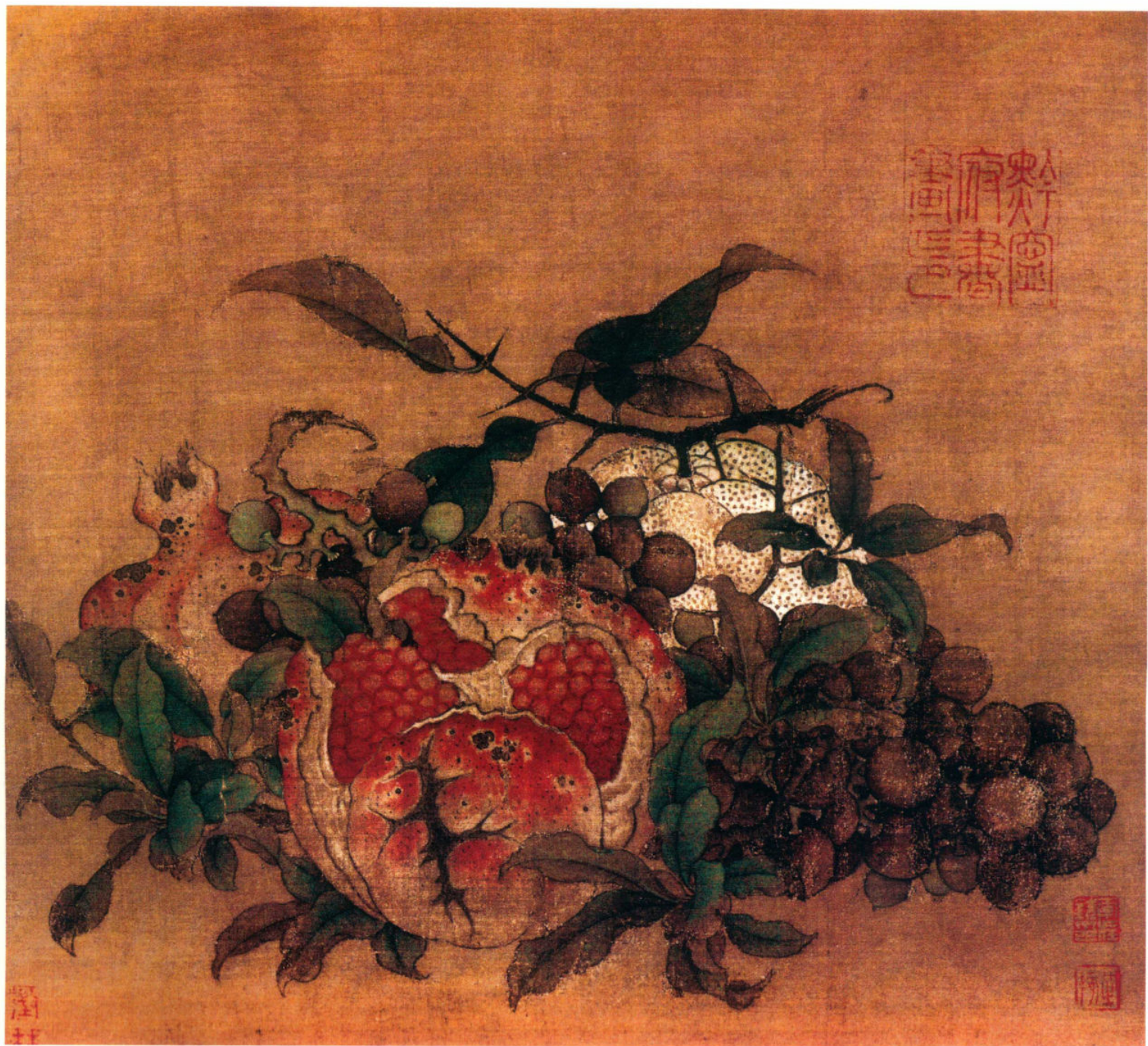
南宋 鲁宗贵 吉祥多子图 绢本设色