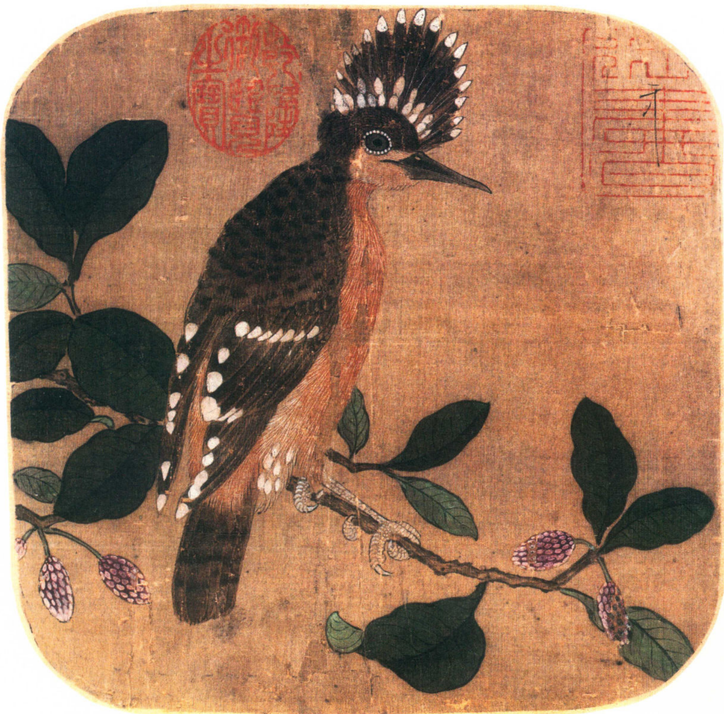
北宋 赵佶（传）戴胜图 绢本设色