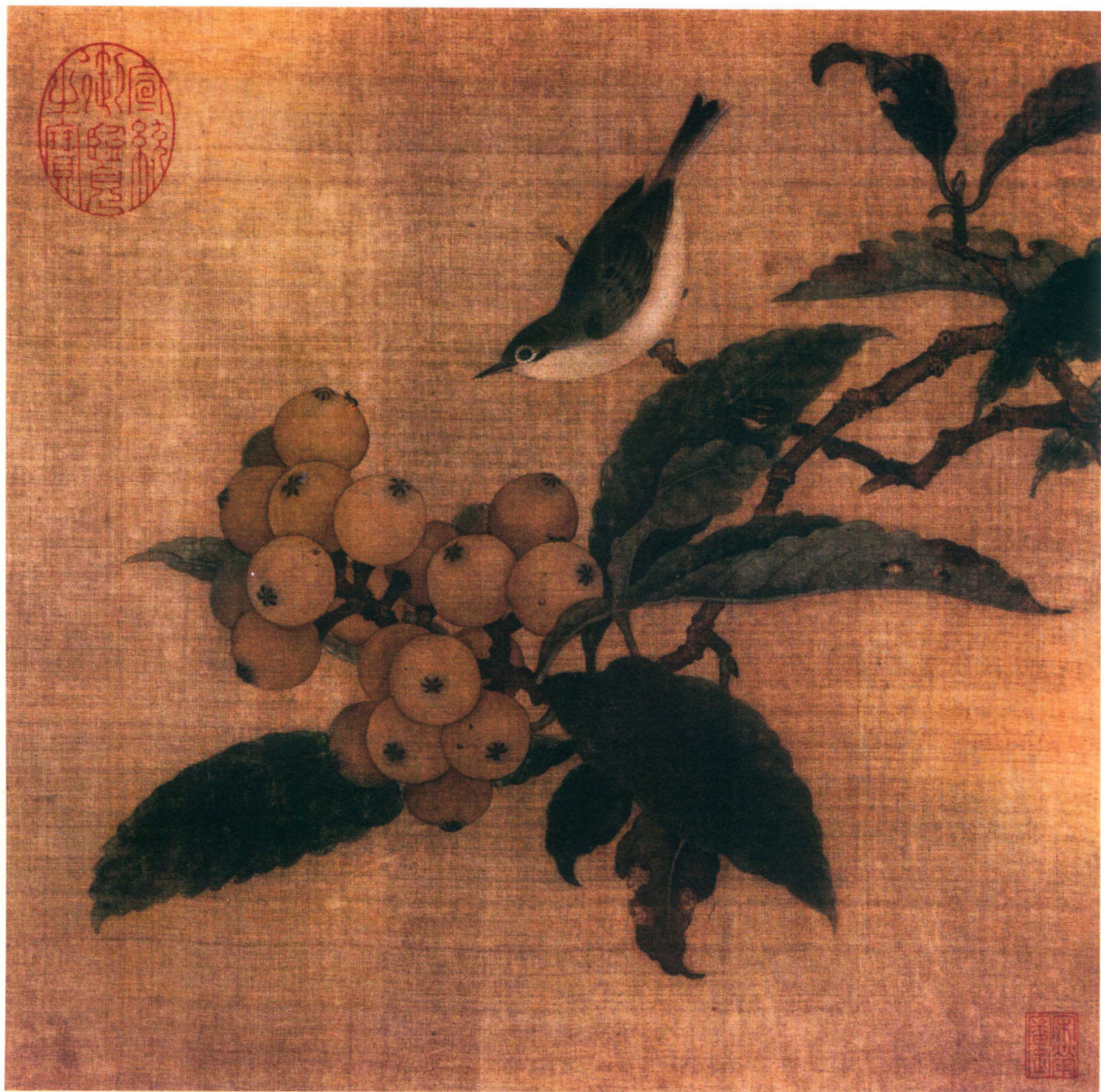
南宋 林椿 枇杷山鸟图 绢本设色