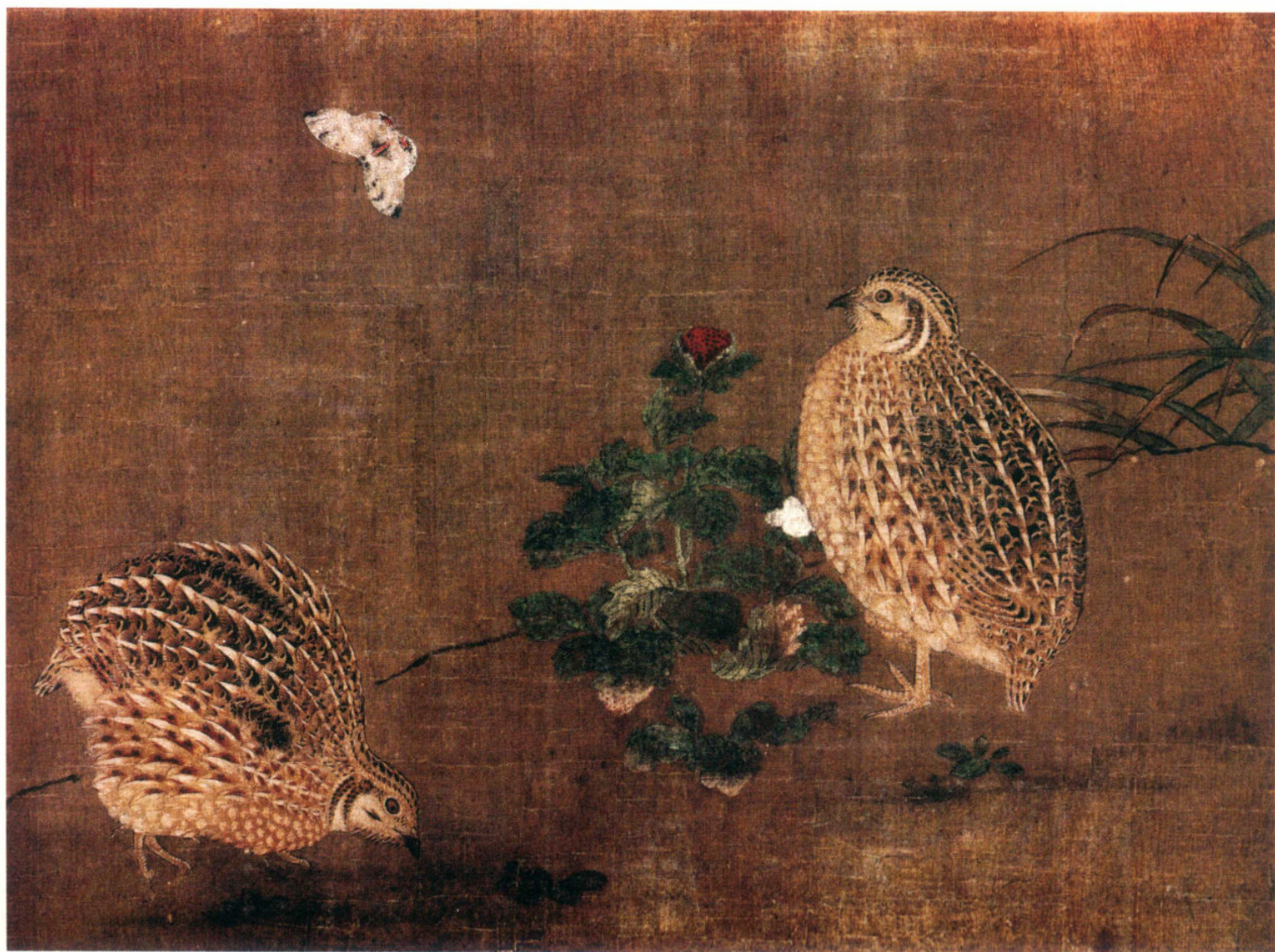
南宋 李安忠 鹌鹑图 绢本设色