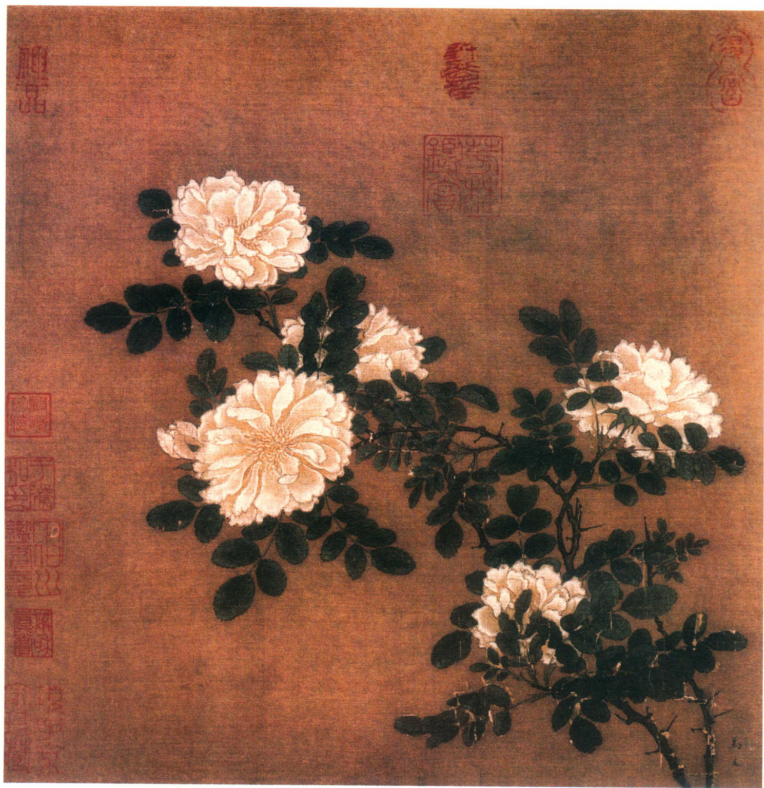
南宋 马远 白蔷薇图 绢本设色