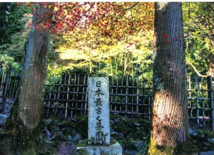
日本最古茶园，其茶籽来自中国