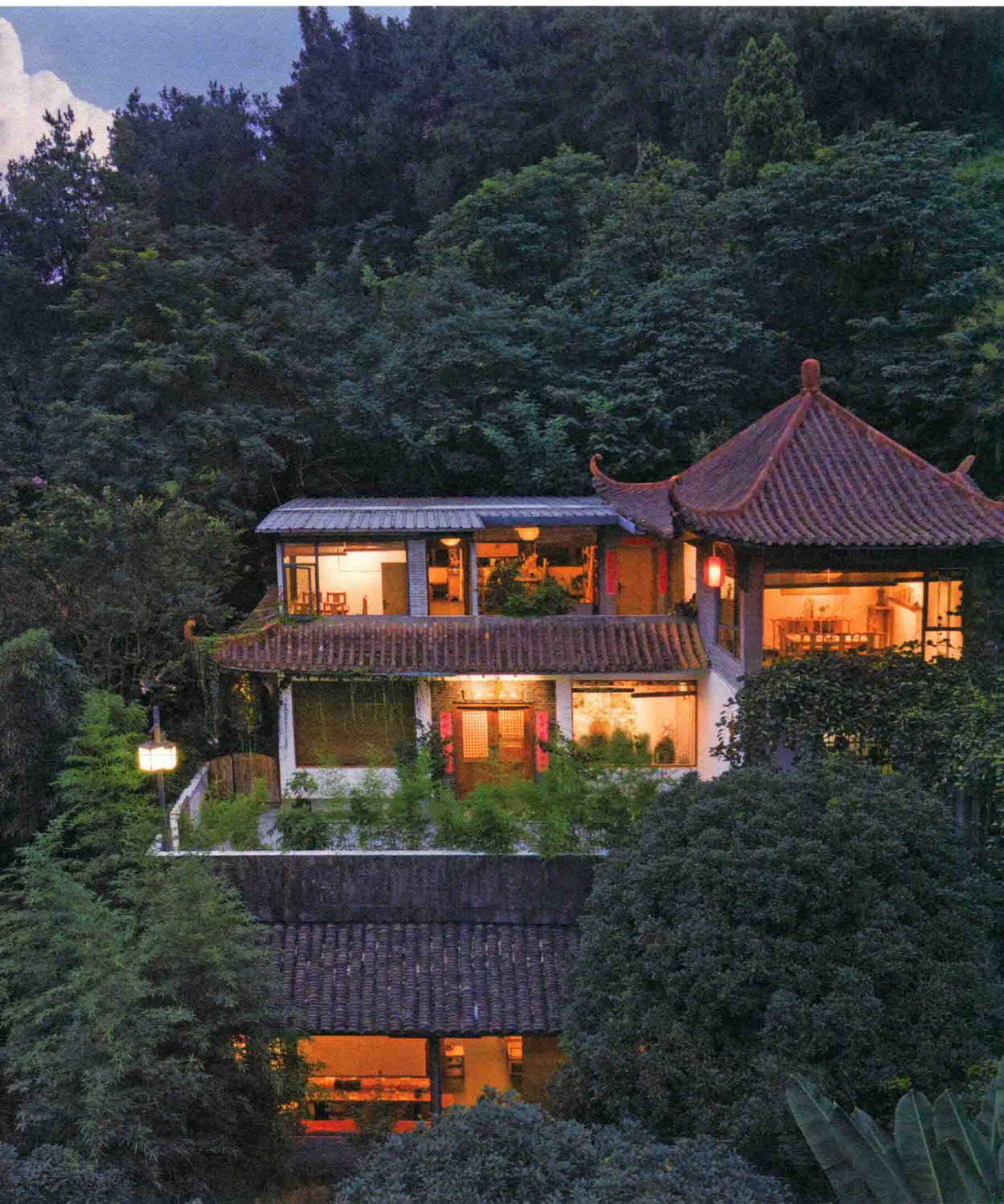
无名山房，隐于山林的茶空间