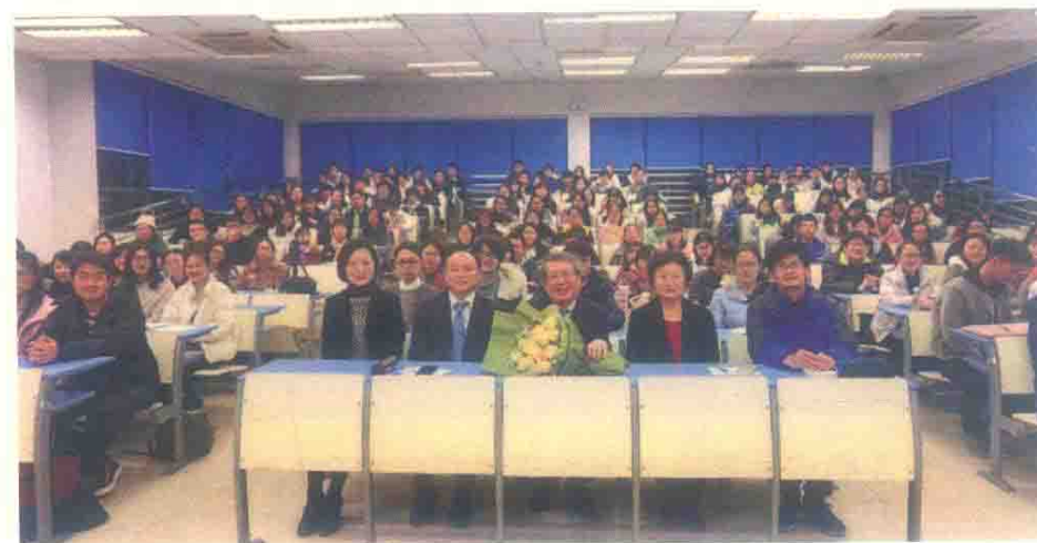
图5 讲座掠影：东京大学理事、常务副校长, 东华大学顾问教授羽田正教授(2017年12月26日)