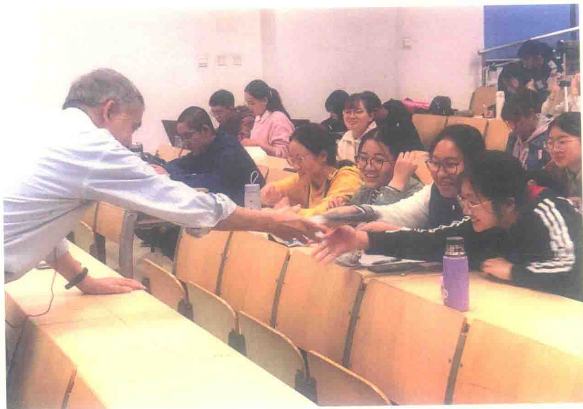
图9 讲座掠影：东华大学王依民教授（2019年11月9日）