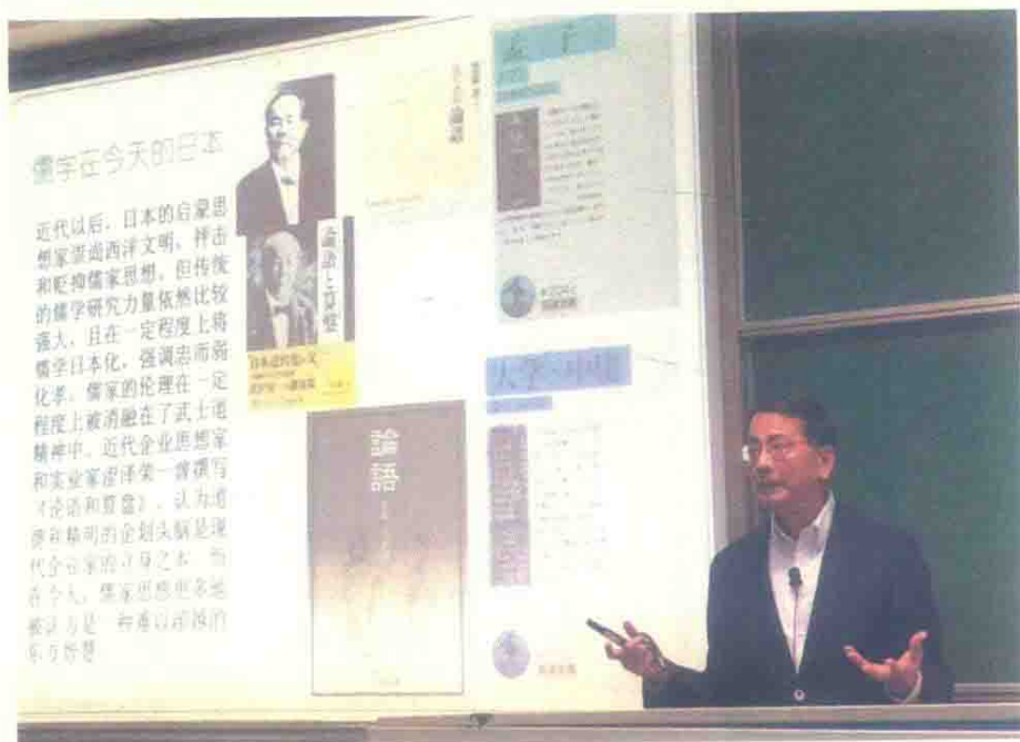
图16 讲座掠影：复旦大学徐静波教授(2017年10月1日)