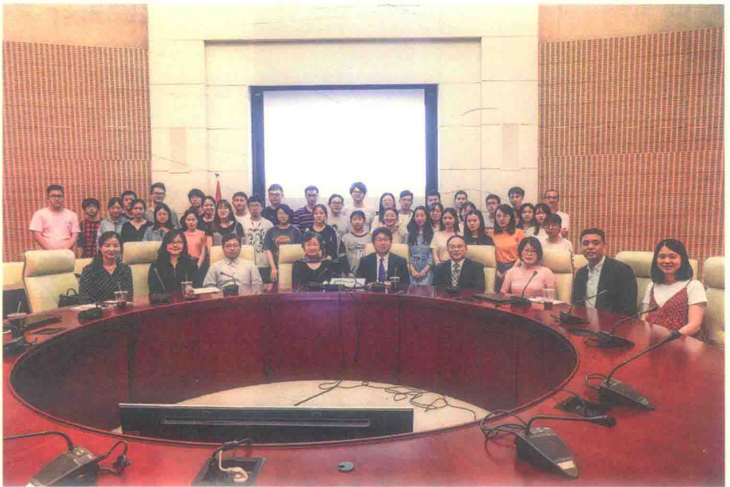
图 13 讲座掠影：东京大学川岛真教授（2019年6月3日）