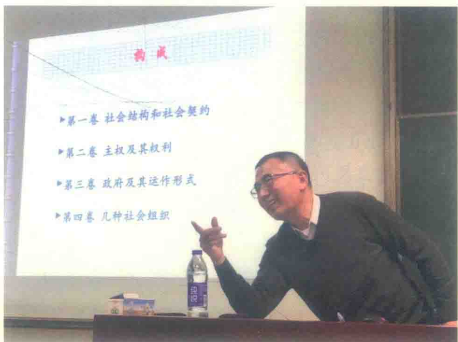
图18 讲座掠影：武汉大学 聂长顺教授(2018年 12月11日)