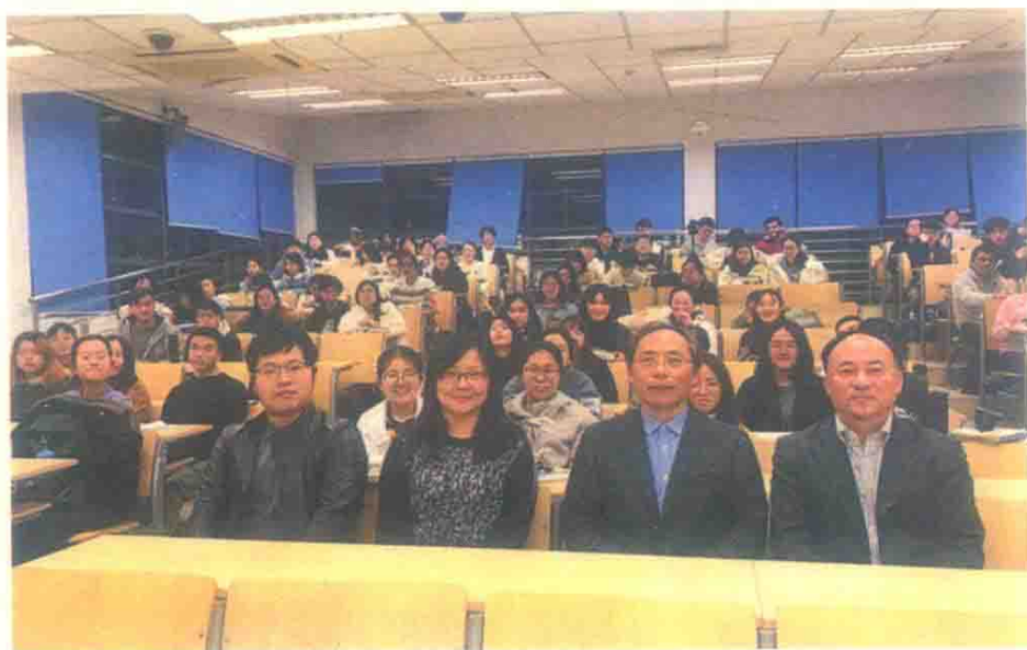
图22 讲座掠影：复旦大学李星明教授(2019年12月18日)