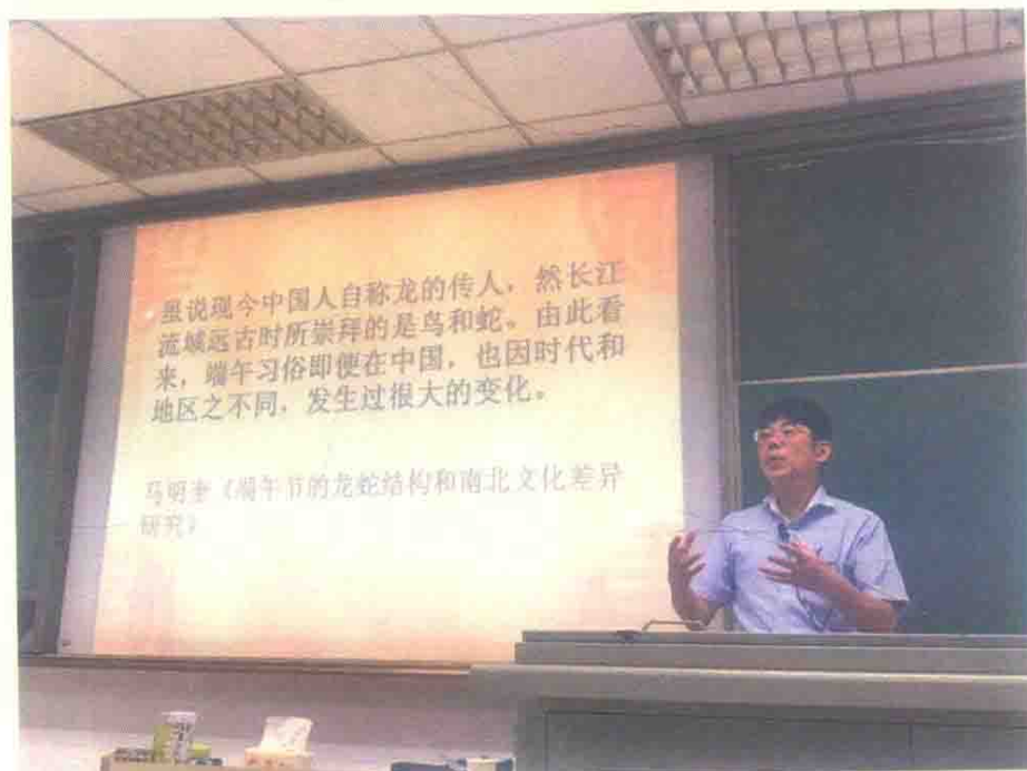
图15 讲座掠影：同济大学蔡敦达教授(2017年9月19日)