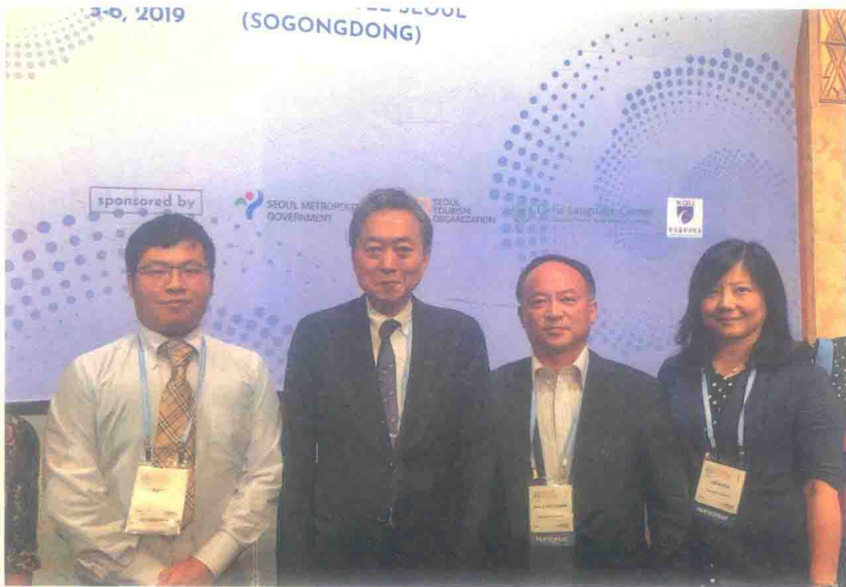
图1 东亚共同体研究所理事长、日本原首相鸠山由纪夫先生与课程组成员合影(2019年8月5日)