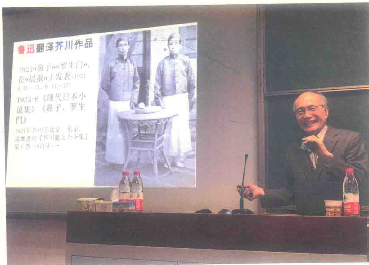
图10 讲座掠影：东京大学藤井省三教授（2018年11月6日）