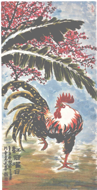
叶双璋 全国人大华侨委员会委员、福建省人大书报院院长、福建省人大常委会副主任 《红冠耀日》 国画 138cm×69cm