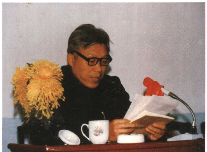
1986年10月21日，作者在全国江河水利志编写工作研讨会上发言