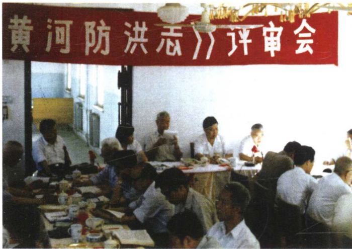
1990年6月，在河南三门峡市举行《黄河防洪志》评审会