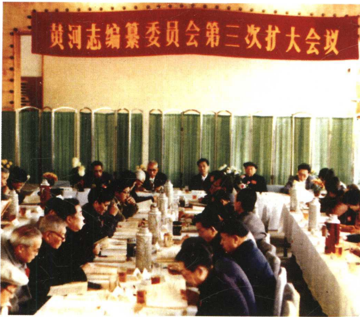
黄河志编委会第三次扩大会议 1988 年 11 月在陕西西安市举行