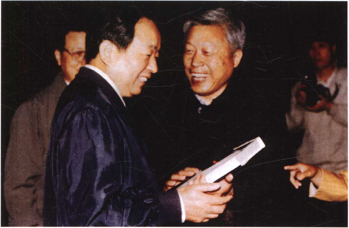
国务院原副总理田纪云（后任全国人大常委会副委员长）在郑州接见黄河志编纂及出版人员（1992年5月6日）