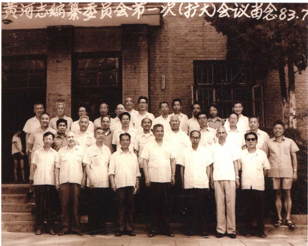
1983年7月5日，在郑州召开黄河志编委会第一次（扩大）会议