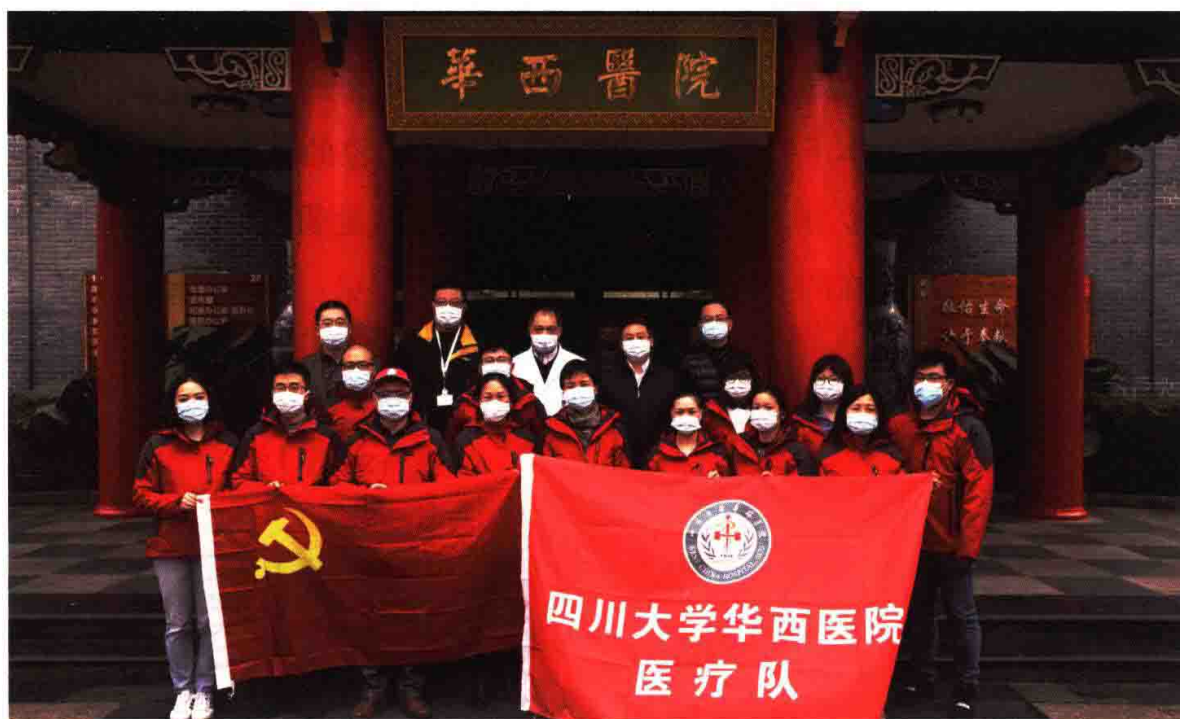
四川大学华西医院第二批援鄂医疗队