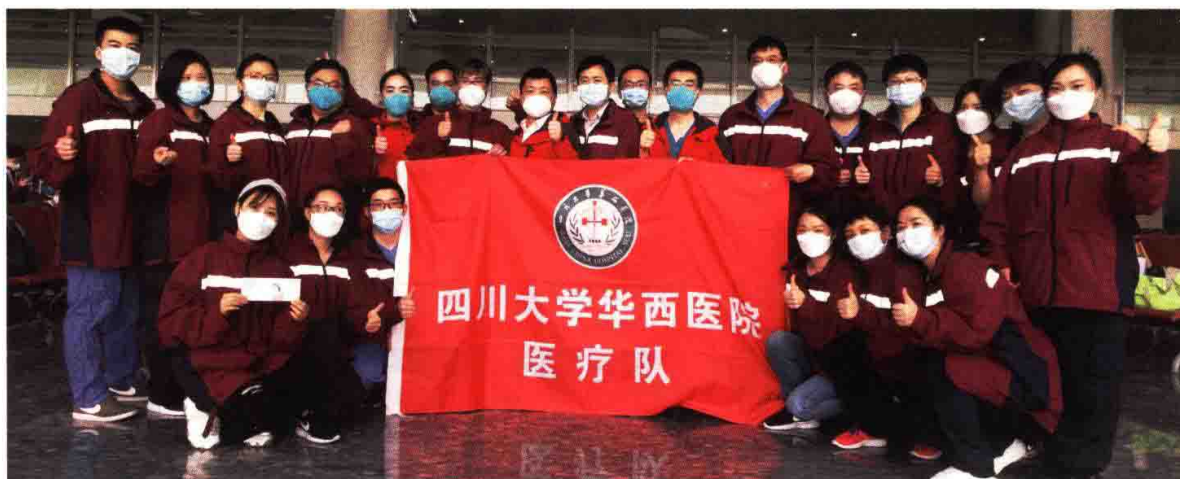
四川大学华西医院第一批援鄂医疗队