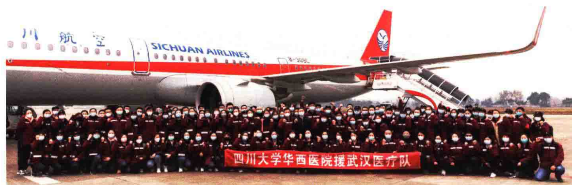
四川大学华西医院第三批援鄂医疗队