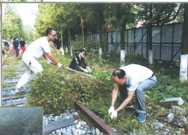
开展爱国卫生运动