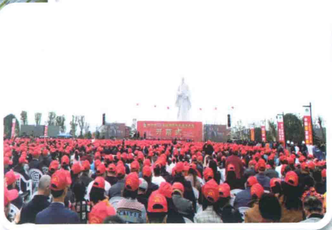
第50届全国药材药品交易会开幕式