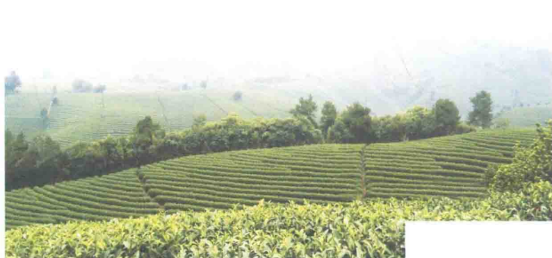
店下镇千亩白茶基地