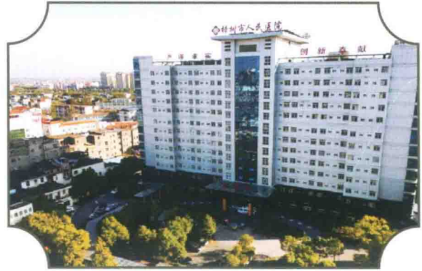
樟树市人民医院（住院部大楼）