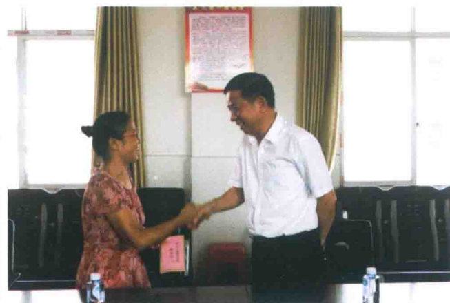
市委书记董晓明看望慰问 全国模范教师卢青萍