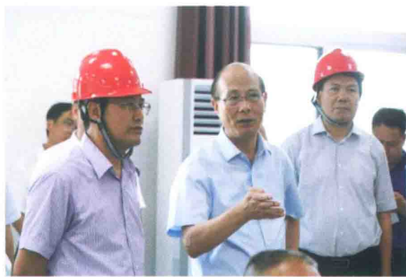
副省长吴晓军到樟树调研