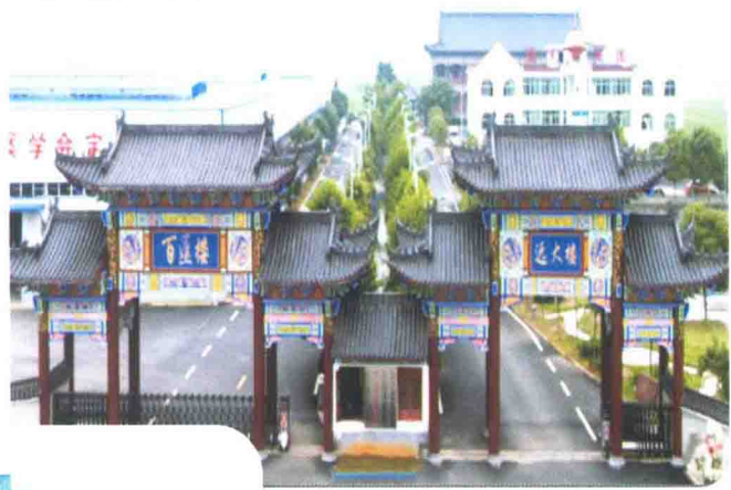
远大 保险 公司