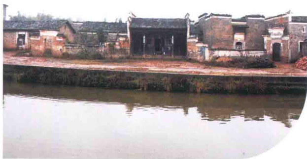
刘公庙镇塔前彭家古村