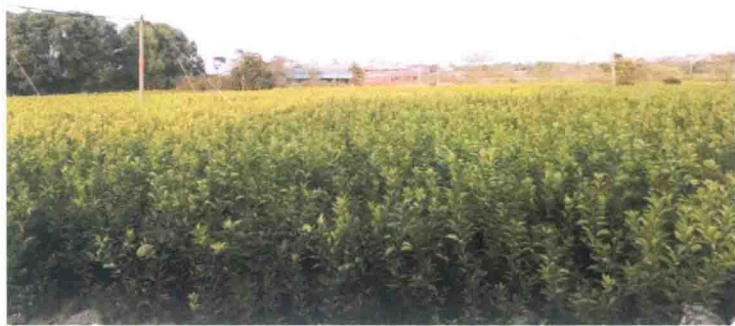
黄土岗镇谢家村枳壳苗基地