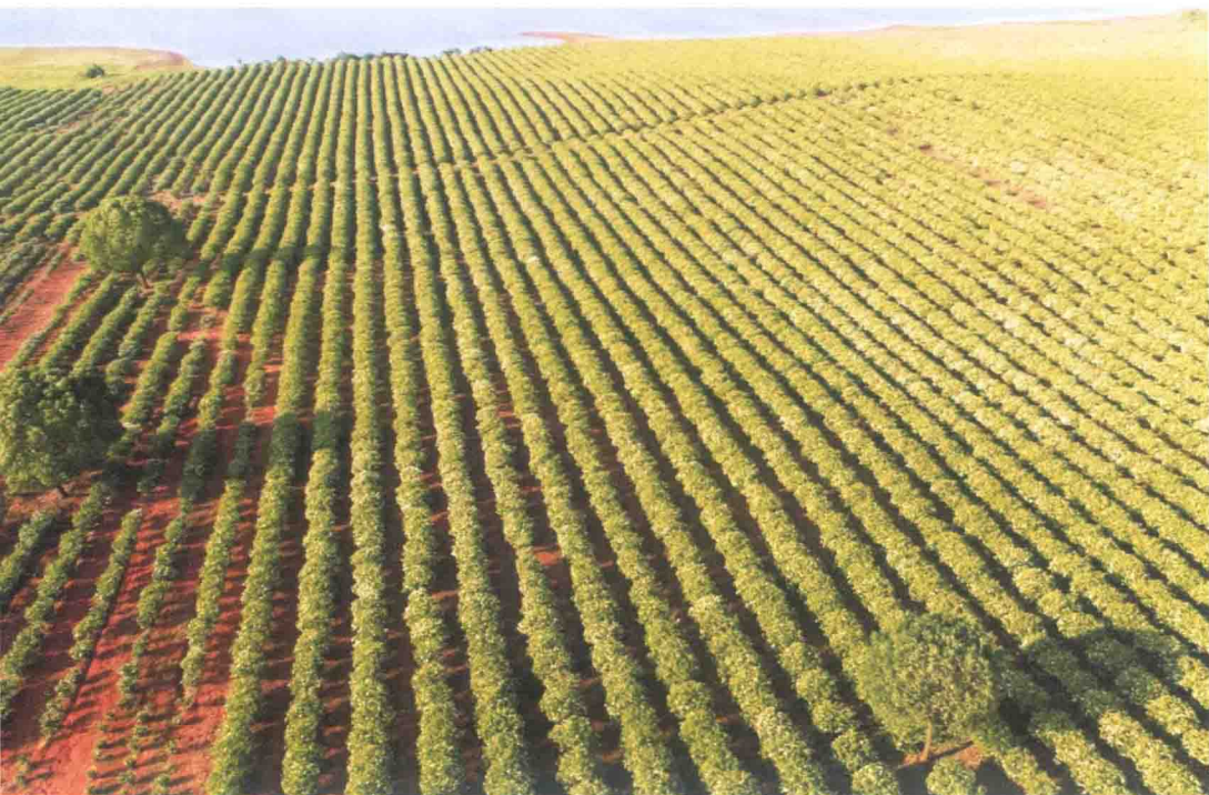
罗港千亩中药材种植基地