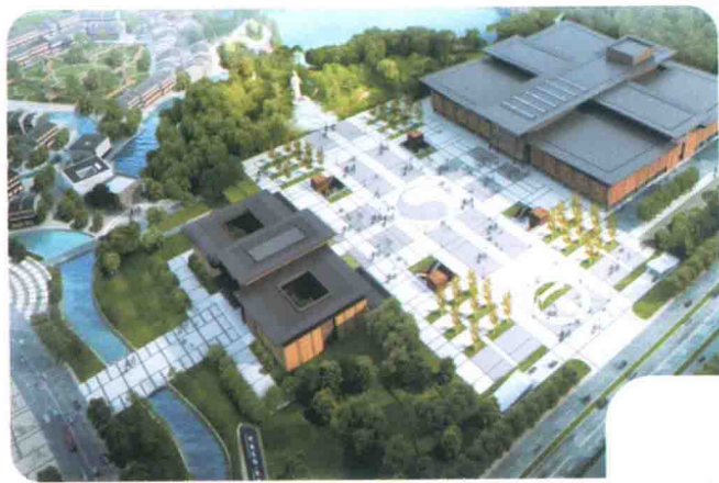
中国药都·岐黄小镇