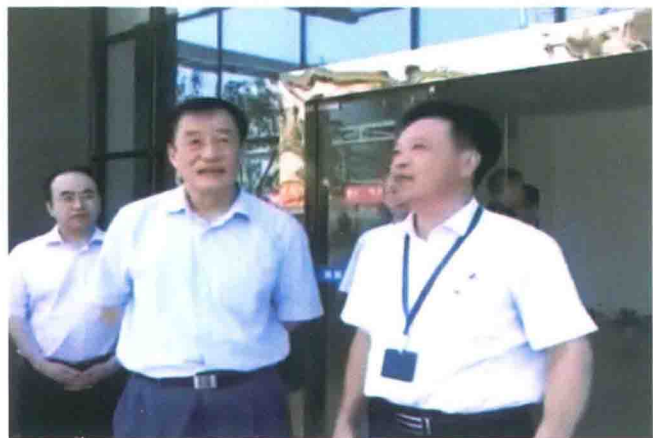
省委书记刘奇到樟树调研