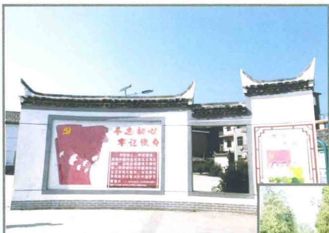
新时代文明实践广场