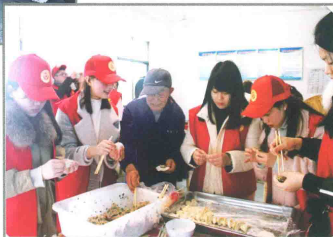
学雷锋、包饺子、送温暖