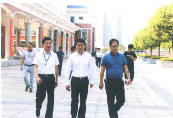
市委副书记、市长尹志 来到滨江中学调研