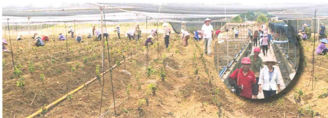
“农业两区”金丝皇菊种植