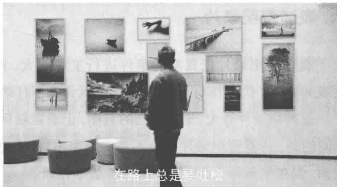
图1-3 学生作品《毕业季》截图

“在路上总是要吐槽，这么早上课都还没有睡醒，总是要在晚上的座谈会上，谈论明天要不要逃课。现在却最想上一次逃课最多的那位老师的课，然而这想法如今有些奢侈。”（如图1-3）