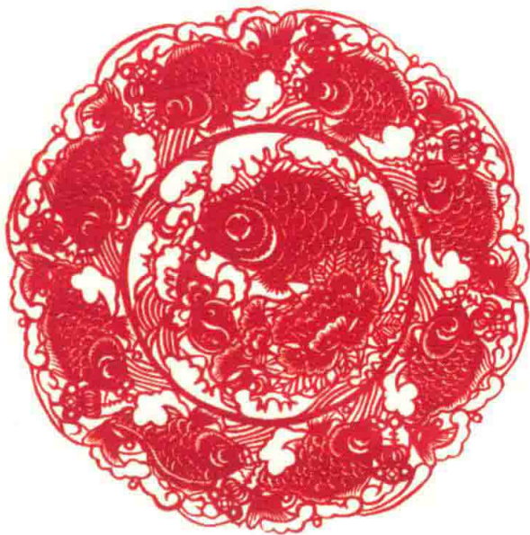
庄河剪纸·九鱼图 作者：韩月琴 韩月巧