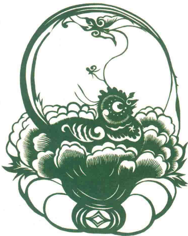
纯观赏性剪纸·迎春

纯观赏性剪纸是在窗花的基础上发展而来的，剪工精湛，风格高雅，形式完美。大连剪纸艺人充分调动剪纸的艺术语言，匠心独具，继承传统，大胆创新，创作和刻画生动形象，使剪纸极具观赏性和审美价值。纯观赏性剪纸经过装裱或装框可以成为室内装饰品或馈赠亲友的礼品，更是赠送国际友人的佳品。大连走出国门的剪纸大多是纯观赏性剪纸，深受赞赏和欢迎。纯观赏性剪纸虽然不承担窗花的民俗功能，但是其精湛的技艺与完美的形式又对窗花等实用性剪纸产生了重要影响，促进了窗花剪纸技艺的提高和内涵的丰富。