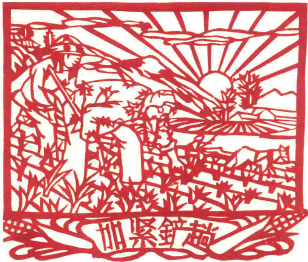
庄河农民剪纸（1958年） 庄河市文化馆资料

这一点儿也不奇怪。在庄河，几乎家家户户都有会剪纸的妇女，剪刀和纸张是人们自娱自乐和点缀生活的工具。在庄河，民间的剪纸比赛和民俗活