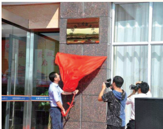
9月3日，永新县政务服务中心举行启动仪式，县委书记肖兵为政务服务中心揭牌