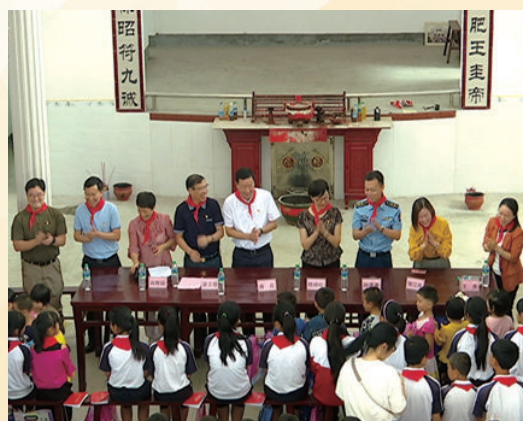
6月1日，在高桥楼镇茅坪村开展庆“六一”关爱留守儿童暨“红色家书”经典诵读进校园活动