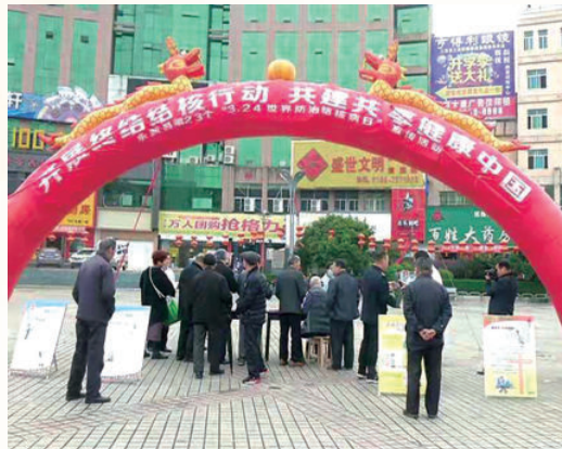
3月24日，开展主题为“开展终结核行动，共建共享健康中国”的宣传活动