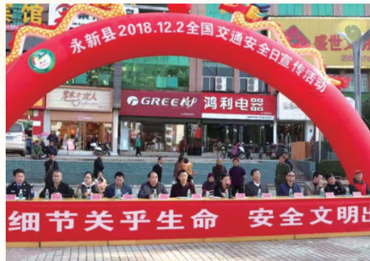
12月2日，开展全国交通安全日宣传活动