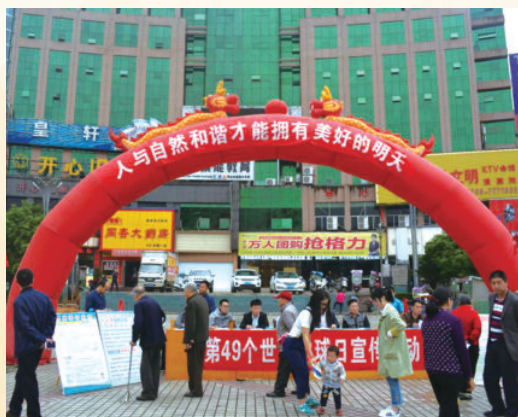
4月22日，开展世界地球日宣传活动