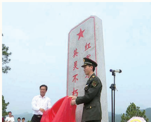
4月4日，在中乡斜坡村龙背岭举行在中乡斜坡村红军烈士纪念碑落成仪式