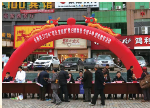
12月4日，开展永新县2018年“宪法宣传周”暨扫黑除恶专项斗争专项斗争宣传教育活动