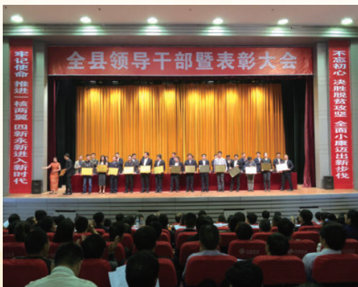
3月31日，在县文化艺术中心召开全县表彰大会