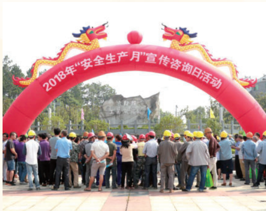
6月15日，开展2018年“安全生产月”宣传咨询日活动