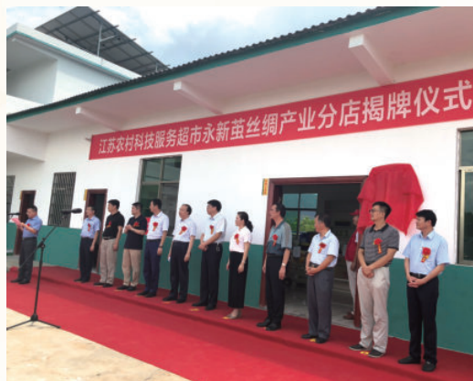
8月6日，江苏省科技厅赴永新县举行茧丝绸产业分店揭牌仪式