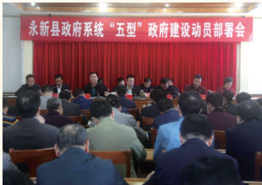
10月29日，永新县政府召开政府系统“五型”政府建设动员部署会