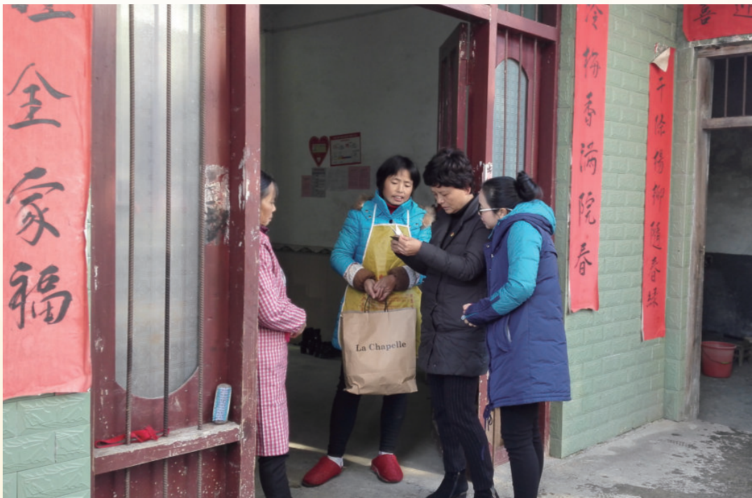
12月18日，县政协主席曾志华在龙源口镇指导脱贫攻坚工作