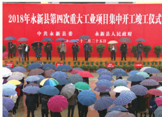
12月25日，举行2018年永新县第四次重大工业项目集中开工仪式