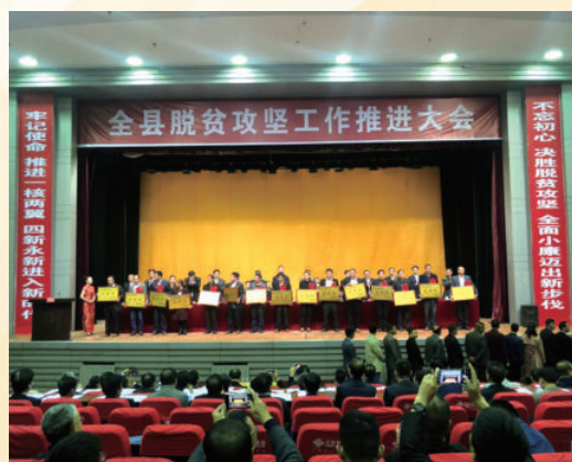
10月20日，全县脱贫攻坚工作推进大会