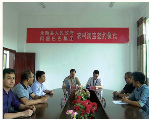
5月7日，在县商务局会议室举行永新县人民政府与阿里巴巴集团农村淘宝签约仪式