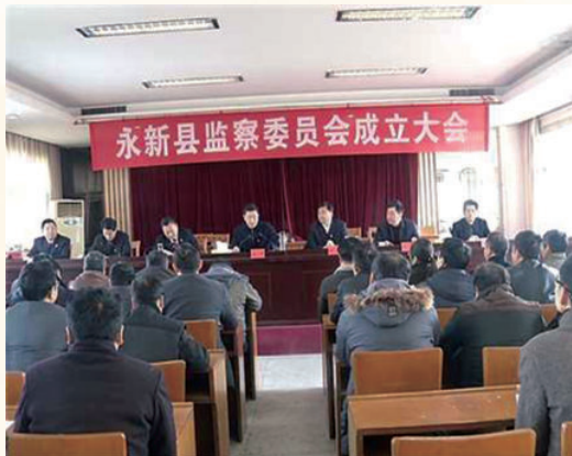
2月3日，召开监察委员会挂牌成立大会