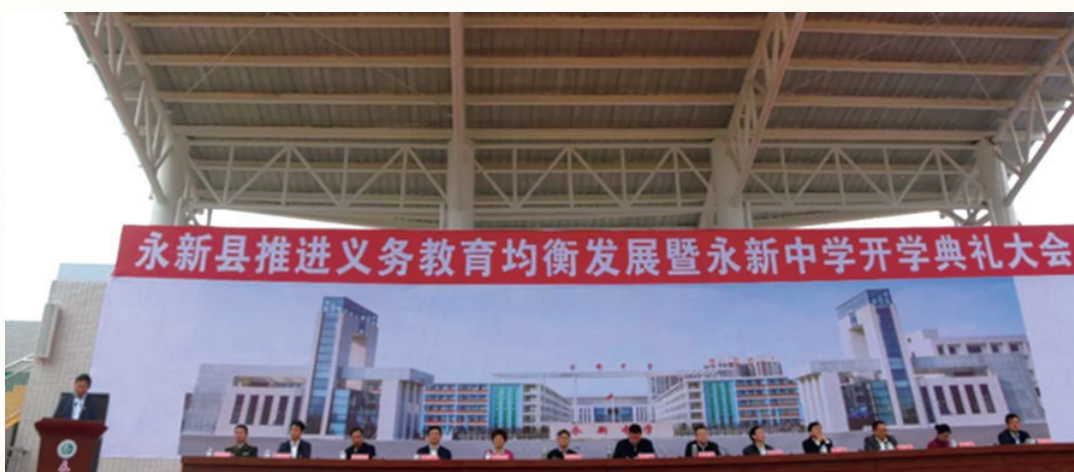
10月19日，永新中学开学典礼