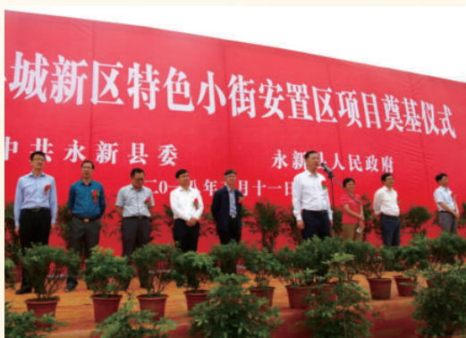
5月11日，举行县城新区特色小街安置项目开工奠基仪式