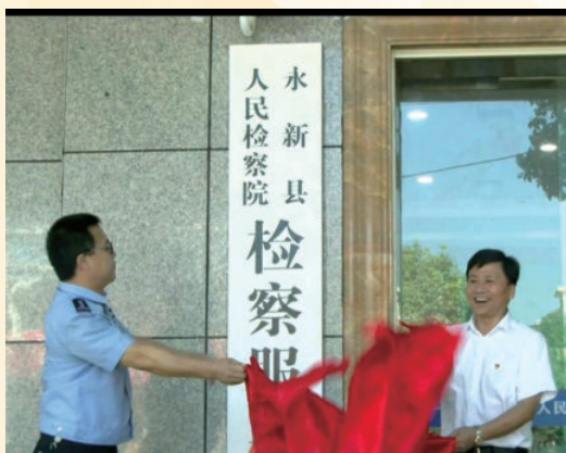
8月7日，永新县人民检察院检察服务大厅揭牌仪式