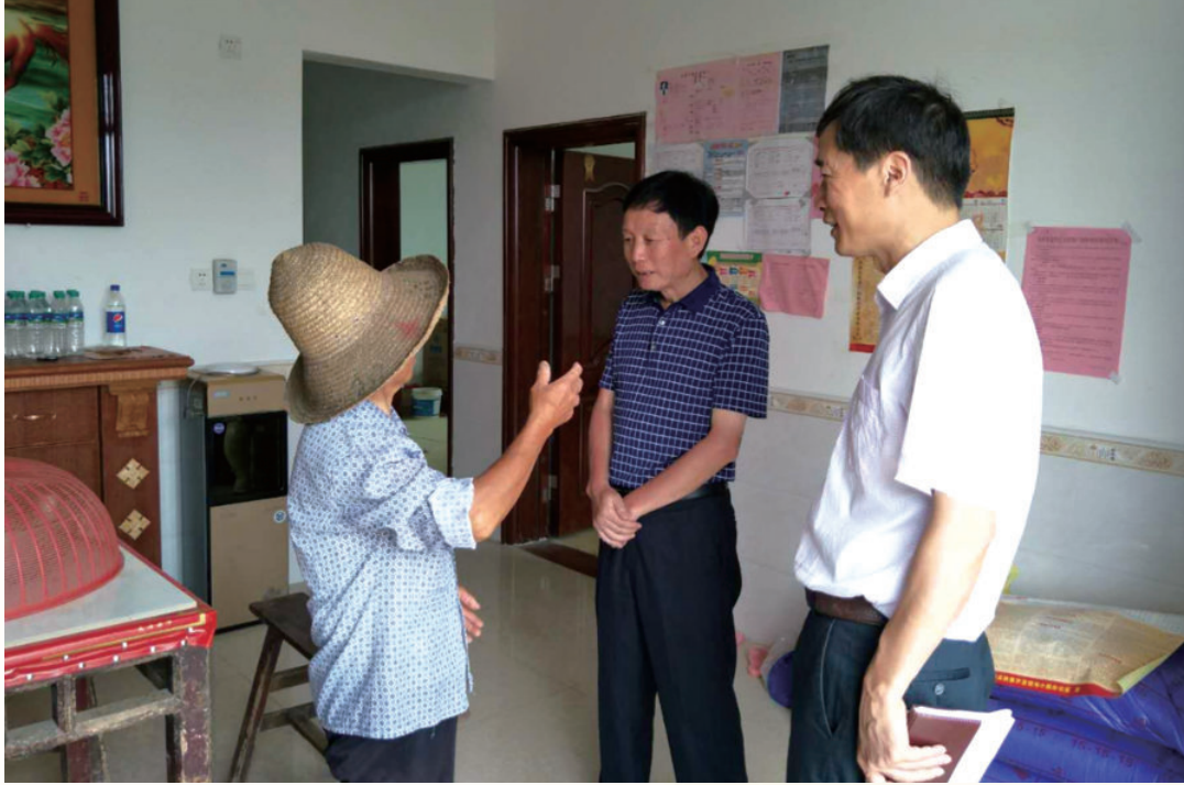
8月15日，市人大常委会主任尹毅斌同志走访慰问贫困户