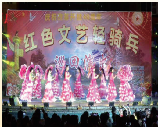
8月，举行庆祝改革开放40周年文艺晚会