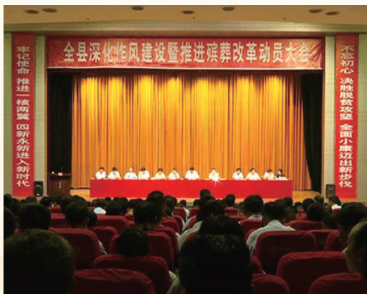
7月25日，在文化艺术中心召开了全县深化作风建设暨推进殡葬改革动员大会