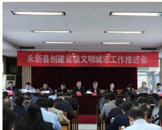
10月15日，召开永新县创建省级文明城市工作推进会