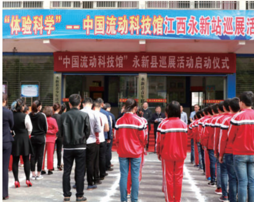
4月26日，举行“中国流动科技馆”永新县巡展活动启动仪式