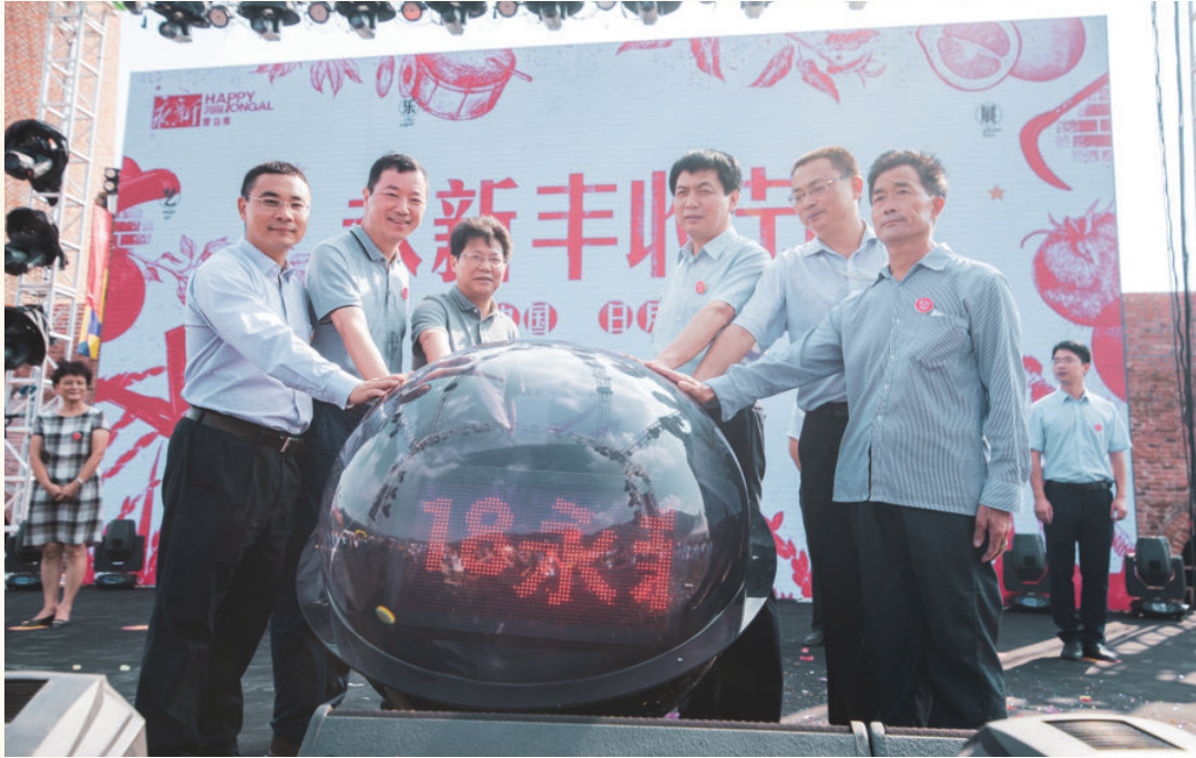
9月15日，县委书记肖兵出席永新首届丰收节开幕式