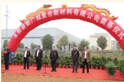
10月18日，举行第三次重大工业项目集中开工竣工仪式