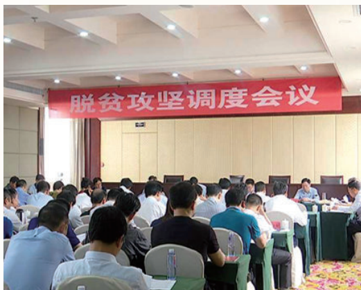
5月6日，全县脱贫攻坚调度会召开