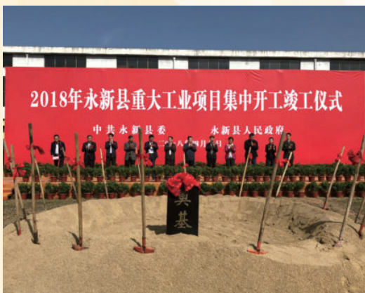
4月9日，永新县重大工业项目集中开工竣工仪式