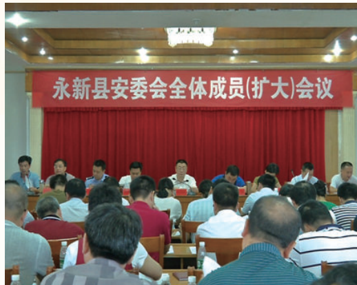
7月16日，召开全县安全委员会全体委员(扩大)会