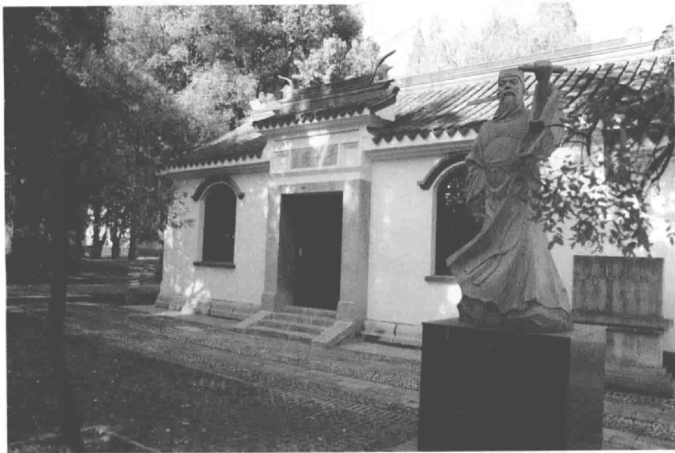
半山园门前王安石像