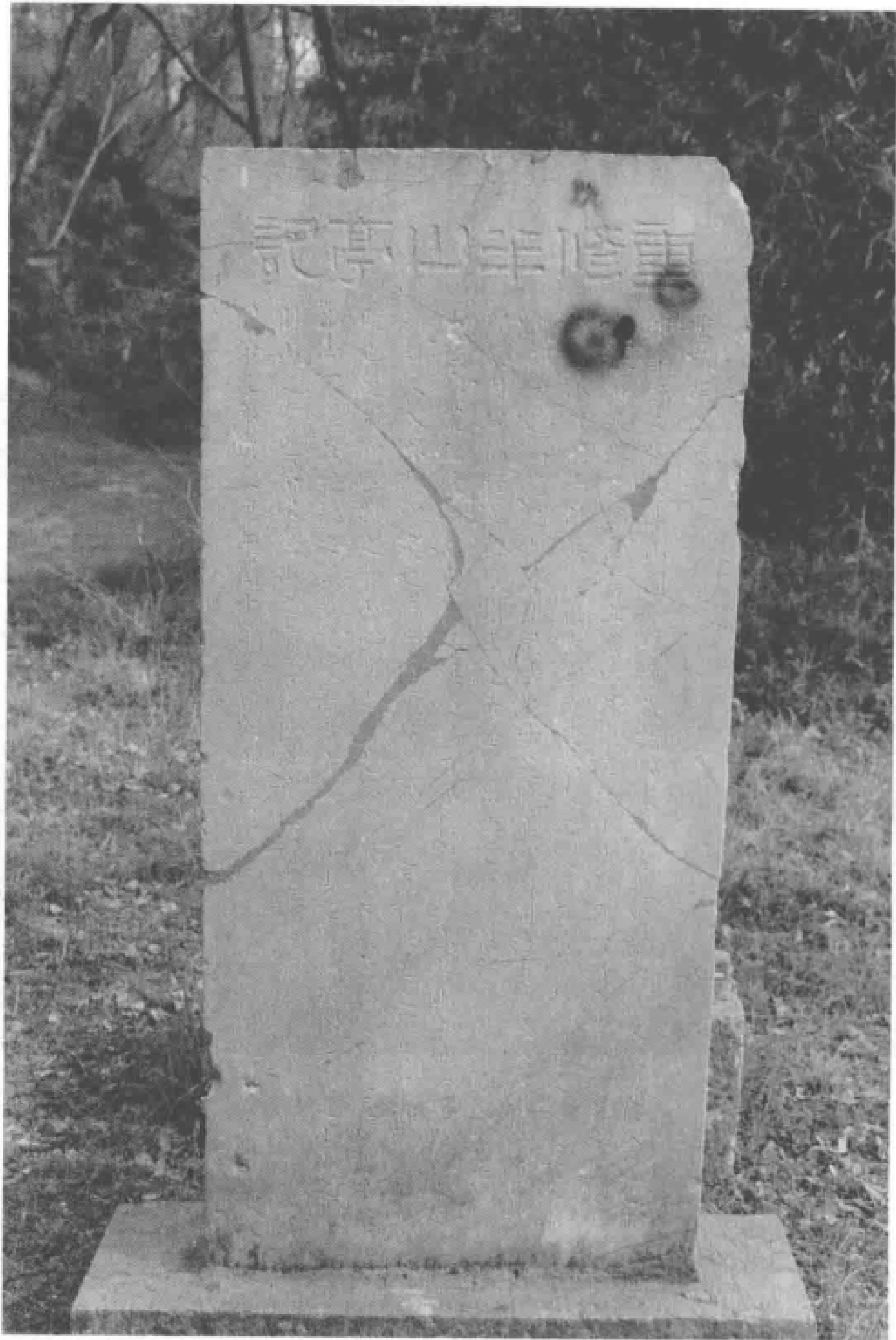
清同治九年(1870)《重修半山亭记》碑