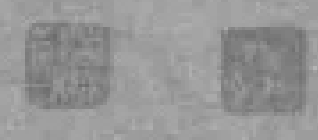
[清]樊沂《金陵五景图卷·钟阜晴云》，上海博物馆藏