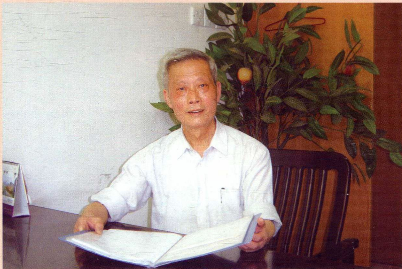
▲ 中医临床基础学科学术研讨（三）