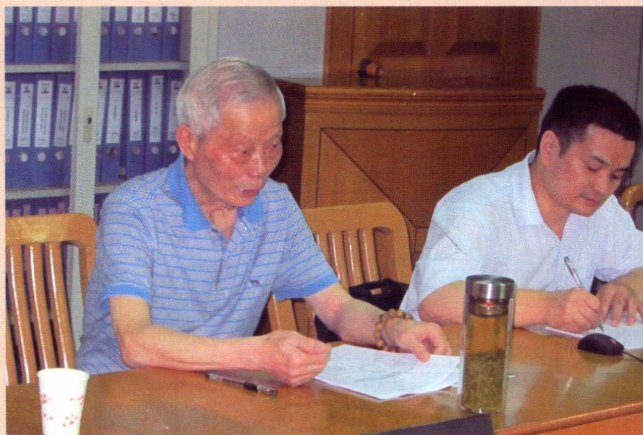
▲ 中医临床基础学科学术研讨（四）