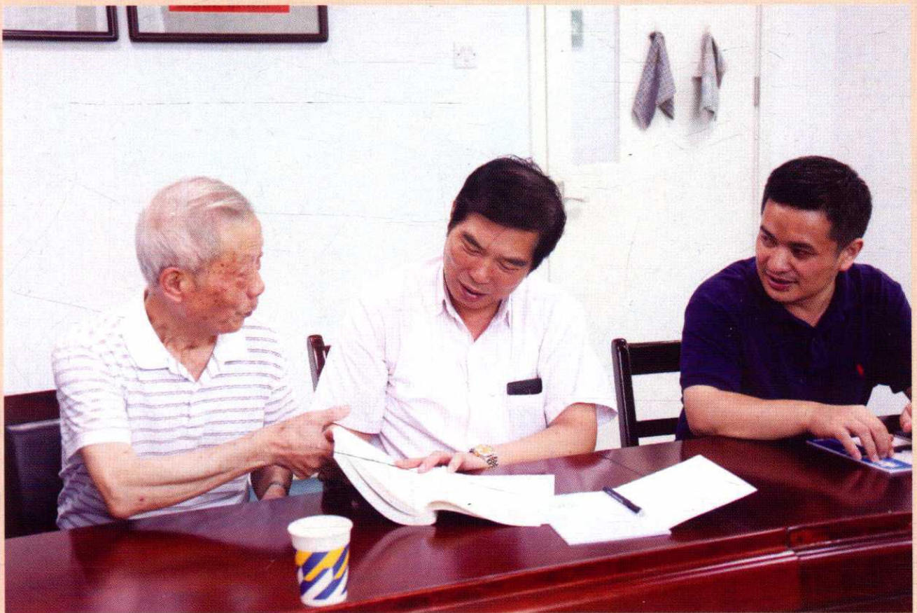
▲ 中医临床基础学科学术研讨（二）