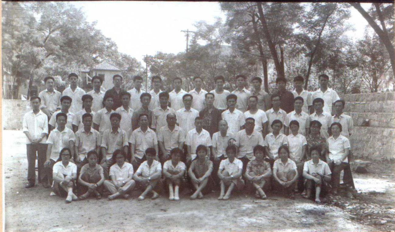
▲ 參加第二期全國傷寒師資班結業合影（1980年7月，二排左二）