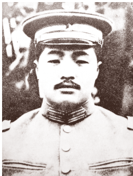
担任国民革命军20军军长时期的贺龙

如今，在贺龙指挥部旧址的一面墙上，展示着贺龙在南昌起义前夕说过的一段话：“只有跟着共产党，中国革命才有希望，共产党是人民的救星。”这段话正是贺龙一心想要加入共产党的真实原因，而那一纸薄薄的党员登记表则承载着他一路向党、一心向党的坚实信仰。