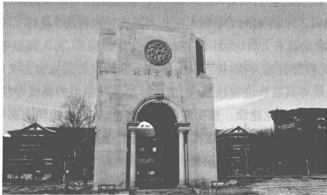
图 1-2 北洋大学堂

中国大学的起源是北洋大学堂,如图1-2所示。当年中国在甲午海战中惨败日本后,变法之声顿起,天津中西学堂改办为北洋大学堂,标志着中国近代第一所大学诞生。1898年戊戌变法后,京师大学堂成立,这是中国近代的第一所公立大学和综合性大学。图1-3所示为我国第一张大学毕业证。