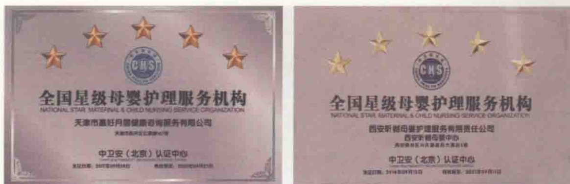
图 1-7 月子中心获得的服务认证证书（需注意证书有效期）