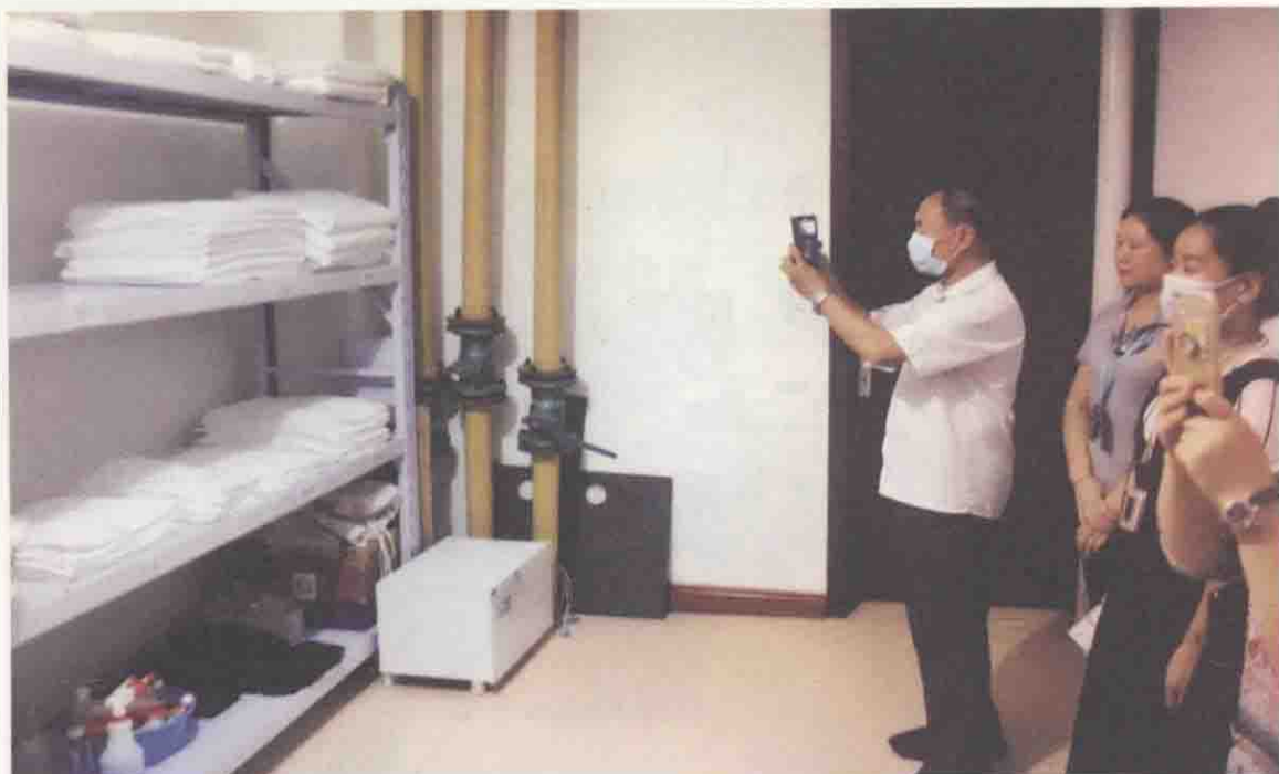
图 1-6 审查员在进行服务认证现场检查