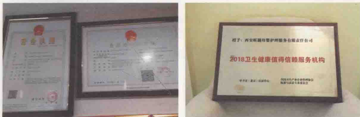
图 1-3 月子中心执有的营业执照及相关证书（认证现场取证照片）

国务院办公厅《关于促进 3 岁以下婴幼儿照护服务发展的指导意见》（国办发〔2019〕15 号）规定：“举办营利性婴幼儿照护服务机构的，在婴幼儿照护服务机构所在地的县级以上市场监管部门注册登记。婴幼儿照护服务机构经核准登记后，应当及时向当地卫生健康部门备案。”