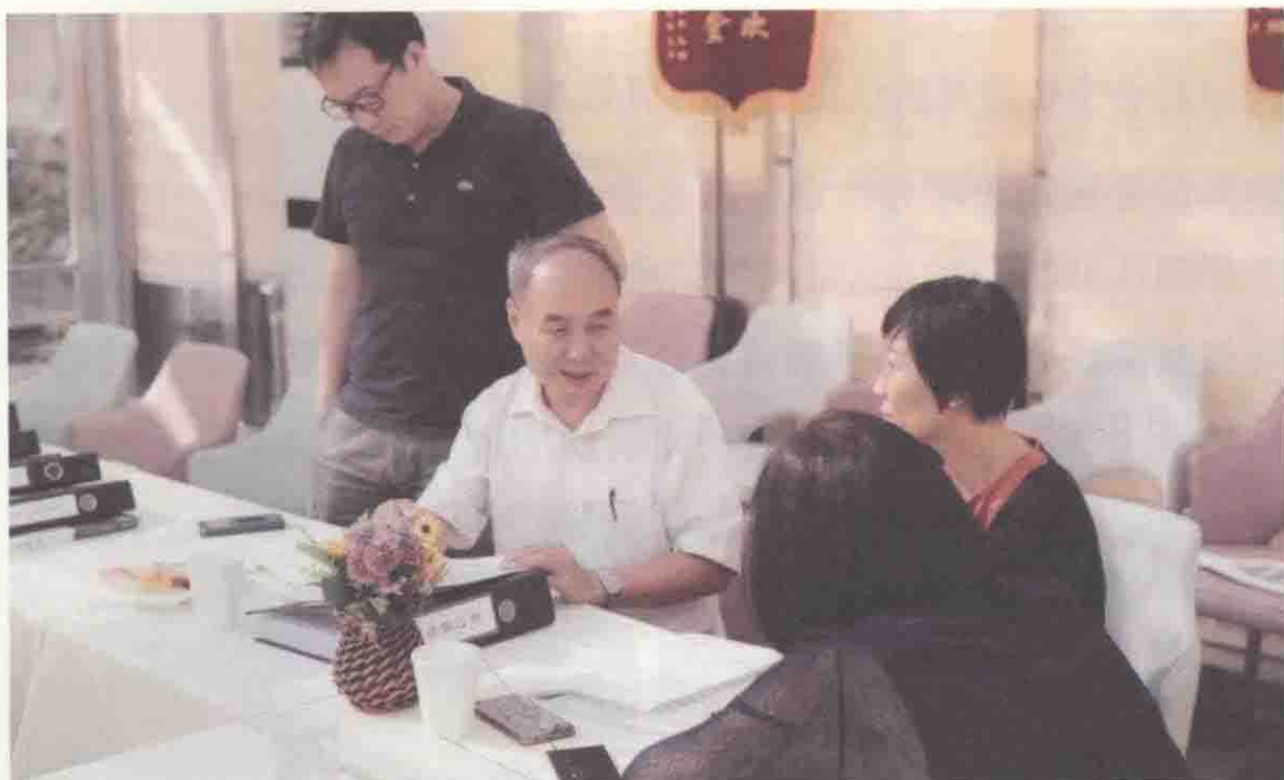
图 1-5 审查员在进行服务认证现场检查（交流检查情况）