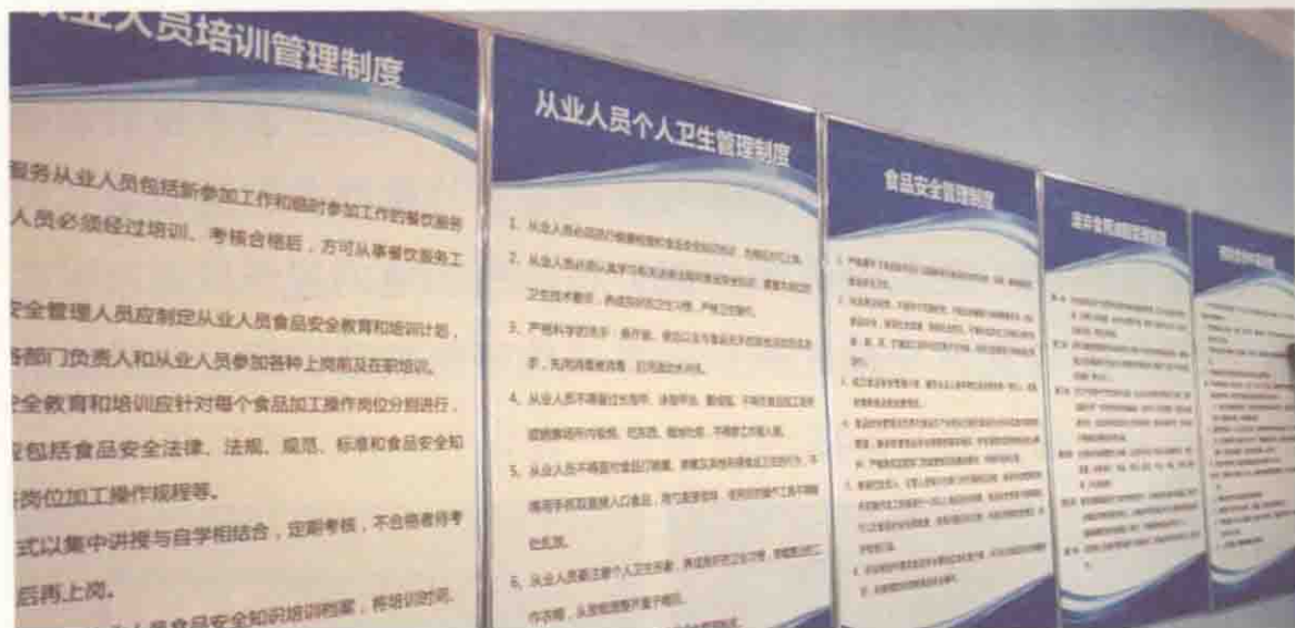
图 1-2 月子中心管理制度实例（认证现场取证照片）