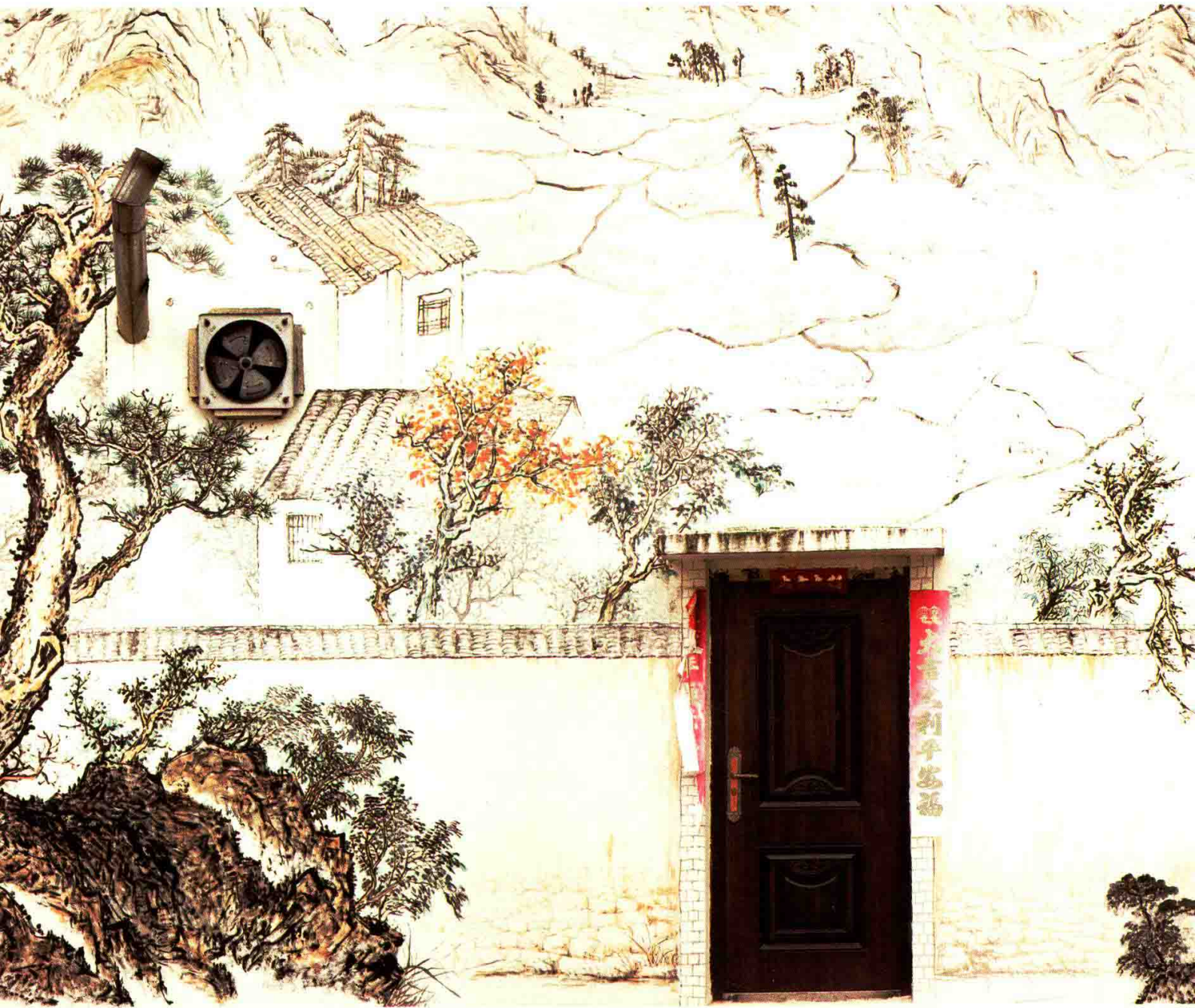
郑忠民《中国山水》（2015）选一