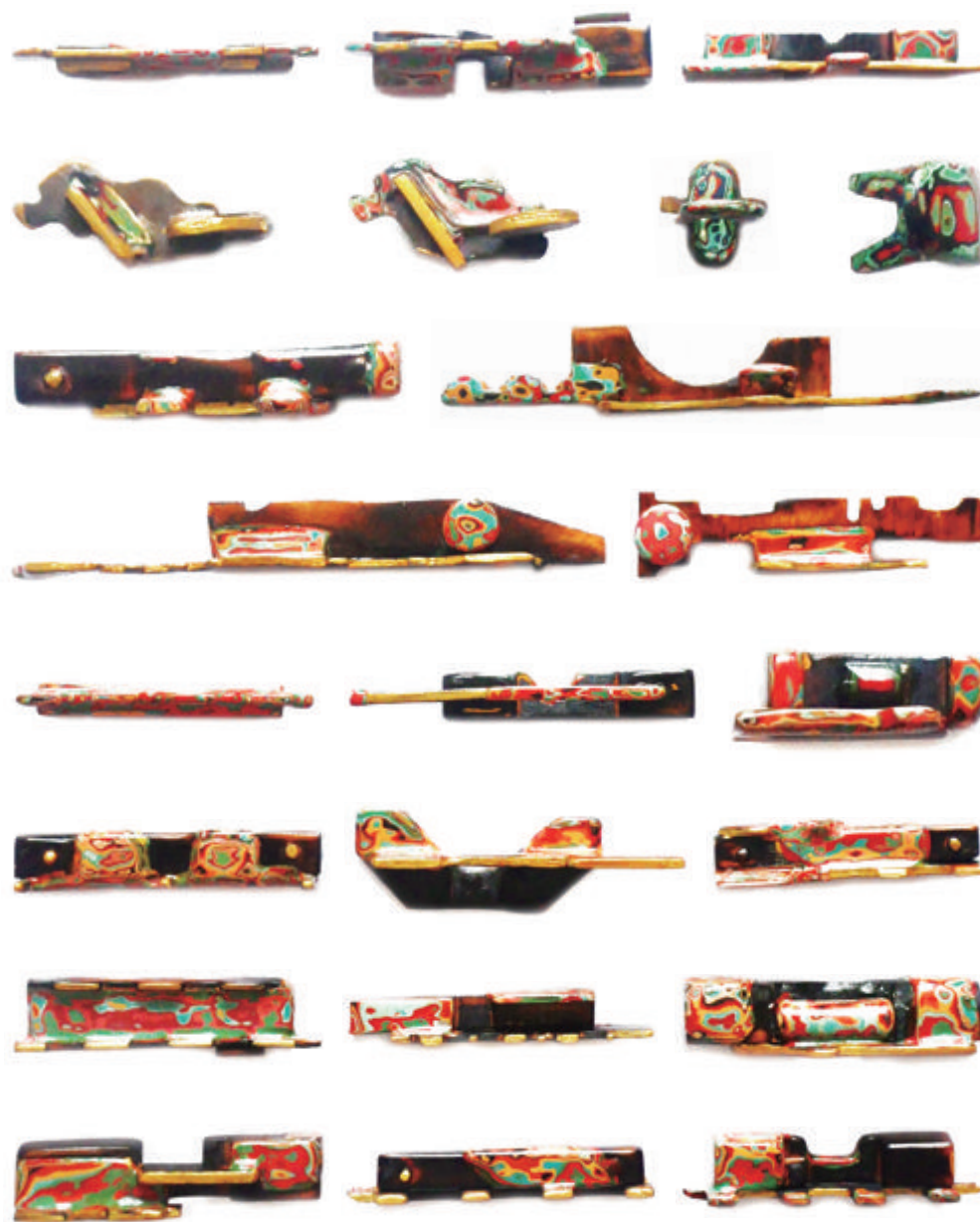
《手工密码——木工工具6》 何艳