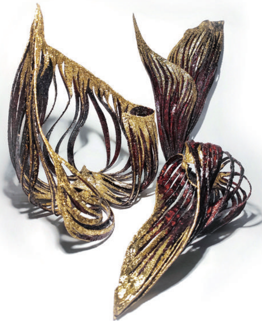
《燎》 邓宝妍 无纺布、漆、铜箔 尺寸可变 2019年