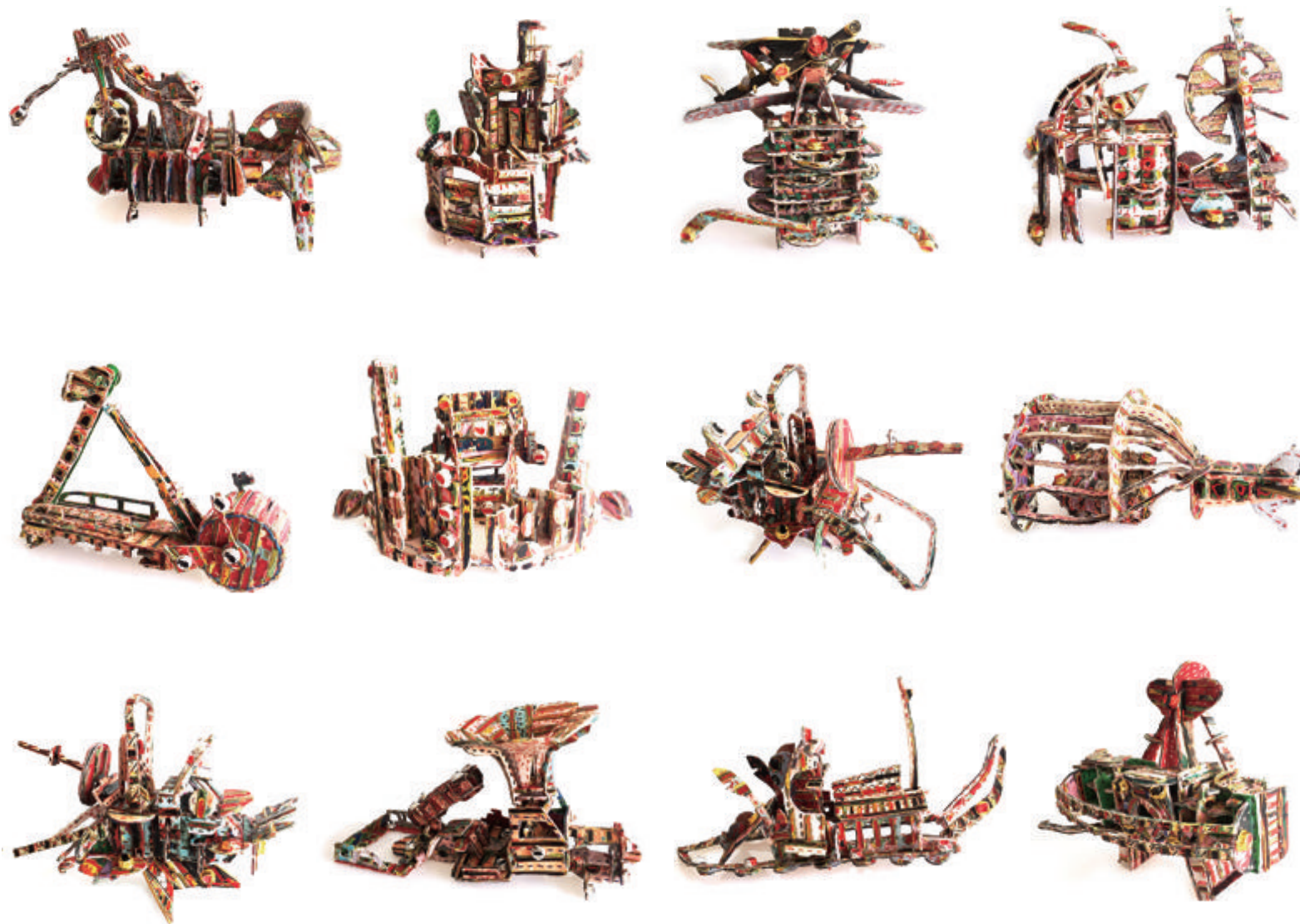
《漆与布的微型装置——工业系列》 何艳 花布、棉线、木块、锡箔纸、漆等 30cm × 30cm × 30cm/件 2017年