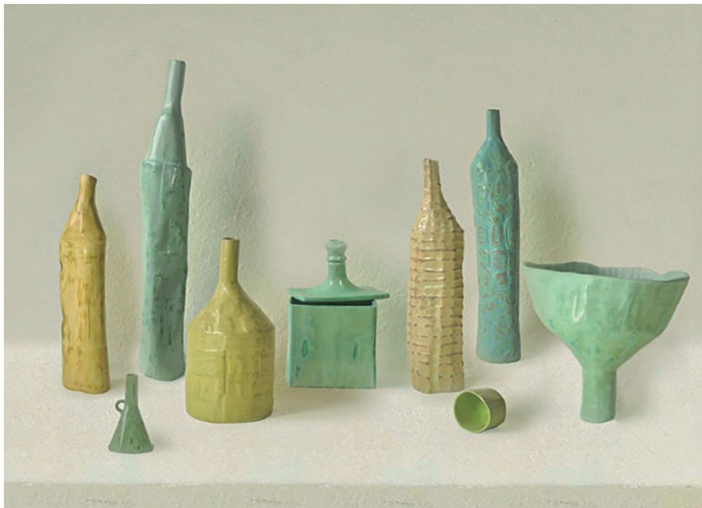
《莫兰迪的漆物》 张媛媛 大漆、麻布、瓦灰 尺寸可变 2019年