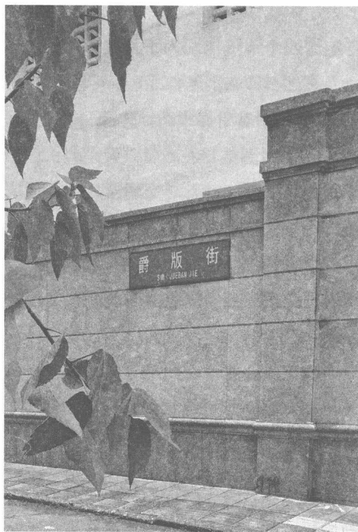
成都爵版街路牌，余星霖摄于2021年