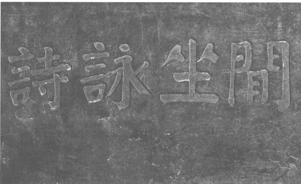
“闲坐咏诗”石刻

国危时议益纷哗，孤负城南二月花。 喜得旧游共尊酒，恰逢山寺寄新茶 1 。 蹲鸱慰我无饥岁，梁燕嗔人又别家。 等是乱离怀抱尽，可堪白首论京华。