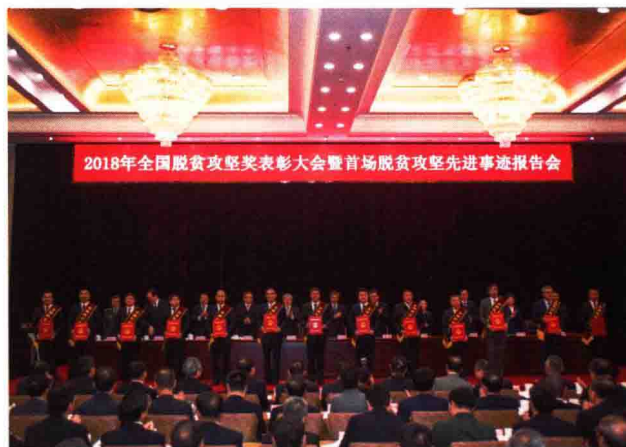
兰考县参加全国脱贫攻坚表彰大会