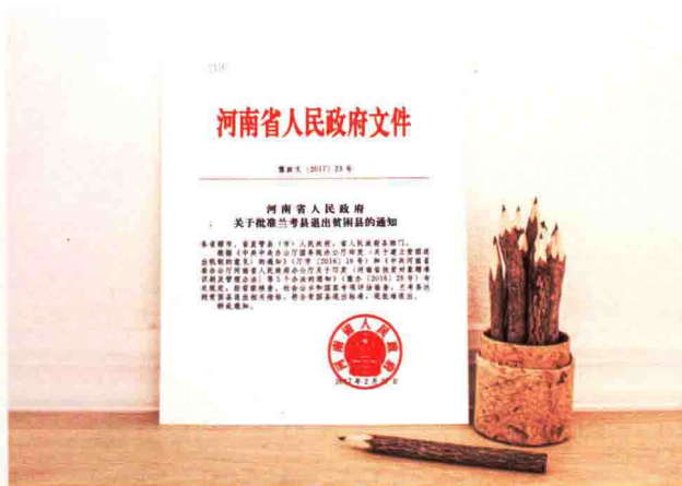
河南省政府批准兰考退出贫困县的通知