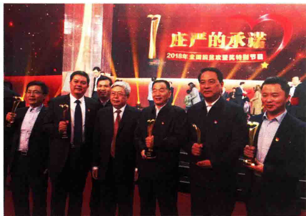
兰考县获得脱贫攻坚组织创新奖