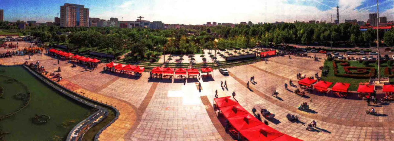
人民广场举办第一届丰收节