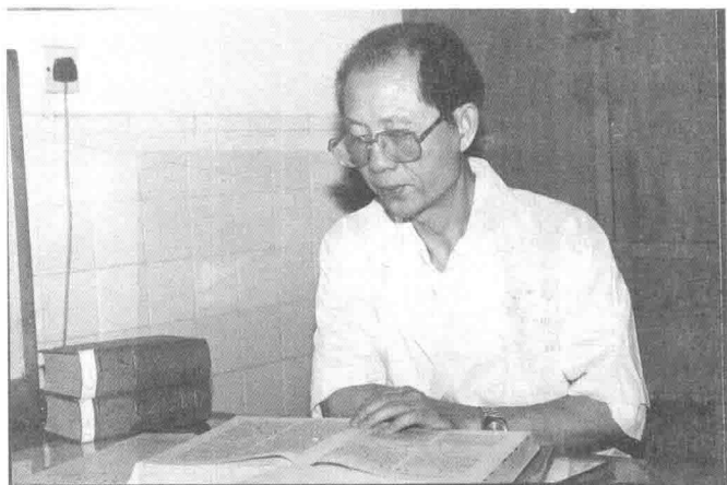
博览经典，精勤不倦