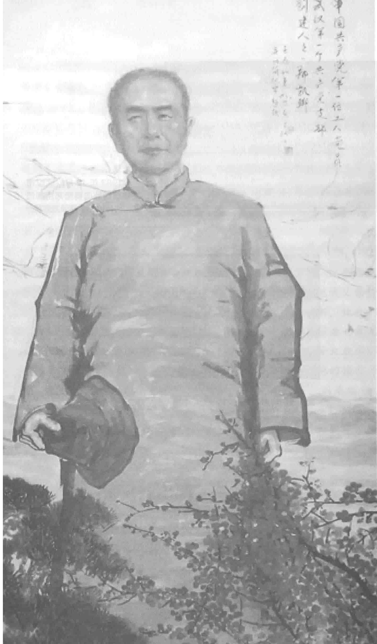
中国共产党第一位工人党员郑凯卿（郑武安 绘画）