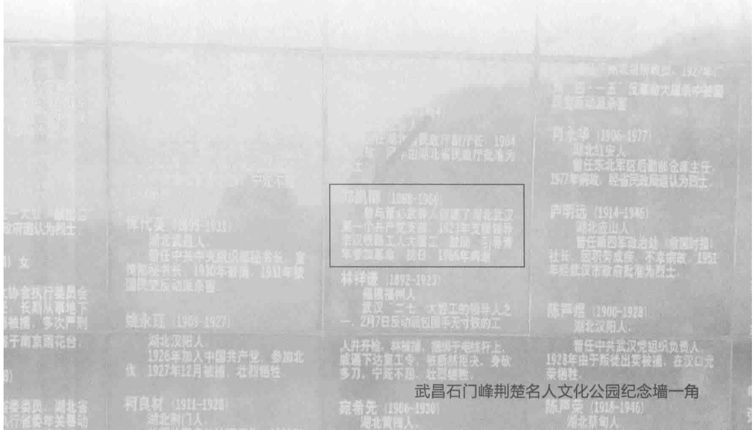
武昌石门峰荆楚名人文化公园纪念墙一角