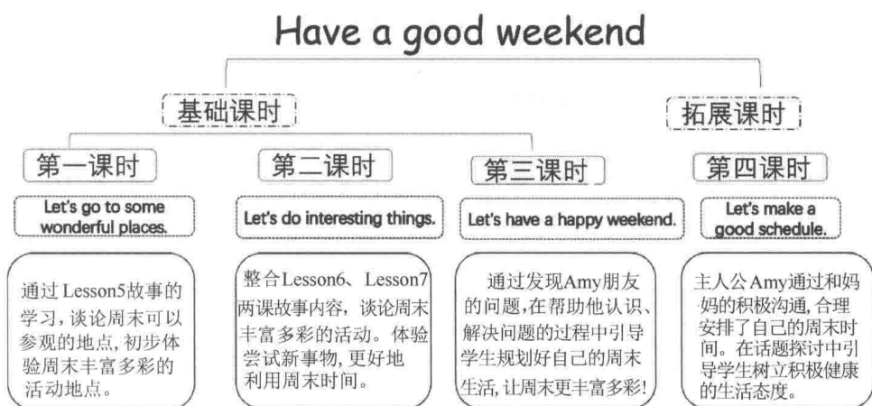
图1 单元整体课时分配情况

第一课时： 教师整合本单元出现的所有相关地点的词汇；学生在老师的帮助下，在活动中可以借助图片、关键词等进行合理的预测和推断，从而提升创新性思维能力并初步体会到周末活动的丰富多彩。以歌谣形式融合复习单元的部分语音教学内容：字母 e、字母组合 ey，学习其在单词中的发音。