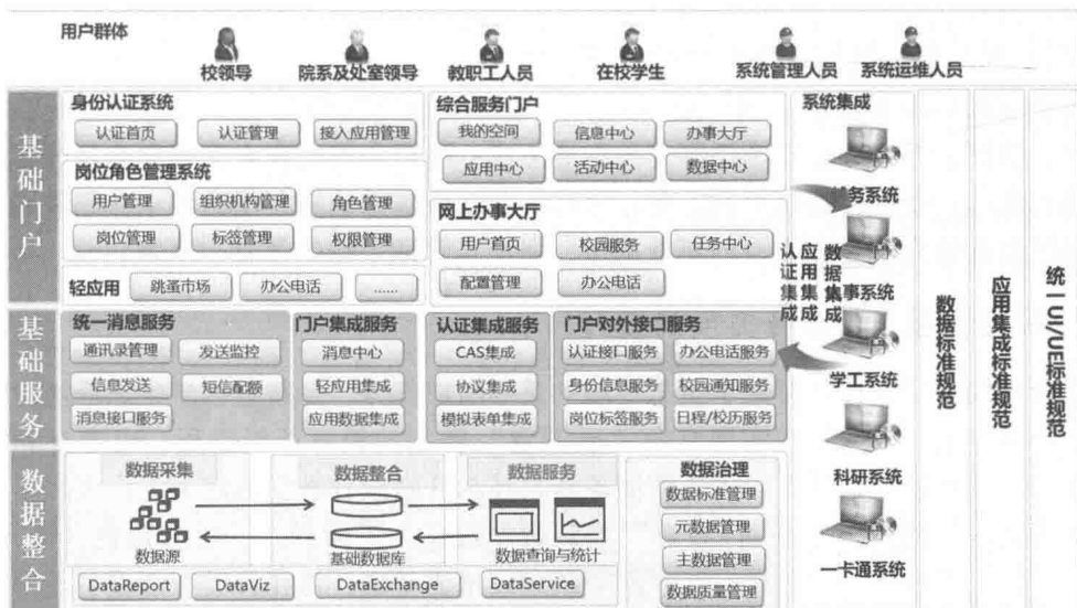
图1 “数字聊大”强大管理功能

完善后的“数字聊大”属于服务型门户平台（如图1所示），以“数据共享、业务整合、一站式服务”为指导思想，基于“以人为本”的管理理念，为教师、管理者、学生提供个性化应用服务，实现互动交流、知识分享、协作科研、协同办公，并以服务为导向为师生提供跨部门一站式服务。该平台全面支持移动化，通过更多移动应用，改变用户之间的交互方式，以信息化手段规范业务流程，最终实现服务信息化、办事简单化，提高了教职工的工作效率。该平台整合了各种通信方式，解决了不同平台间无法进行信息互通的“信息孤岛”问题，在服务师生方面，加快了信息的传达，加强了师生之间的互动和交流，改善了师生的工作与学习环境；在教学管理方面，解决了“开会通知难、思想教育难”的问题，优化了学校的教学管理工作，激励了教师业务水平和学习能力的提高。