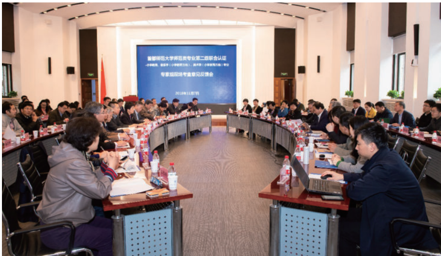
师范专业认证专家考察意见反馈会