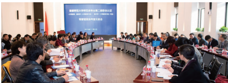
师范专业认证专家组现场考察见面会