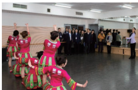
认证专家听课、看课