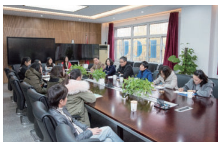
专家参观实习基地