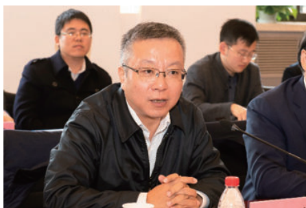
教育部教师工作司任友群司长发言