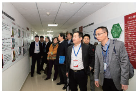
专家团考察初教院文化建设