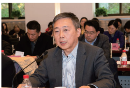
首都师范大学孟繁华校长发言