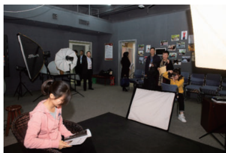
专家参观初教院实验室