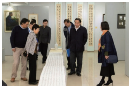
专家参观初教院艺术展