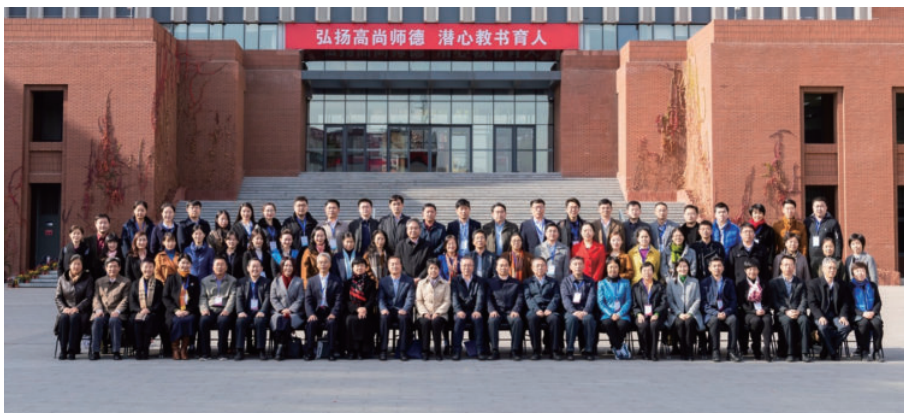
师范专业认证专家、校院领导、部分教师合影