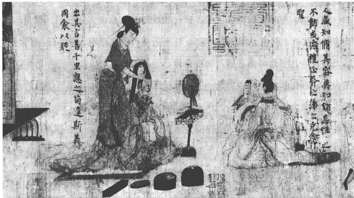
图 1-1 东晋 顾恺之《女史箴图》局部

谦、郑板桥、吴昌硕、齐白石等将书法的笔情墨趣融入到梅兰竹菊、牡丹天桃之中，超出象外，天外有天。如此丰富多彩的笔墨，如此神妙动人的线条，是中国画家们的独创、骄傲与荣耀。笔墨、线条，永远是中国画的基本特征，永远是中国画不可侵权的绘画专业术语。