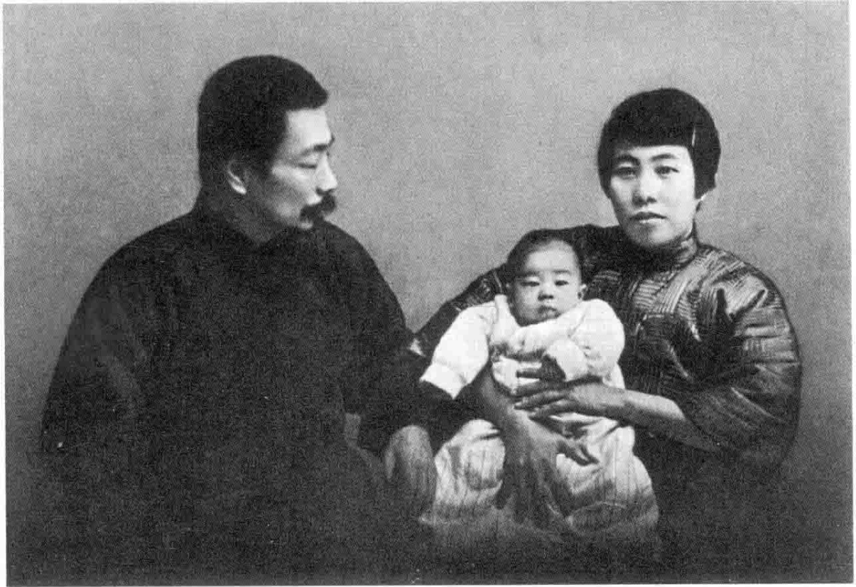
“海婴生一百日”，1930年1月4日摄于上海