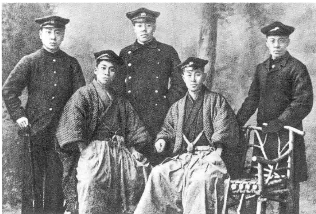
1904 年与日本仙台医学专门学校同学合影（左一为鲁迅）