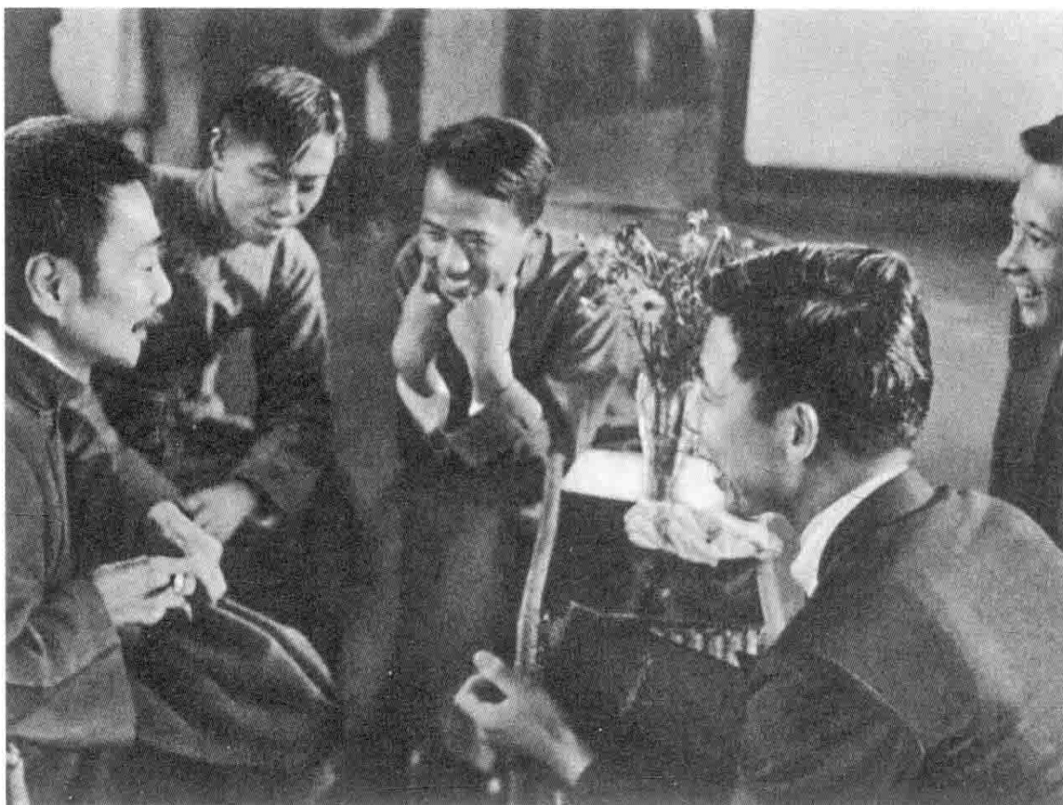
1936年10月8日，鲁迅在上海第二回全国木刻流动展览会上