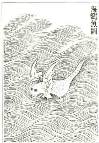
▲中国古籍里提到多种飞鱼，其中一种是海鰐鱼。 选自(清)《古今图书集成》

●《山海经》：我国先秦时期的古籍，一部充满稀奇古怪传说的神话地理志，介绍了上古时期的山川、地理、动物、植物、矿物、巫术、医药、历史、民俗及民族等各个方面的内容。