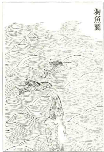
▲狗鱼(即白角儿鱼)潜伏在前方，狙击飞鱼。 选自(清)《古今图书集成》