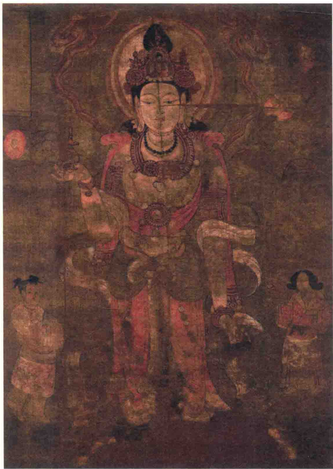
◎ 《观音菩萨像》敦煌遗画