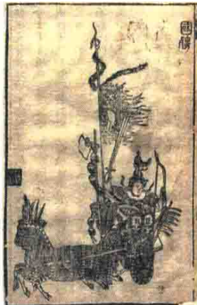
◎萧云从 《离骚图》 之《国殇》