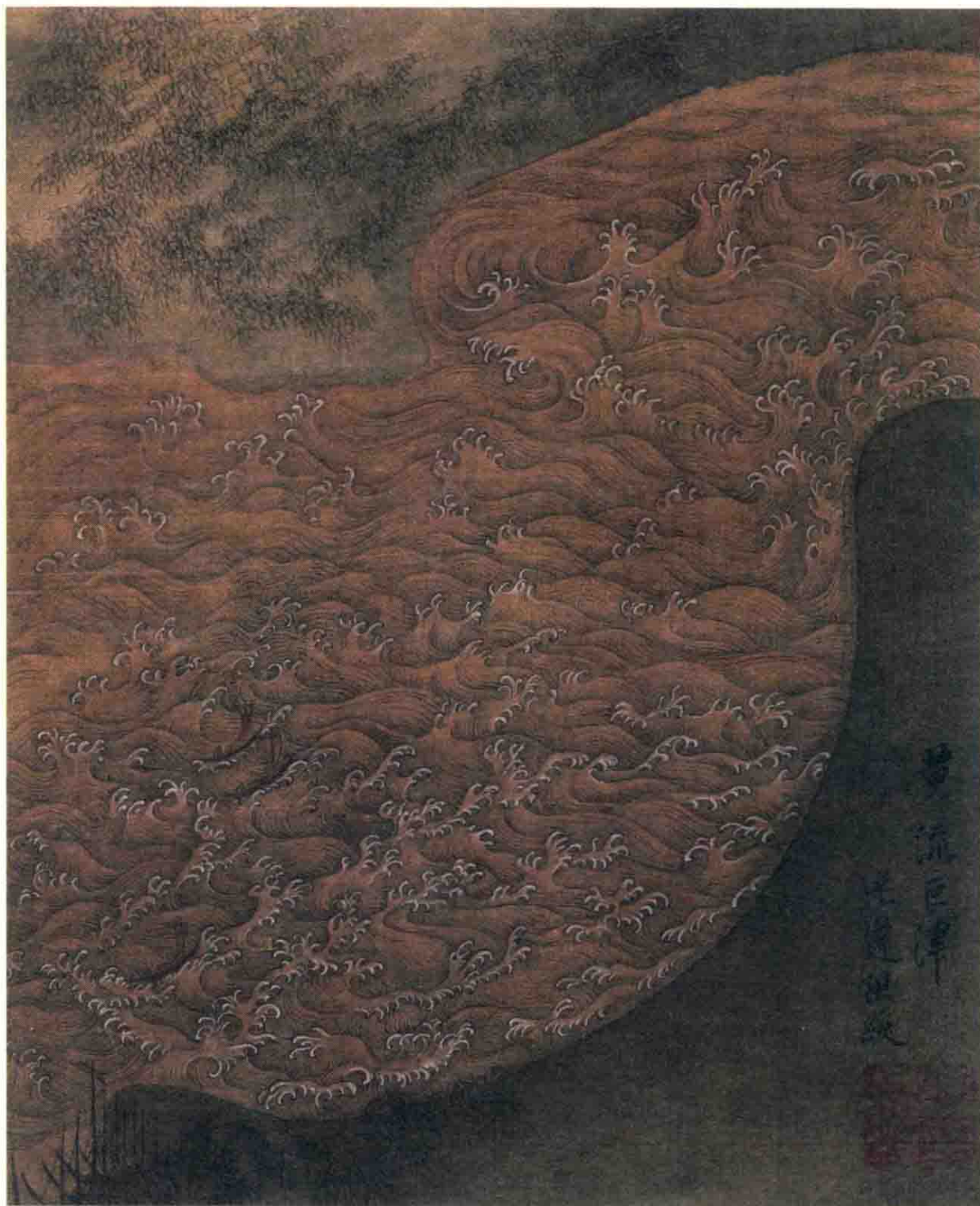
◎陈洪绶《黄流巨津图》