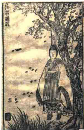
◎萧云从 《离骚图》 之《伯林雉经》