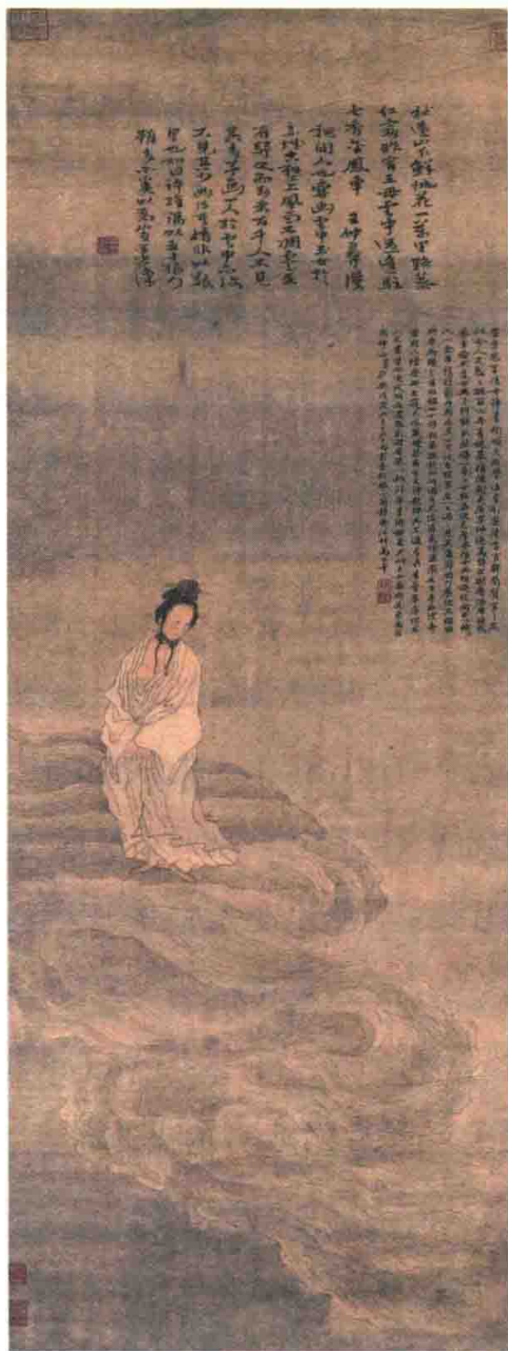
◎崔子忠《云中玉女图》