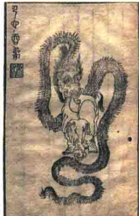
◎萧云从 《离骚图》 之《蛇吞象》

想到 1644 年在煤山上投缢自尽的崇祯皇帝。书里还有一幅《国殇》，一幅《蛇吞象》图。屈原的原文是：‘一蛇吞象，厥大何如？’萧云从注释：南方有灵蛇吞象，三年然后出其骨。蛇画作龙，无疑是暗指女真‘吞食’大明。”