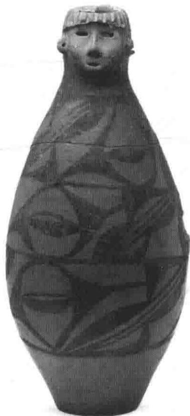
图 1 人头形彩陶瓶

史前陶塑所表现的内容,亦如史前所有文化遗迹,遥远而神秘。在青海、甘肃以及陕西渭河流域和汉水流域一带,先后出土了多件人头形彩陶瓶(图 1-1)*,其中有少女头、老人头,陶瓶的形状都作大腹平底,顶部都开有黄豆粒大小的小孔,其中有些瓶颈处堆塑了缠绕的蛇身,蛇身与人头相连,这说明此类陶瓶并非史前先民的实用性陶瓶,蛇身人首的造型能给我们太多的想象。目前较为普遍的看法是瓶用于装死者的骨骸,瓶顶部的小孔是用于亡灵出入的通道。