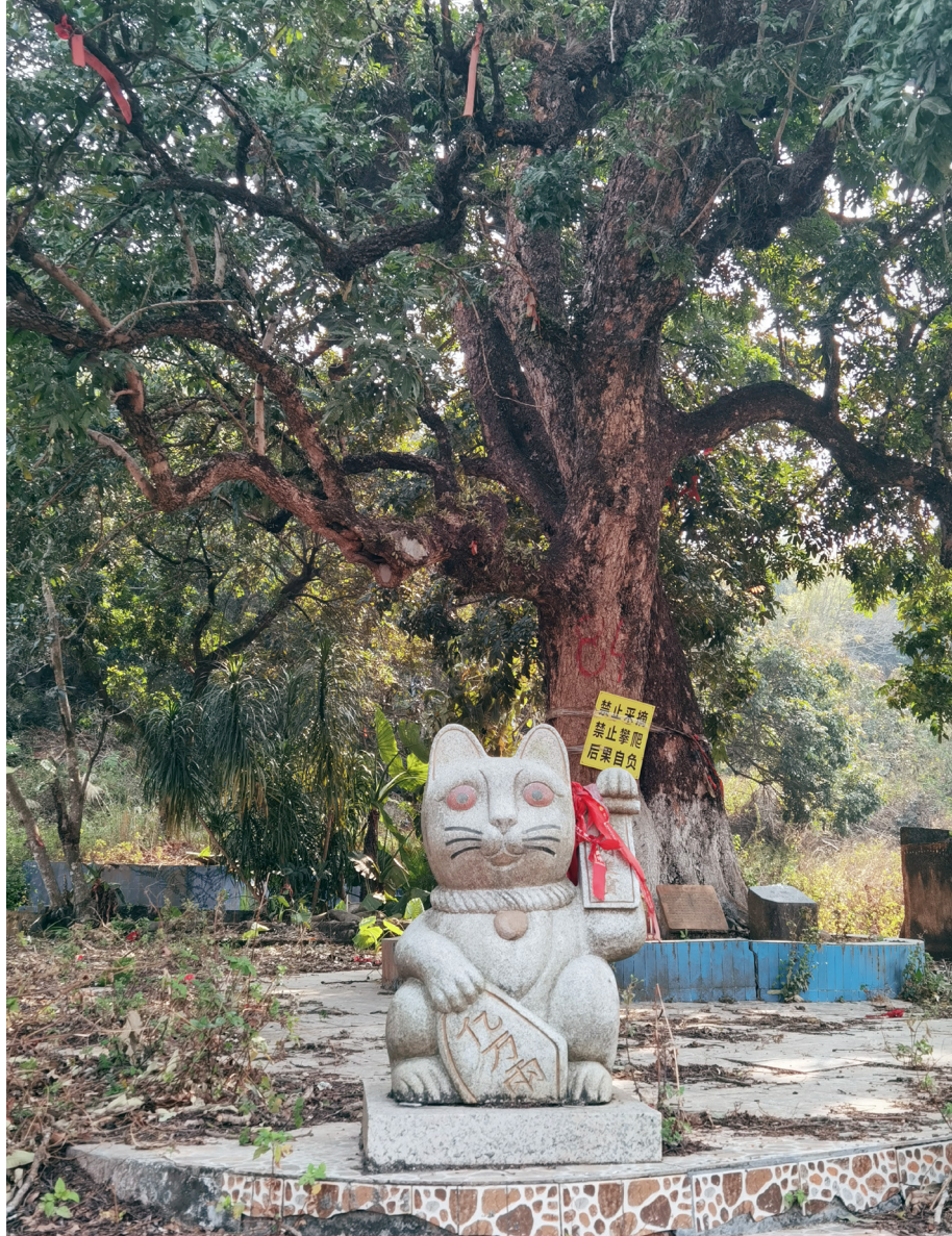
无数棵被崇拜的树木，让这个城市显得镇静。