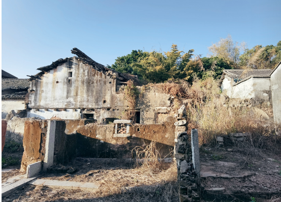
当年都曾高大挺立过，左顾右盼过。