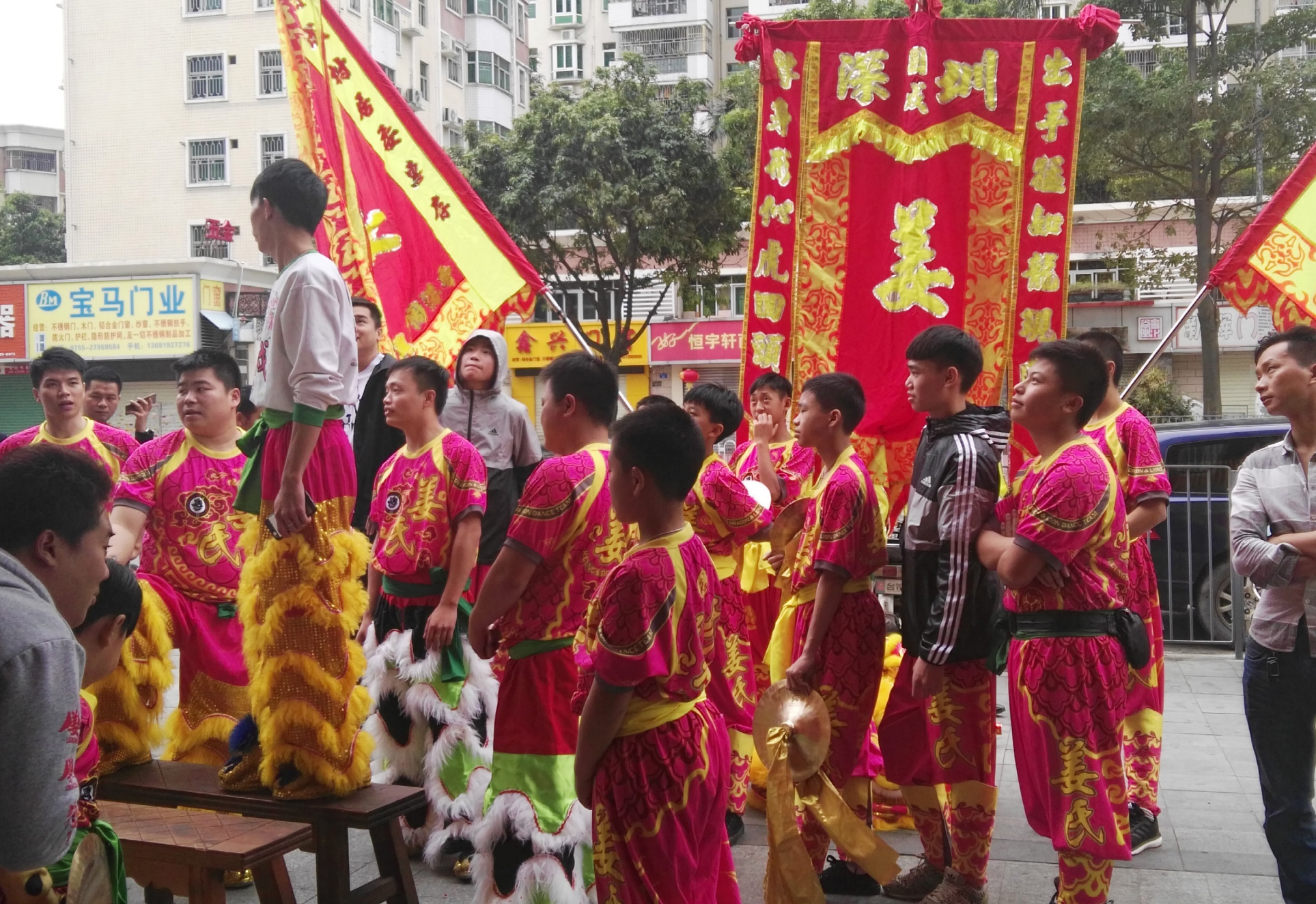
贺新春，舞狮。身着短袖的本土青年。