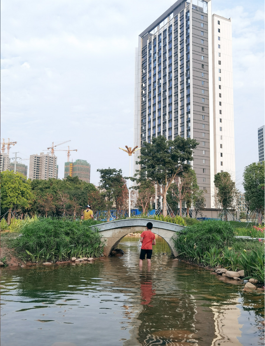
楼房的洗脚盆上，也可以架一座桥。