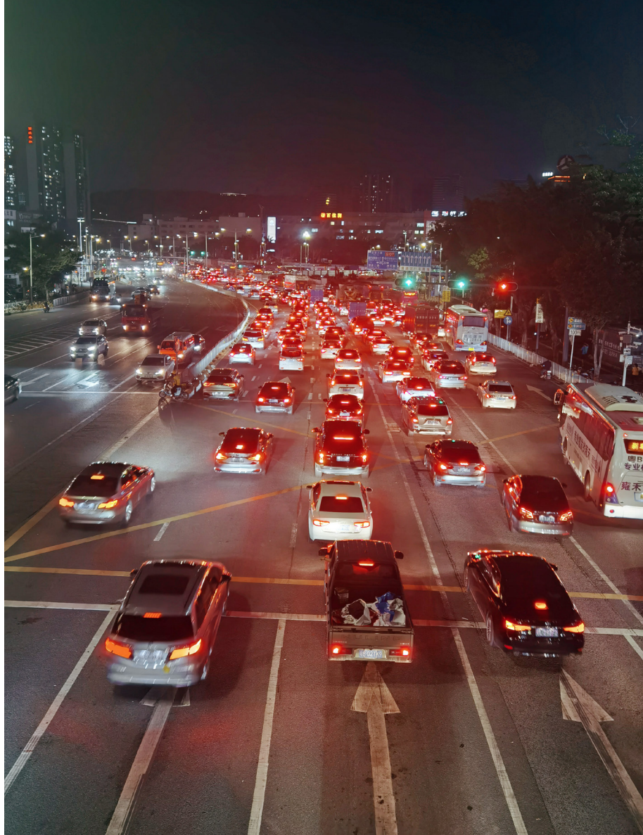
一个个行走的灯，照得清眼前的路程，但还是要等待天明。