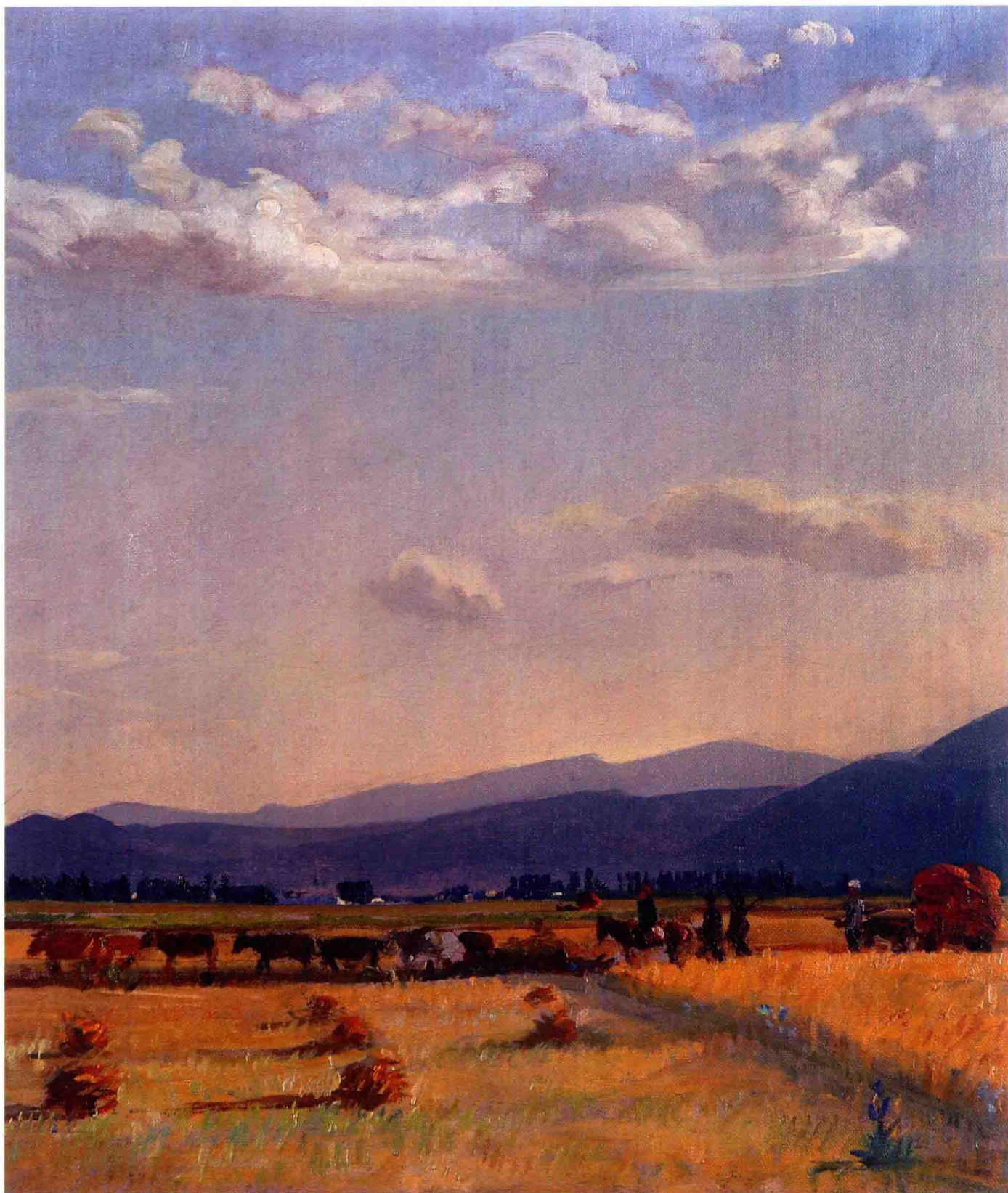
▲《科尔察村庄收获的一天》，万久什·米奥所作。现藏于地拉那国家美术馆。