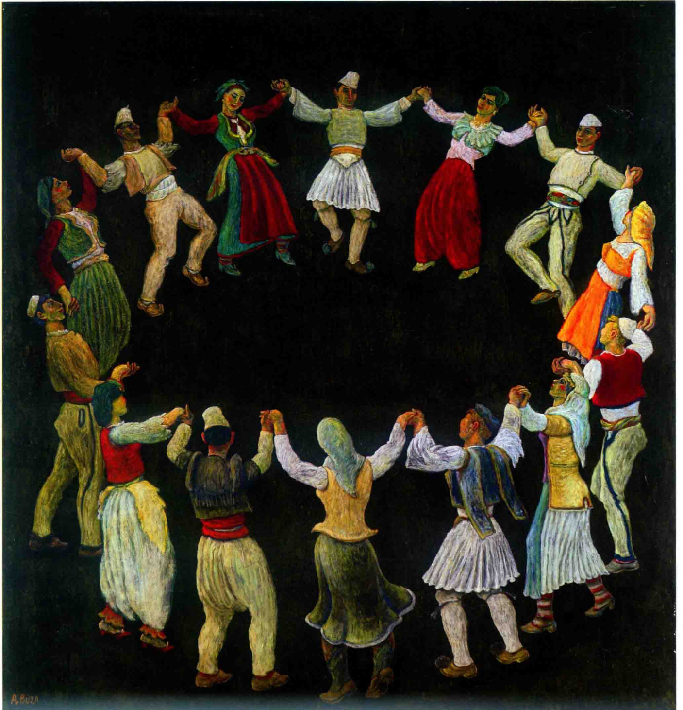
▼《舞动的阿尔巴尼亚》，阿布杜拉希姆·布扎1974年所作。现藏于地拉那国家美术馆。