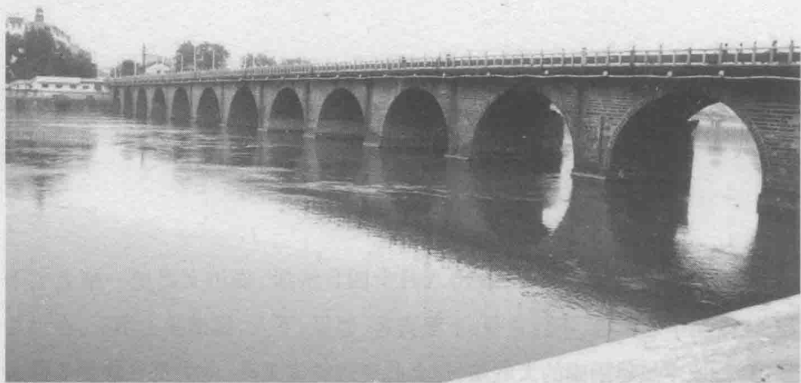
◎抚州城内的文昌桥

桥畔思乡二首》《雷阳初归，别乐少南文学。文学故从其大人之燕，归青云峰读书，谈予所居北垣回武曲东井映文昌为胜，漫云》等。