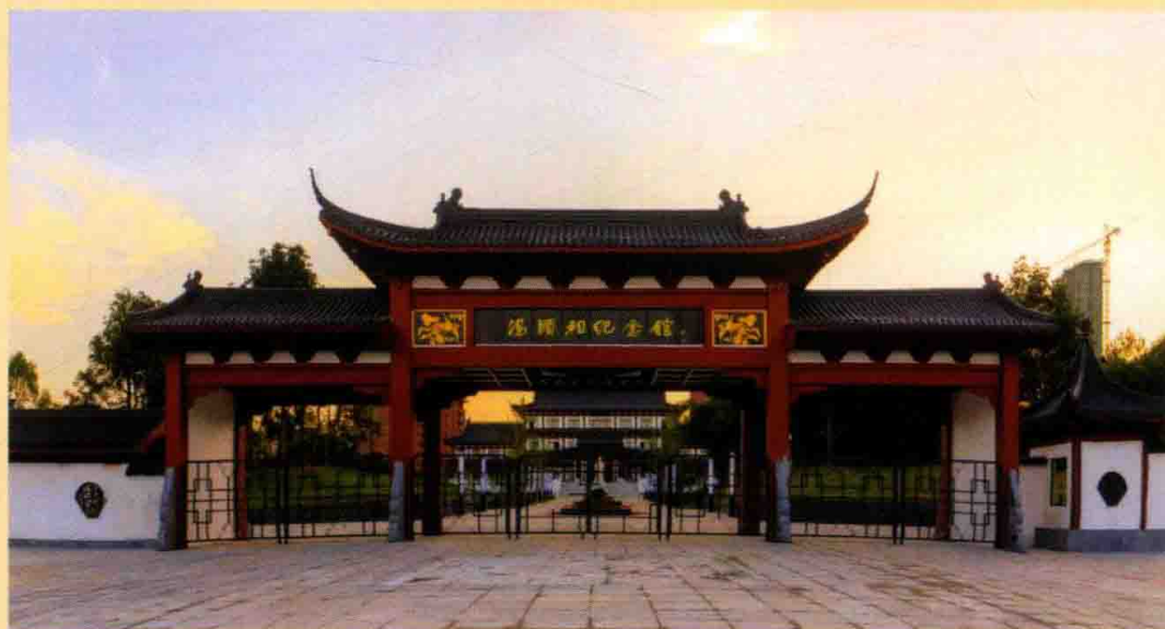
◎汤显祖纪念馆