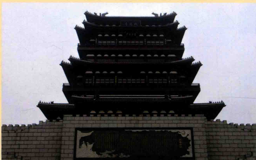
◎汤显祖师从徐良傅读书处抚州城内拟岘台(2015年完成重修)