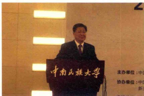
中国生物多样性保护与绿色发展基金会秘书长周晋峰作主旨发言