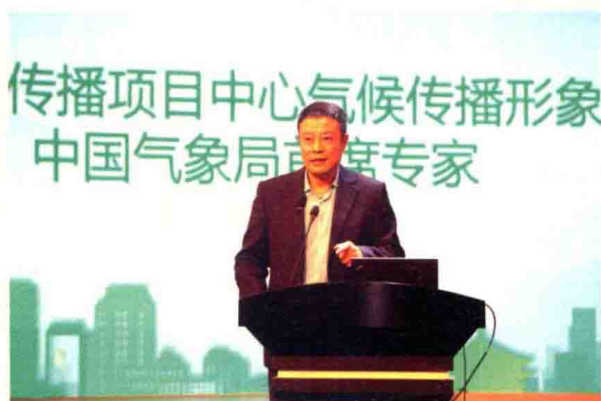
项目中心气候传播形象大使、中国气象局首席专家宋英杰作大会发言