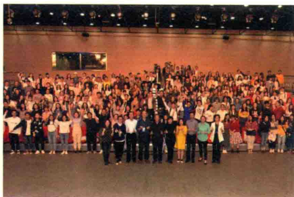
部分参会嘉宾与广西大学学生在一起