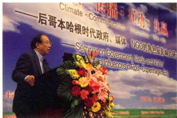
中心顾问、中国人民大学新闻学院院长赵启正致辞