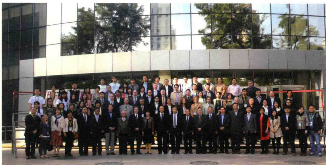
出席 2013 气候传播国际会议全体代表合影

（相关内容见本书第 43～45 页。）