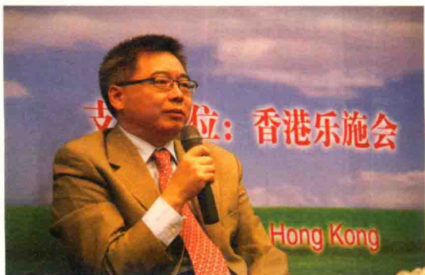
国家发改委应对气候变化司司长苏伟致辞