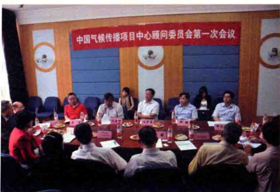
中国气候传播项目中心顾问委员会第一次会议召开