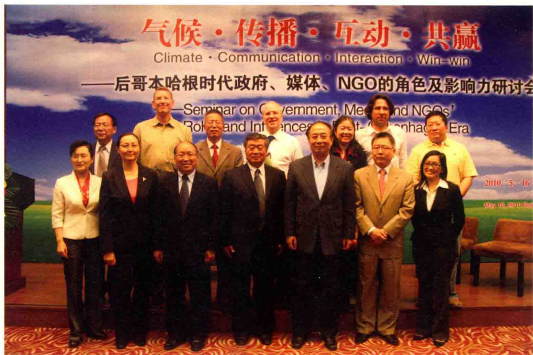
出席研讨会的嘉宾