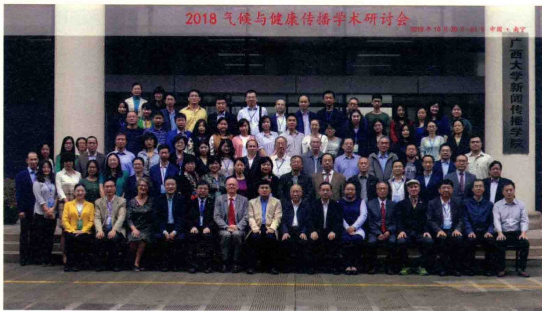
参会全体代表合影