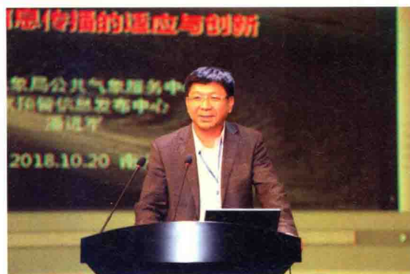
中国气象局公共服务中心副主任潘进军作大会发言