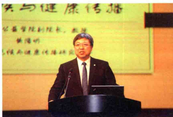
项目中心顾问、中国国际民间组织促进会董事长黄浩明作大会发言