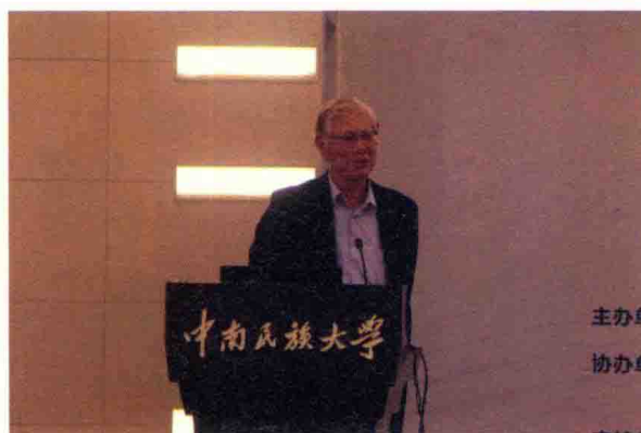
中国台湾大学自然资源与环境管理研究所所长李坚明教授作大会演讲