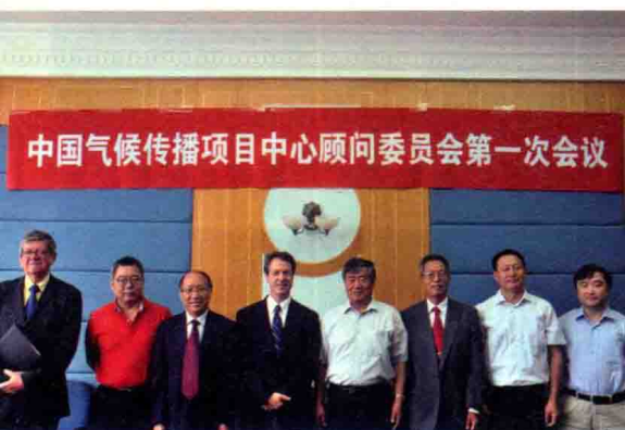
到会部分顾问委员会成员合影