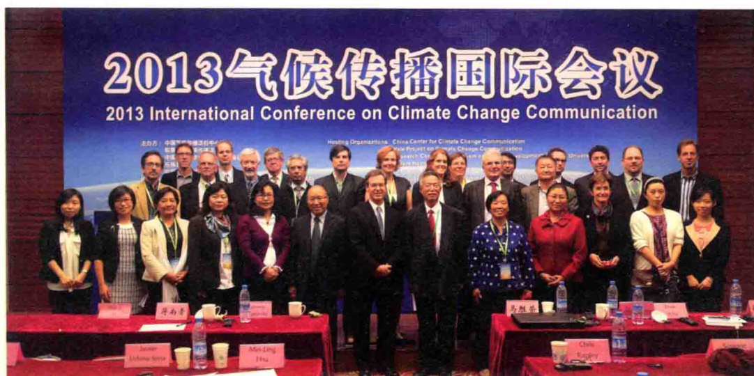
出席会议发言嘉宾合影