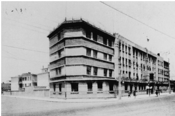
法租界贝当巡捕房

法租界巡捕房还有：小东门巡捕房，位于今中山东二路，后曾翻建；大自鸣钟巡捕房位于今金陵东路174号，曾两次翻建，后改称北门巡捕房和麦兰巡捕房，1935年后有牢房32间；八仙桥巡捕房，曾迁址卢湾区淮海中路淡水路口，后撤销；卢家湾巡捕房，1918年迁到今建国中路22号，遂称中央巡捕房，又称卢家湾巡捕房。巡捕房拘留所设在办公楼底层，有牢房30多间，分布在阴暗潮湿的3条夹弄内，面积280多平方米，最多关押300—400人；顾家宅巡捕房，位于今复兴公园附近，后撤销；宝昌路巡捕房，后易名霞飞路巡捕房，位于今淮海中路，后