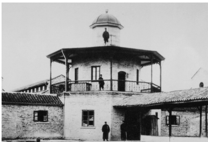
位于中央位置的漕河泾监狱瞭望楼

个字为各监之代号；监狱的西南角为女监，系一独立小院，有监舍三翼。1924年经扩建，增加东南和西南二翼，各监舍重新以甲、乙、丙、丁、戊、己、庚7个字命名；1926年又增建可容500人的教诲堂；到1930年代监狱占地120亩，上海陆根记营造厂参与建造。 ① 1937年“七七”事变后，上海形势紧张，江苏第二监狱奉令解散，在押犯人分别被移押或保释。监狱建筑被日军炸毁成为一片废址。上海解放后，这里曾成为上海人民法院监狱漕河泾农场；1958年起建立了上海市少年犯管教所，1969年撤销，1974年少年犯管教所在此处恢复使用。20世纪末该处建筑拆除土地批租，其中部分地块现为上海华夏宾馆、光大会展中心。