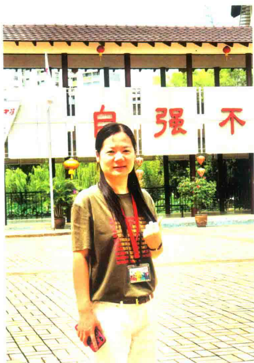
访学行程之参观新加坡中正中学