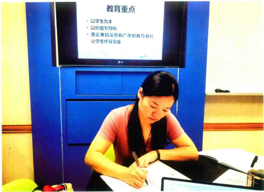
访学日常之听课、做笔记