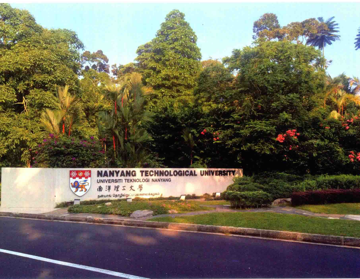
掩映在绿色中的南洋理工大学