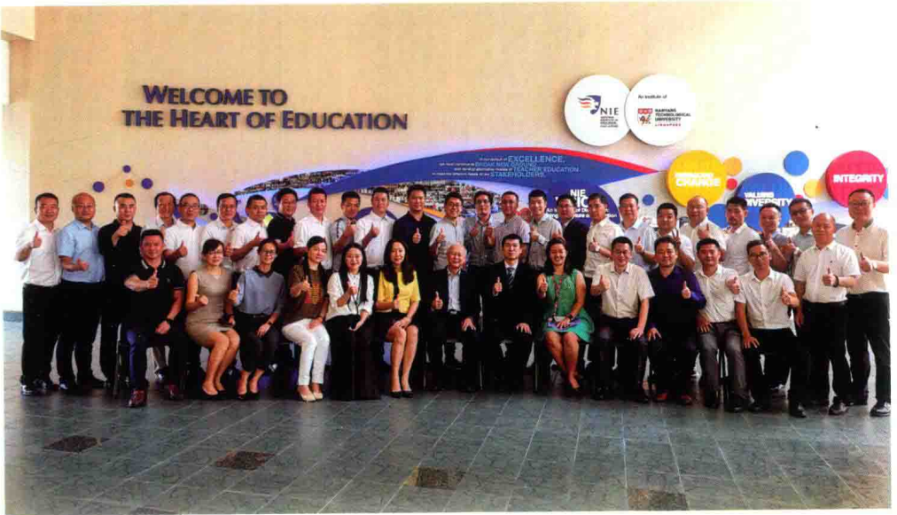
访学成员的“全家福”