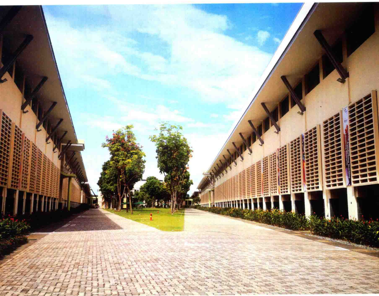
南洋理工大学教育学院内景