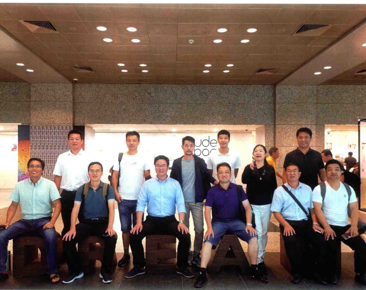
访学行程之参观新加坡重建局