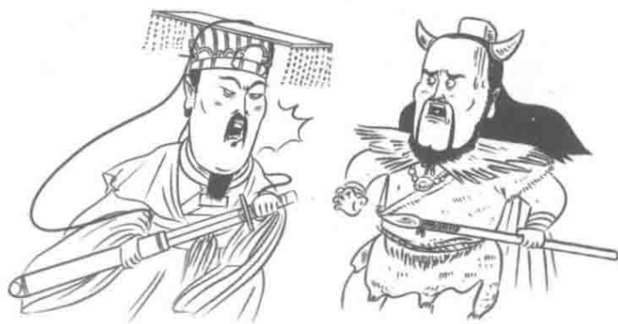
Round 3 黄帝vs蚩尤， 黄帝胜