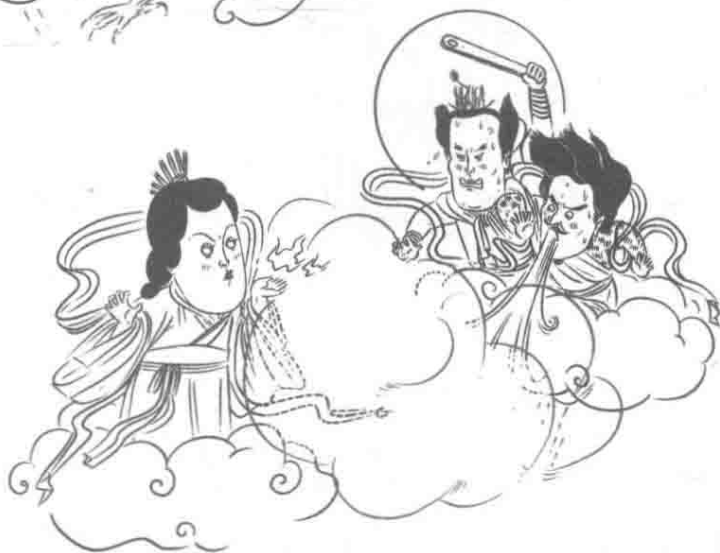
Round 2 女魃vs风伯雨师， 女魃胜