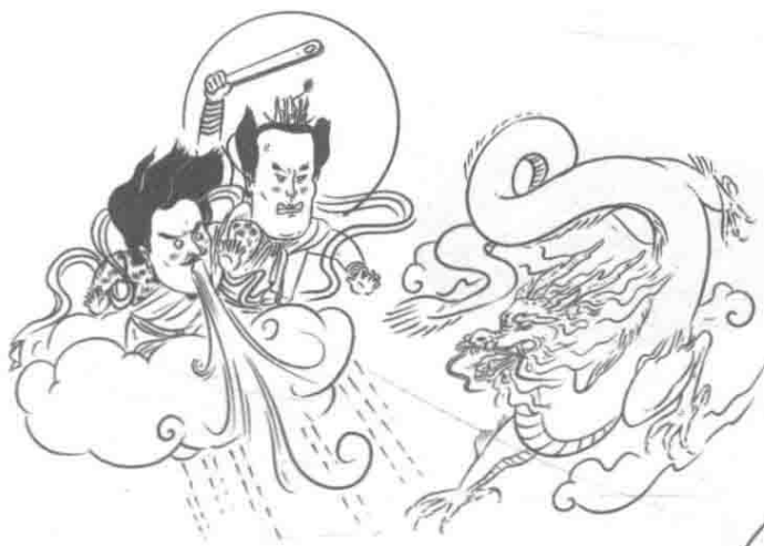
Round 1 应龙vs风伯雨师， 风伯雨师胜

涿鹿之战还有种比较传奇的说法。据说黄帝派应龙去冀州野外抵御蚩尤。应龙是一条神龙，它积蓄洪水攻击蚩尤。蚩尤请来风伯、雨师，带来的雨水比应龙更厉害。黄帝就又搬来旱神女魃相助，她散发出旱力阻止了狂风暴雨，这样黄帝才攻杀了蚩尤。