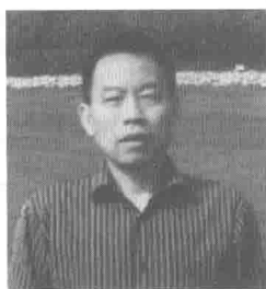
中国人民警察大学原科研院所所长