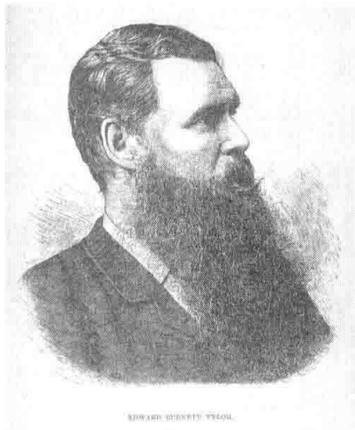
图 1-3 爱德华·泰勒

这种理论是建立在对原始艺术作品与原始宗教巫术活动的研究基础上提出来的。巫术说又被称为泰勒—弗雷泽理论。巫术说认为艺术活动起源于原始民族的巫术仪式活动。