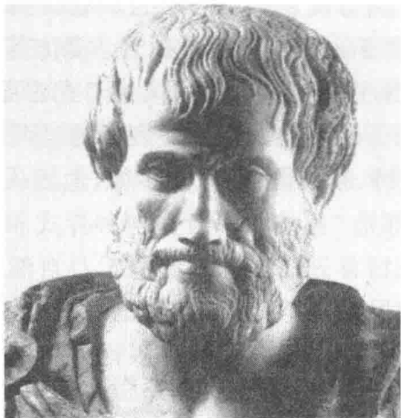
图 1-2 亚里士多德雕像

古希腊哲学家柏拉图(公元前 427—公元前 347),他提出艺术是模仿。然而,他所说的模仿是指对物质世界的物像的模仿,是物的外形相似。他认为自然界不是真实存在而只是理念世界的影子,模仿自然的艺术只能是影子的影子,因此,只能模仿外形,不能模仿实质。其后的亚里士多德则照样首先肯定人类的“模仿本能”,并进一步把艺术的起源、艺术的本质归结为“模仿”,一方面是人类有模仿的天性,另一方面这种模仿活动又能引起人的快感,于是由此产生了艺术。他还进一步推论,艺术活动中的不同门类,是由于模仿的对象、模仿的媒介和方式不同而形成的。