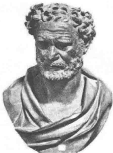
图 1-1 德谟克利特雕像

艺术起源于模仿说是一种关于艺术起源问题的最古老的理论,始于古希腊哲学家。这种学说认为:模仿是人类固有的天性和本能,艺术起源于人类对自然的模仿。在古希腊哲学家看来,所有艺术都是模仿的产物。主要代表人物是两千多年前古希腊哲学家德谟克利特、柏拉图、亚里士多德,他们认为模仿是人的本能,所有的文艺都是“模仿”,不管是何种样式和种类的艺术。古希腊的德谟克利特首先提出艺术起源于对自然的模仿。他认为人的主观感觉和思想既不是天生的,也不是神赋予的,而是从客观事物的“影像”中产生的,人的许多行为和创作是从对自然的模仿中来的。