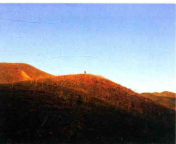
○ 山顶上那匹年轻的马