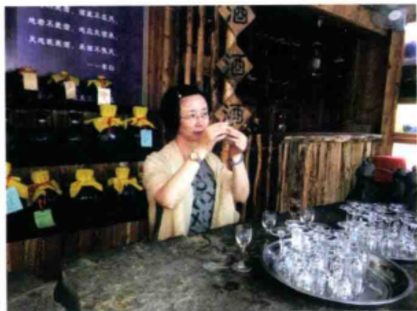
○ 在肖尔布拉克酒厂