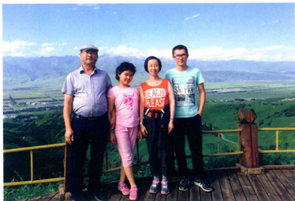
○ 在那拉提空中草原