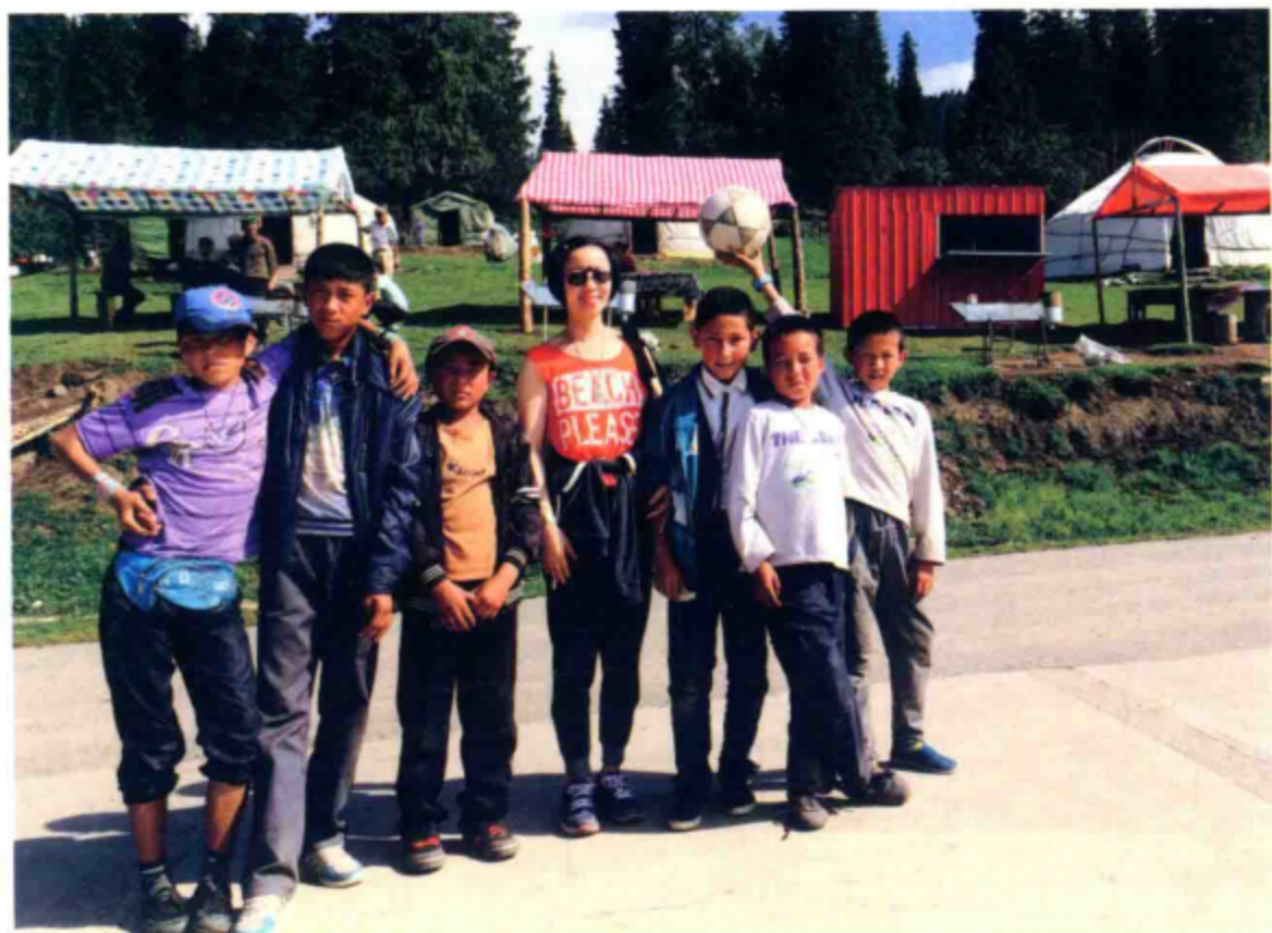
○ 与阿尔善村夏牧场的孩子们