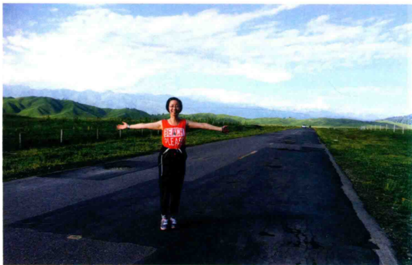
○ 走在空中草原的大路上