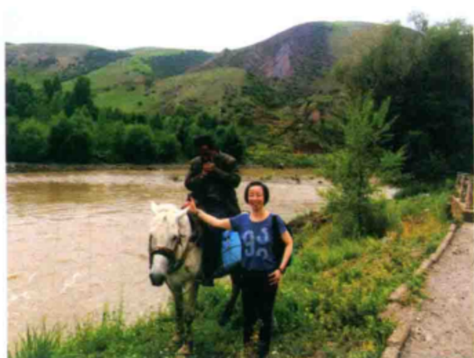
○ 在新源县城的后山