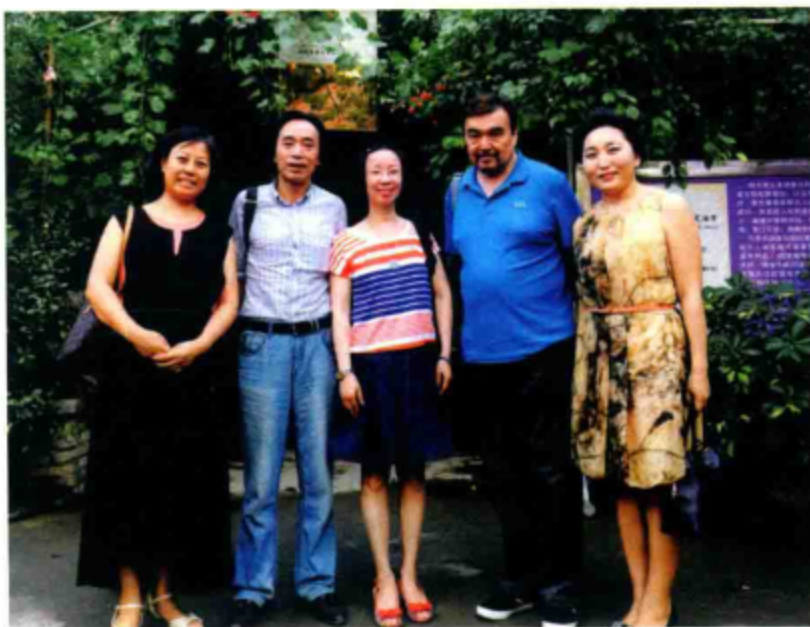
○ 在霍城薰衣草园与新老文友