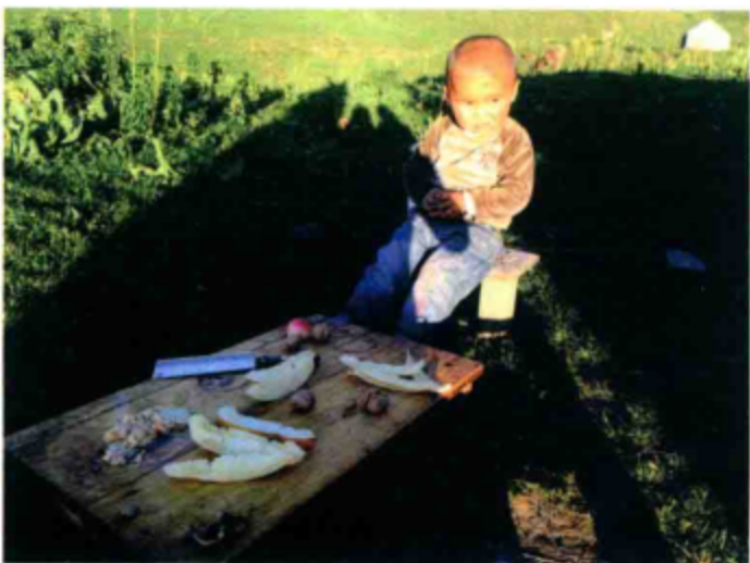
○ 房东家的小叶拉萨