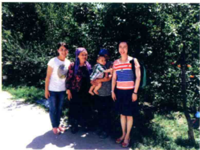
○ 与则克台镇的阿尔达克一家