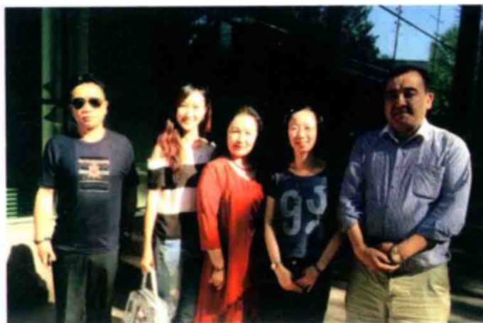
○ 与新源县文艺界人士