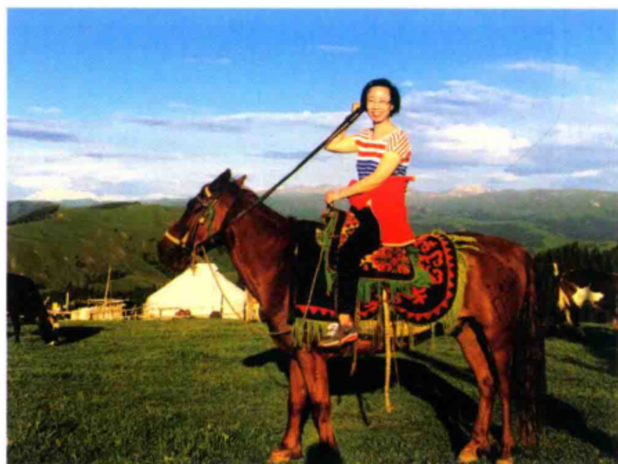
○ 骑马登上沃尔塔交塔