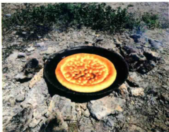
○ 昂沙尔烤的地锅馕