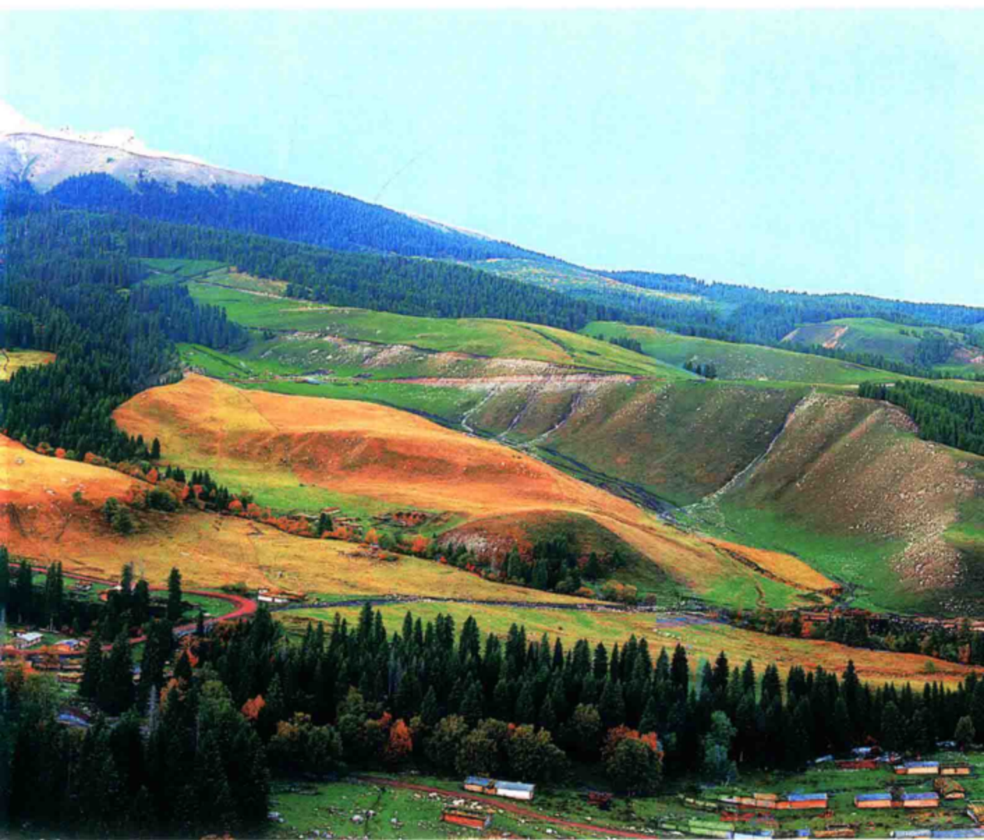
○ 特克斯县喀拉达拉镇历史文化名村琼库什台