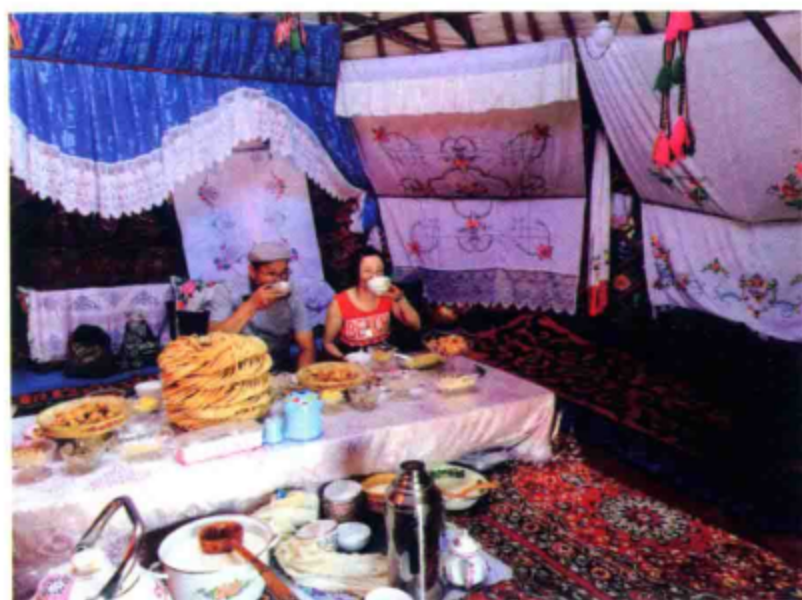
○ 在孔巴合提弟弟家的毡房