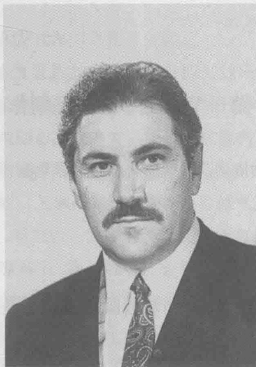
格里高利·丘赫莱依(1921年5月 23日—2001年10月29日)