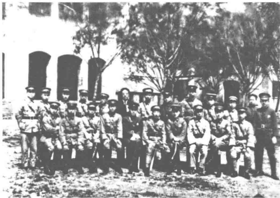
图 1-2 1928 年 5 月 3 日上午,蔡公时(前排左六)与山东交涉署工作人员合影。当晚,蔡公时及 16 名工作人员即遭日军杀害

日本包围北伐军交涉署,抢夺文件。山东特派交涉公署交涉员蔡公时(曾留学日本)表示严重抗议。日本军官竟然要他跪下来,蔡公时严词拒绝。日本人就用手枪打死蔡的一个同伴,再问蔡跪不跪。他坚决不跪。他们又再打死了一个中国人,再问他跪不跪。待到十几个中国人一个个都被日军打死了,蔡特派员仍不跪。日本军官又叫两个兵拿枪来敲他两腿,使他跪下来,把他的脚膀都敲断了,最后倒下。蔡公时大骂“日本军阀”,日军惨无人道地剪掉了他的舌头,剜去他的双眼,割掉他的鼻子,再用手枪打死他。按照国际法,两国相战不斩来使,但日军却野蛮残暴地杀害了中国外交官。