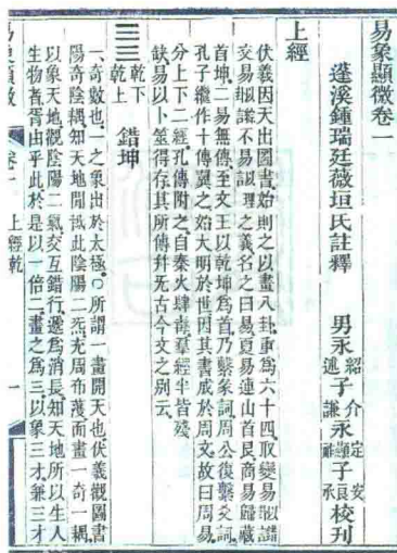
钟瑞廷撰《易象显微》书影