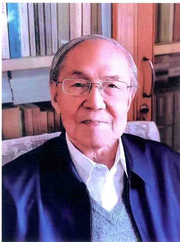
・作者近照（摄于2021年5月6日）