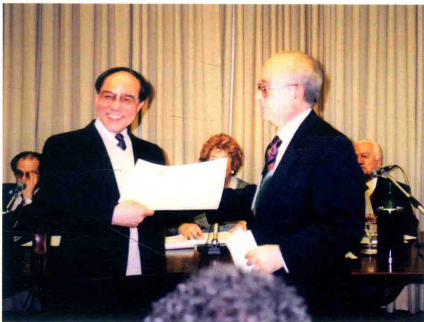
·在意大利蒙德罗国际文学奖颁奖会上（1995年12月）