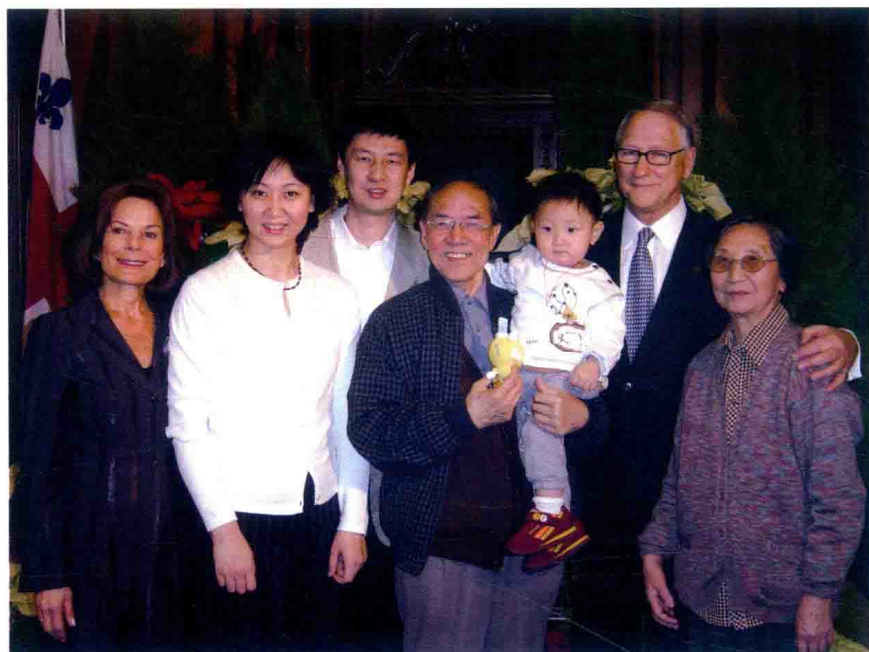
· 在圣诞联欢会上与加拿大蒙特利尔市市长夫妇合影（2004年12月）