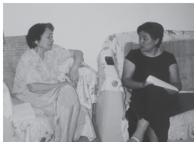
教育部第一任大学英语指导委员会主任，清华大学陆慈教授（左）