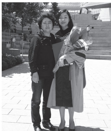
在 MIT 参加女儿博士毕业典礼与女儿合影