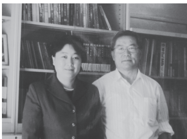
原大学英语四六级考试委员会主任，上海交大杨惠忠教授（右）