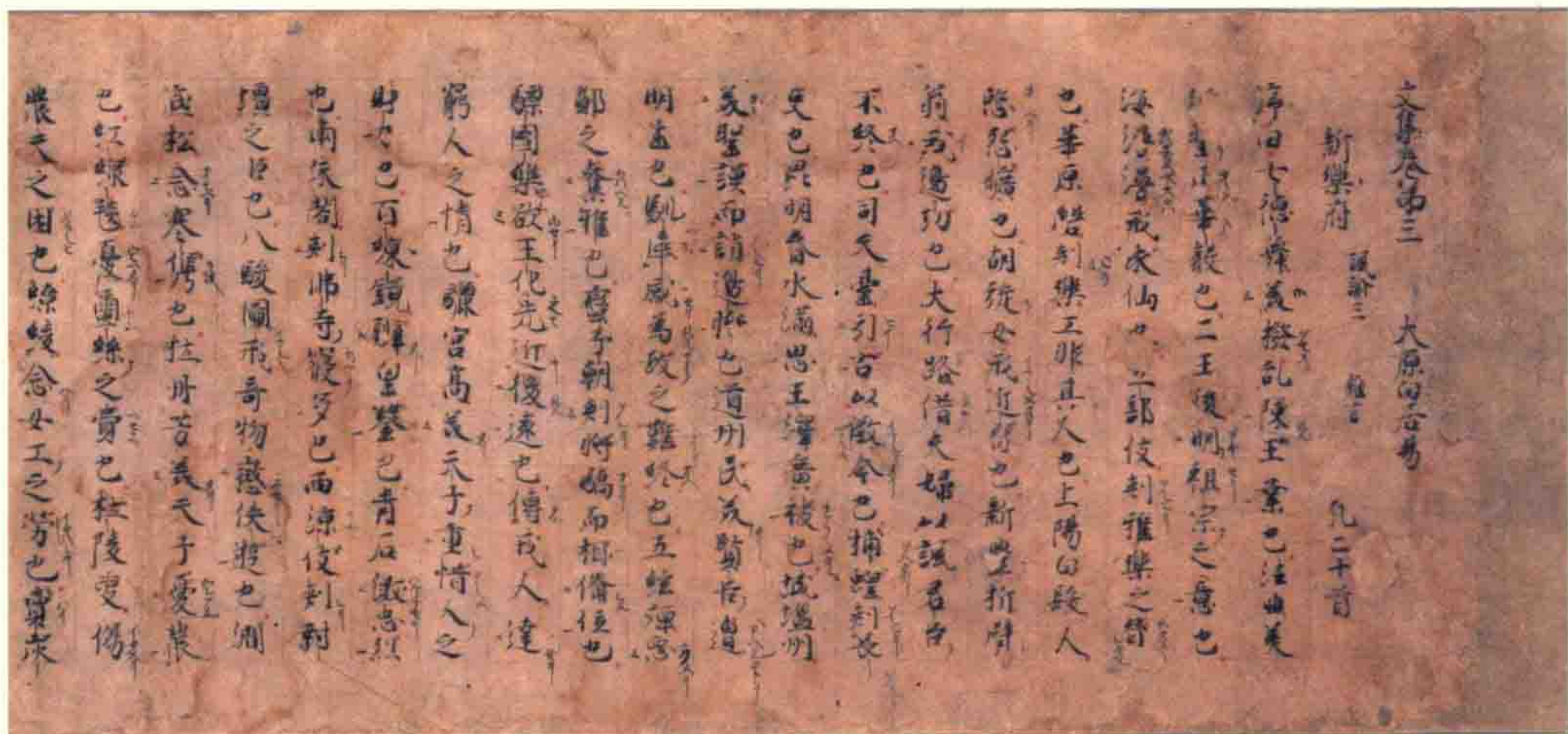
图 1-1 唐人墨迹《白居易》

是注意站姿与学会拿好毛笔，都费了老鼻子劲，当然更不可能打通他们的书法“任督二脉”。