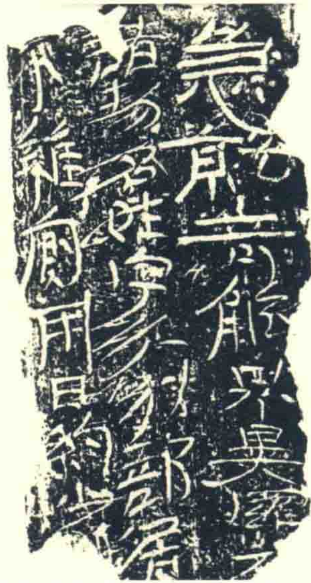
图 1-2 汉砖与居延汉简

书写的场景，除了书斋，市井、公堂，车马、舟船，山林、城市，甚至战场，都可以成为书法书写的地点。