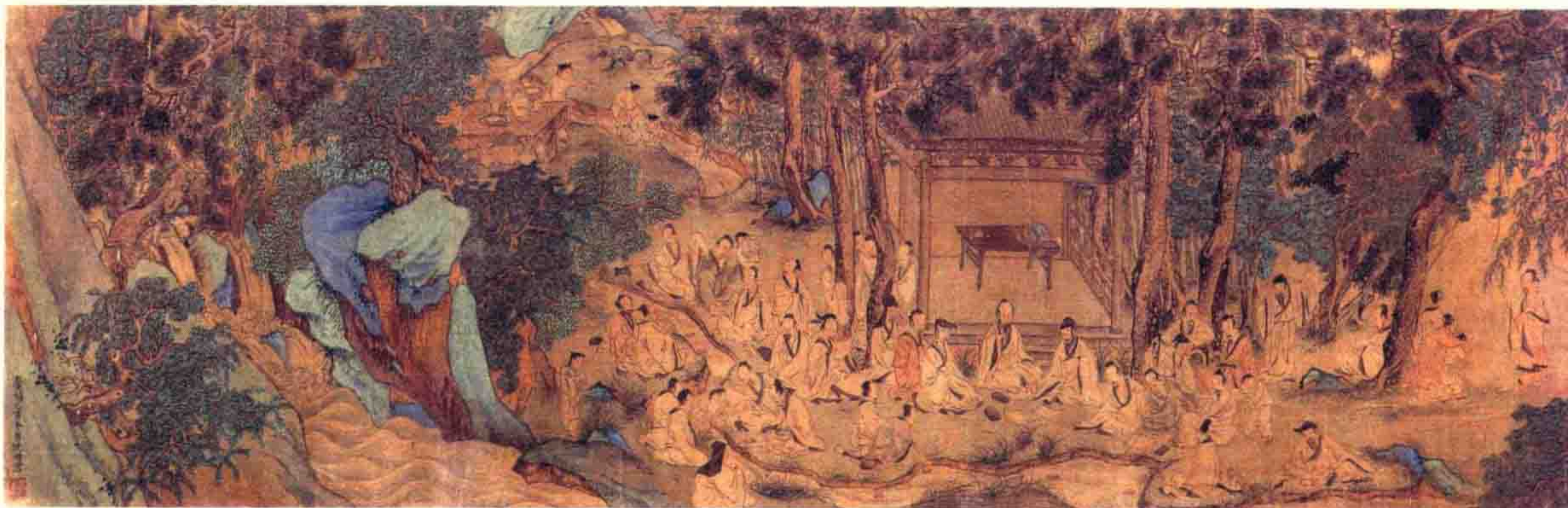
图一〇 《兰亭修 图卷》