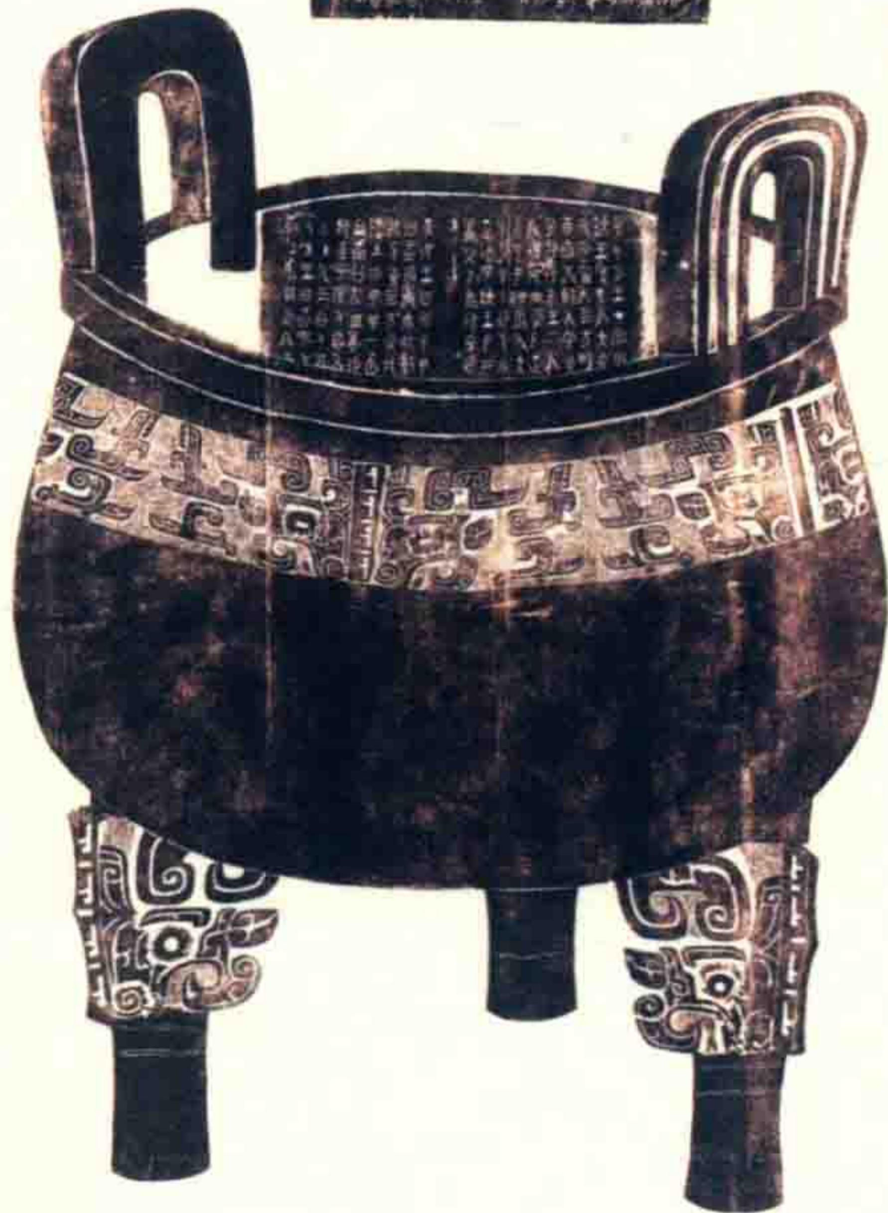
图 1-4 大盂鼎全形拓